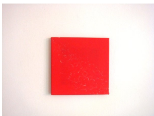
Franz Amann Ohne Titel (rotes Quadrat), 2011 Plastiksack, Münzabdrücke 24 x 24 cm