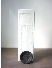
Franz Amann Ohne Titel (Sockel mit Teller), 2011 Sockel, Teller, Ölfarbe 99,5 x 30,5 x 40 cm

Franz Amann – Die Farbe ändert nichts an der Funktion 19. Oktober – 12. November 2011