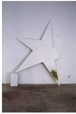
Franz Amann Ohne Titel (castrated), 2011 Öl auf Leinwand Sockel 246 x 225 x 38 cm

+43 1 524 5490 gallery@emanuellayr.com www.emanuellayr.com