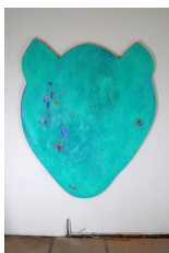
Franz Amann Grüner Gepardenkopf, 2009 Öl auf Leinwand 210 x 170 x 4,2 cm