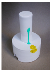
Franz Amann Zweizylinder, 2011 Keramik (artwork ceramics Lisa Berger) Ölfarbe Papier 70 x 31,5 x 31,5 cm