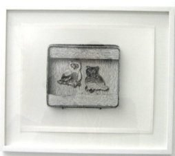
Franz Amann Freudenauer Schachtel (Käuzchen vom Kunstraum Dornbirn), 2011 Print auf Baryt (Ulrich Dertschei)