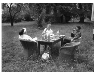
Franz Amann Picknick nach Schakalen, 2011 C-Print auf Baryt (Hella Fidesser) 21,5 x 25 cm 1/3 +1 AP