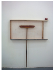
Franz Amann Besenkasten, 2011 Holz Farbe Keramik (artwork ceramics Lisa Berger) Besen 177 x 124,5 x 11 cm