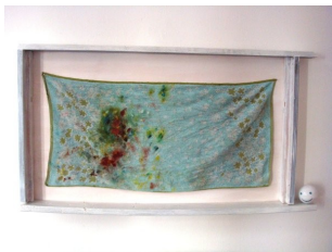
Franz Amann Handtuchkasten, 2011 Holz Farbe Keramik (artwork ceramics Lisa Berger) Ölfarbe Tempera auf Handtuch 160 x 66 x 11 cm