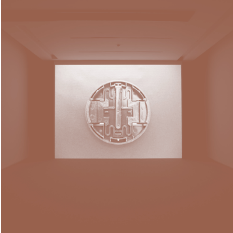
Vista de / View of Stargate , 2006. Foto / Photo: António Nascimento, 2006