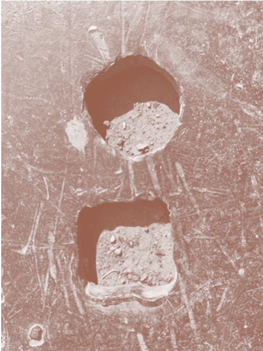
Fotograma de / Still of Square and Circular Sounds , 2020.