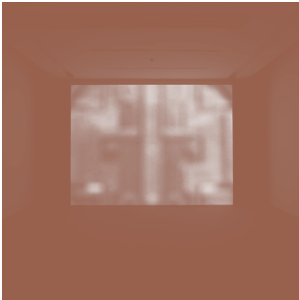
Vista de / View of Stargate , 2006.

Alexandre Estrela's work is an investigation about the essence of images that expands spatially and temporally through different supports. In his videos and installations, Estrela examines the subject's psychological reactions to images and their interaction with matter. The works are not just there to be watched, but rather to be unfolded. Each piece evokes synesthetic experiences, visual and auditory illusions, aural and chromatic sensations that function as perceptive traps, leading the subject toward different conceptual meanings. With this strategy, Estrela questions the elements that constitute the act of perceiving, splitting vision into more sensible dimensions, towards the unseen and the unheard.