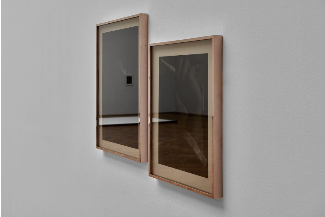
Yan Xing, Installationsansicht Dangerous Afternoon , Kunsthalle Basel, 2017.