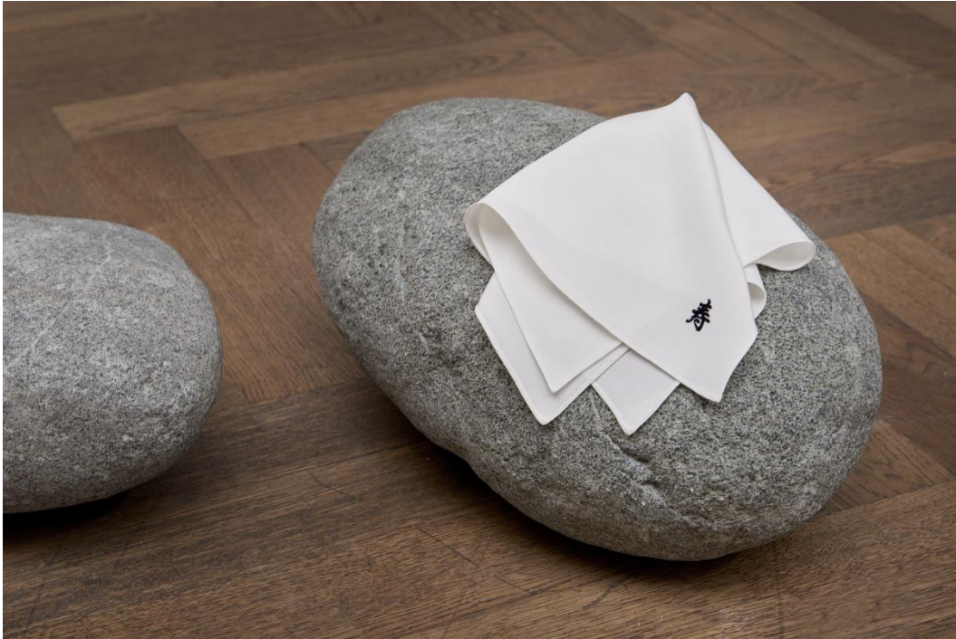
Yan Xing, Installationsansicht Dangerous Afternoon , Kunsthalle Basel, 2017.