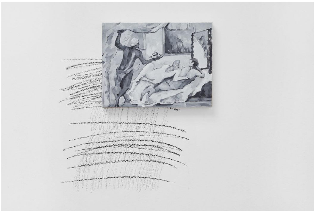
Yan Xing, Installationsansicht Dangerous Afternoon , Kunsthalle Basel, 2017.