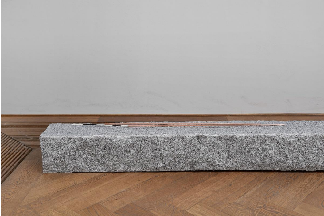
Yan Xing, Installationsansicht Dangerous Afternoon , Kunsthalle Basel, 2017.