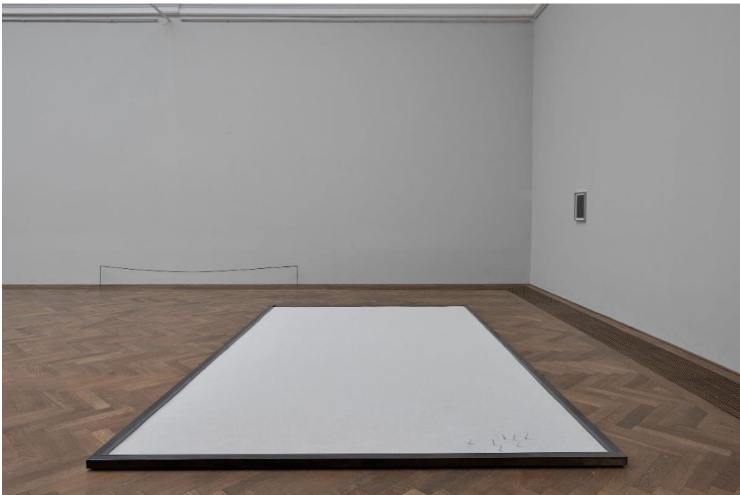
Yan Xing, Installationsansicht Dangerous Afternoon , Kunsthalle Basel, 2017.