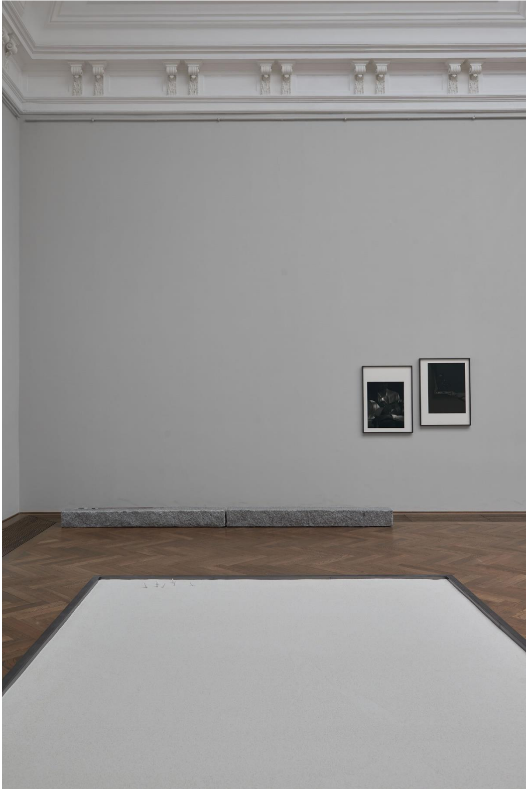
Yan Xing, Installationsansicht Dangerous Afternoon , Kunsthalle Basel, 2017.