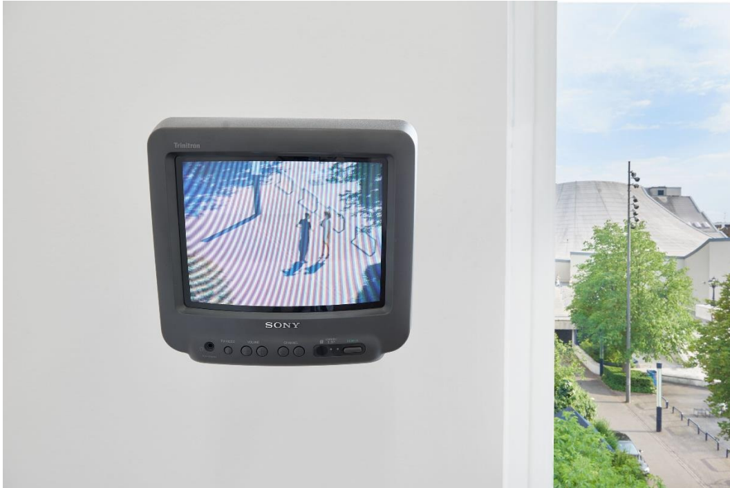
Yan Xing, Installationsansicht Dangerous Afternoon , Kunsthalle Basel, 2017.