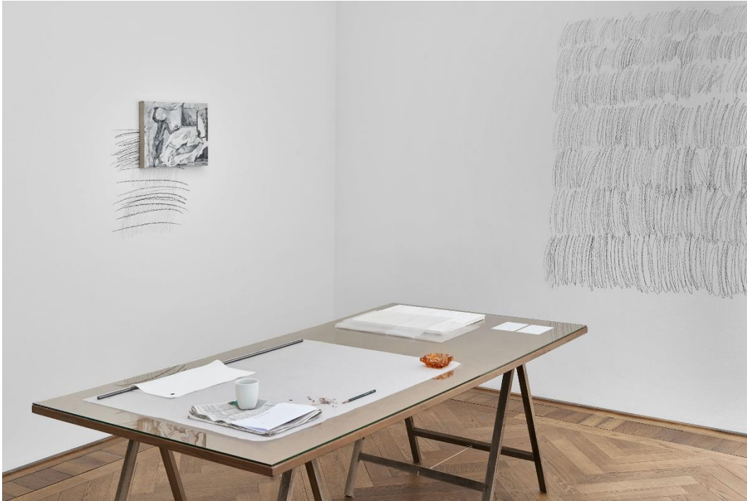
Yan Xing, Installationsansicht Dangerous Afternoon , Kunsthalle Basel, 2017.