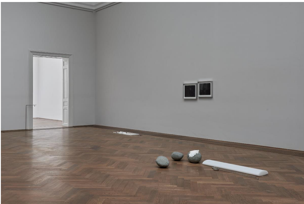
Yan Xing, Installationsansicht Dangerous Afternoon , Kunsthalle Basel, 2017.