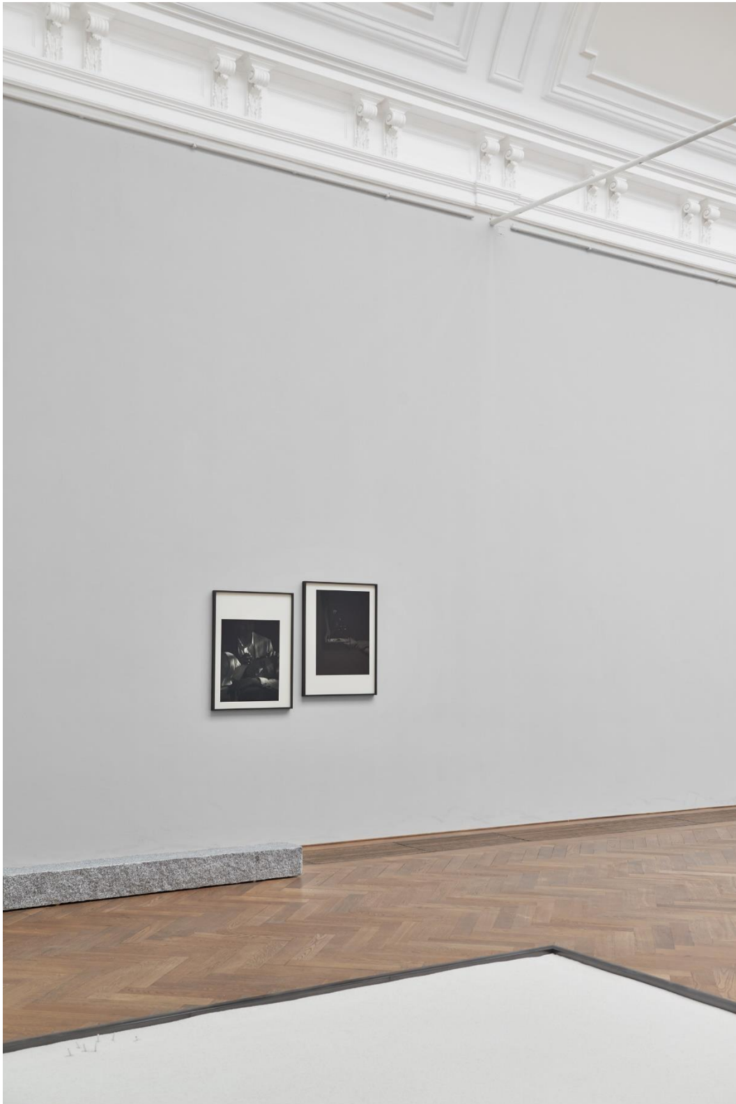
Yan Xing, Installationsansicht Dangerous Afternoon , Kunsthalle Basel, 2017.