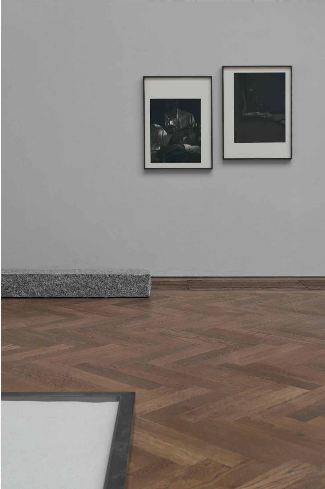
Yan Xing, Installationsansicht Dangerous Afternoon , Kunsthalle Basel, 2017.