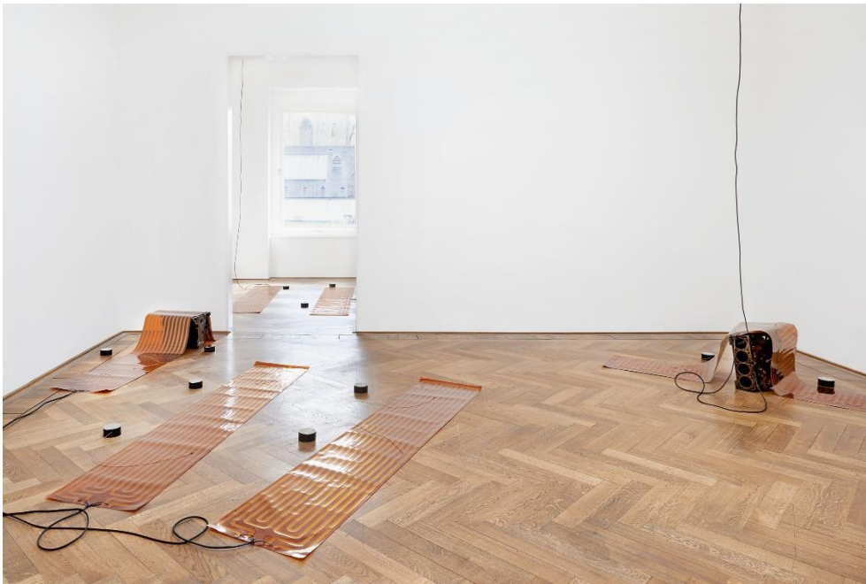
Sam Lewitt, Installationsansicht More Heat Than Light , Blick auf Weak Local Lineament (MHTL) , 2016, Kunsthalle Basel, 2016. Foto: Philipp Hänger / Sam Lewitt, Installation view More Heat Than Light , view on Weak Local Lineament (MHTL) , 2016, Kunsthalle Basel, 2016. Photo: Philipp Hänger