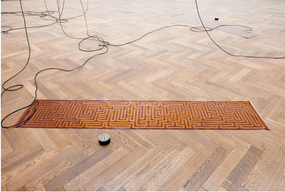
Sam Lewitt, Installationsansicht More Heat Than Light , Blick auf A Weak Local Lexicon (MHTL) , 2016, Kunsthalle Basel, 2016. / Sam Lewitt, Installation view More Heat Than Light , view on A Weak Local Lexicon (MHTL) , 2016, Kunsthalle Basel, 2016.