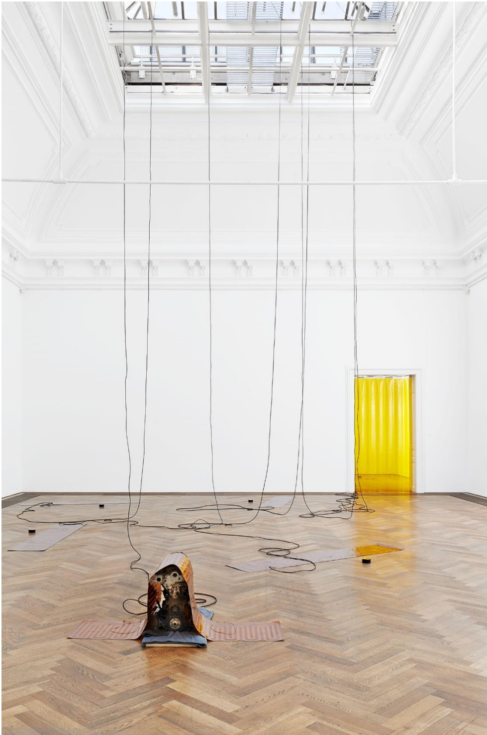
Sam Lewitt, Installationsansicht More Heat Than Light , Blick auf Weak Local Lineament (MHTL) , 2016, Kunsthalle Basel, 2016. Foto: Philipp Hänger / Sam Lewitt, Installation view More Heat Than Light , view on Weak Local Lineament (MHTL) , 2016, Kunsthalle Basel, 2016. Photo: Philipp Hänger

Alle Arbeiten, falls nicht anders angegeben: Courtesy Sam Lewitt und Galerie Buchholz, Berlin/Köln/New York / All works, unless otherwise noted: Courtesy Sam Lewitt and Galerie Buchholz, Berlin/Cologne/New York