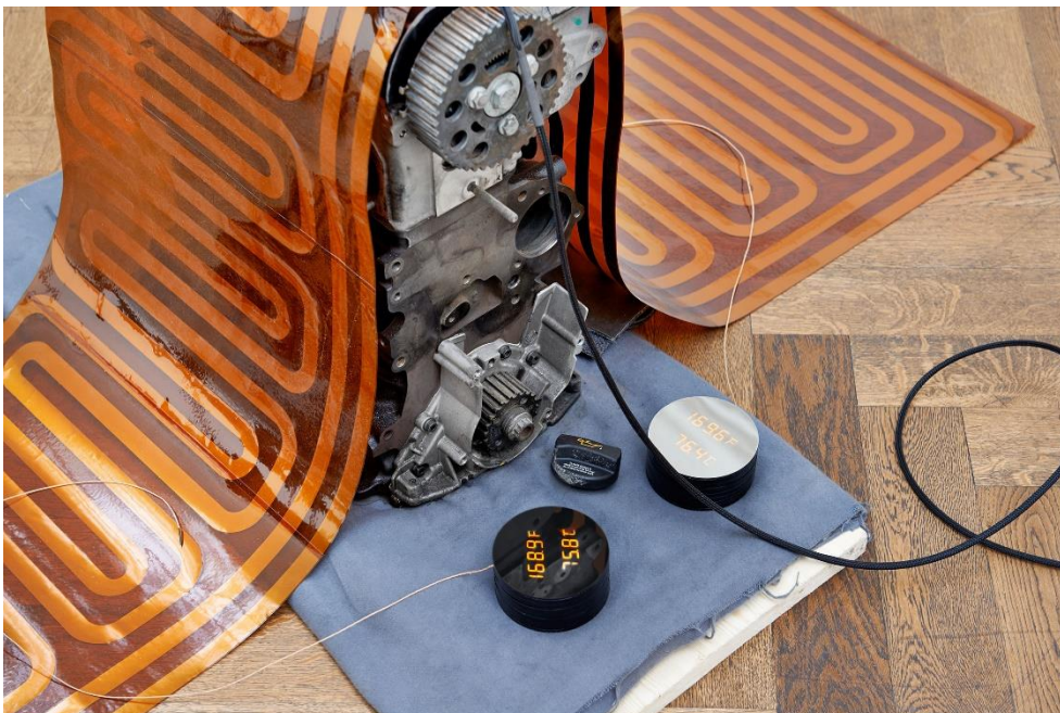
Sam Lewitt, Weak Local Lineament (MHTL) , 2016, detail, Kunsthalle Basel, 2016. Foto: Philipp Hänger / Sam Lewitt, Weak Local Lineament (MHTL) , 2016, detail, Kunsthalle Basel, 2016. Photo: Philipp Hänger