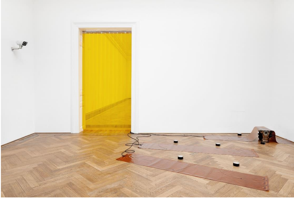
Sam Lewitt, Installationsansicht More Heat Than Light , Blick auf Weak Local Lineament (MHTL) , 2016, Kunsthalle Basel, 2016. Sam Lewitt, Installation view More Heat Than Light , view on Weak Local Lineament (MHTL) , 2016, Kunsthalle Basel, 2016.