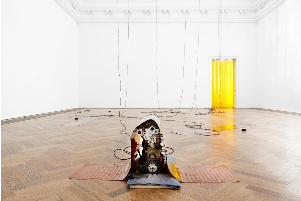
Sam Lewitt, Installationsansicht More Heat Than Light , Blick auf Weak Local Lineament (MHTL) , 2016, Kunsthalle Basel, 2016. Foto: Philipp Hänger / Sam Lewitt, Installation view More Heat Than Light , view on Weak Local Lineament (MHTL) , 2016, Kunsthalle Basel, 2016. Photo: Philipp Hänger