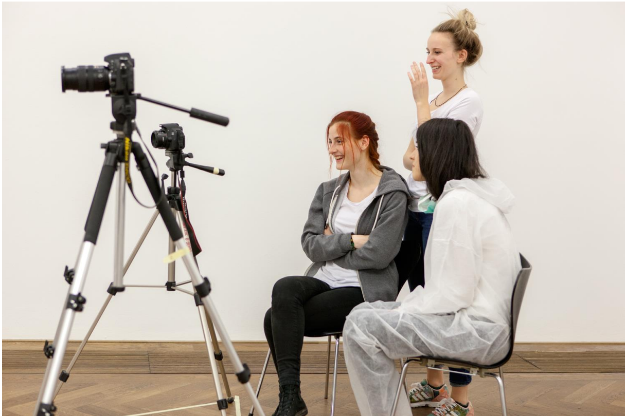
Kamera Lauft , ein Vermittlungsprojekt der Kunsthalle Basel, 2015.

Schülerinnen und Schüler des Vorkurses der Schule für Gestaltung Basel realisieren Kurzfilmportraits zu den Künstlerinnen und Künstler der Ausstellung Jungs, hier kommt der Masterplan .