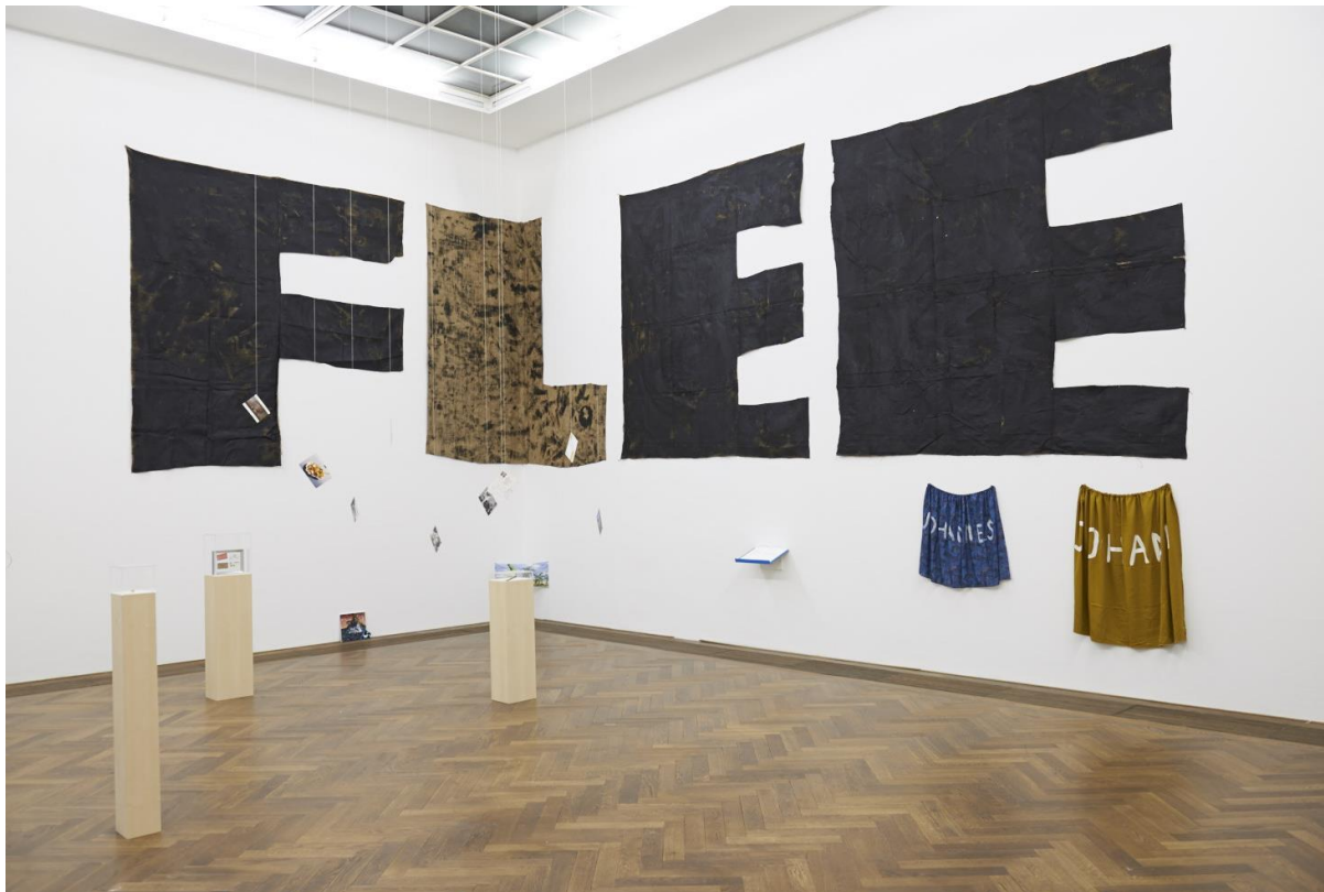
Free Willi, Installationsansicht, Ruf der Freiheit , 2015, Jungs, hier kommt der Masterplan , Kunsthalle Basel, 2015