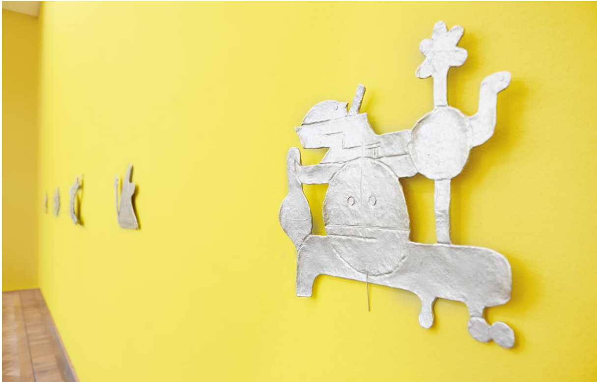
Rodrigo Hernández, Installationsansicht, The Diversity of Today , 2015, Jungs, hier kommt der Masterplan , Kunsthalle Basel, 2015.