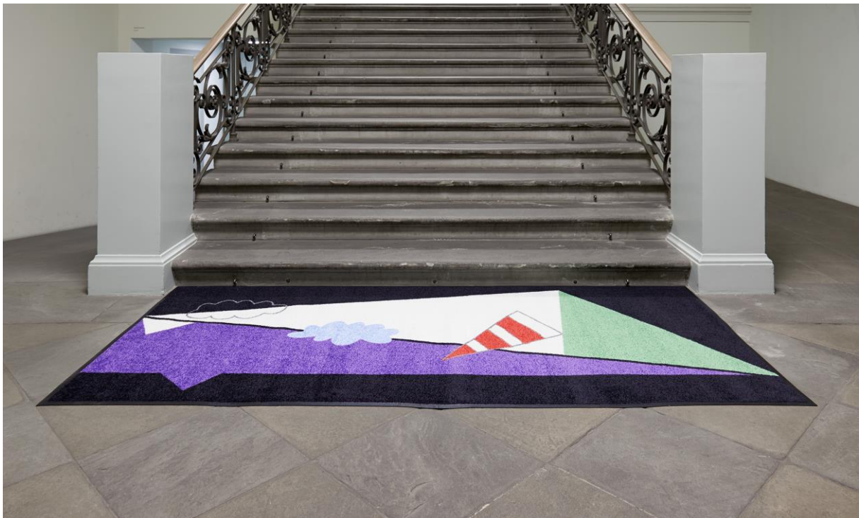
Kristina Buch, Installationsansicht, No longer grape , 2015, Jungs, hier kommt der Masterplan , Kunsthalle Basel, 2015