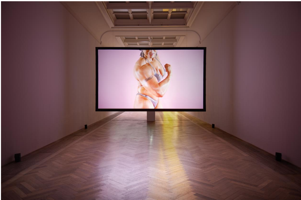
Lotte Meret Effinger, Installationsansicht, Supernature , 2014, Jungs, hier kommt der Masterplan , Kunsthalle Basel, 2015