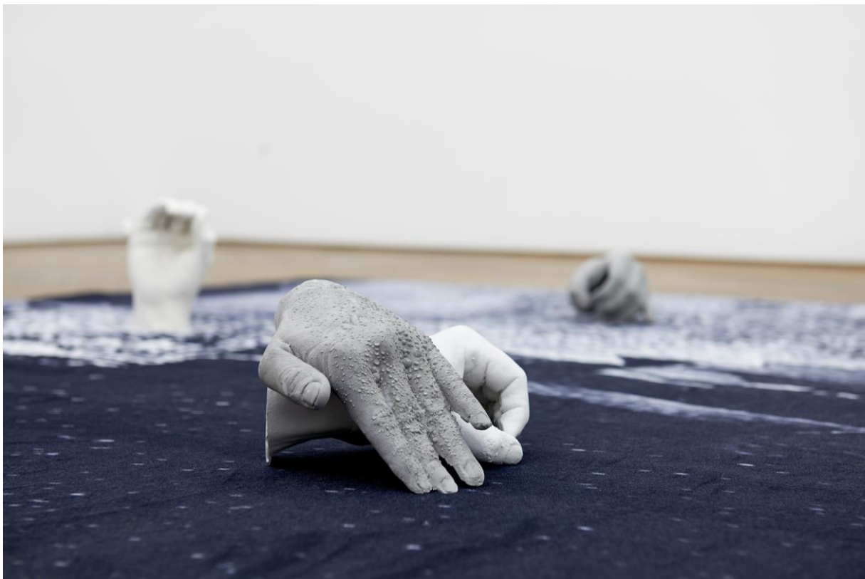
Sarah Bernauer, Installationsansicht, Milky Ways , 2014, Jungs, hier kommt der Masterplan , Kunsthalle Basel, 2015