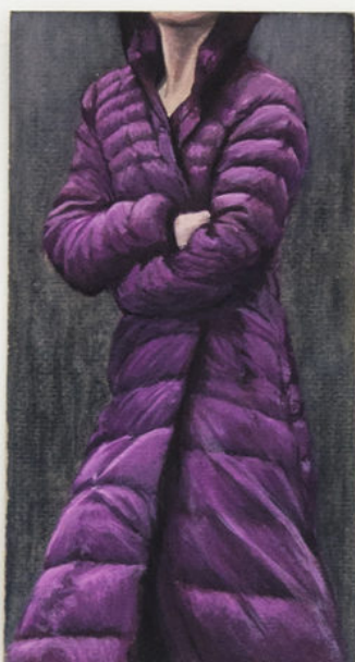
Louise Sartor Monochrome violet , 2017 Gouache on cardboard 18 × 9,5 cm