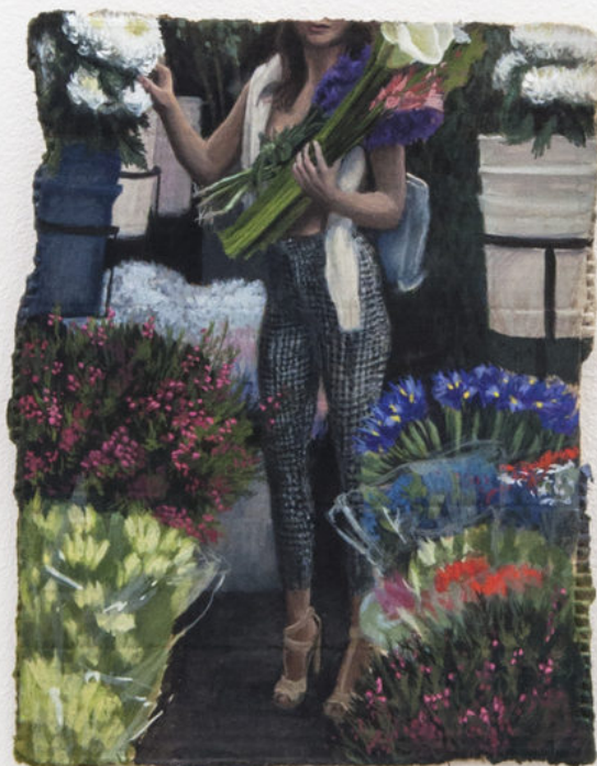
Louise Sartor Arums , 2017 Gouache on cardboard 21 × 14 cm