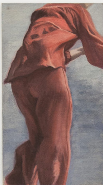
Louise Sartor Monochrome rouge , 2017 Gouache on cardboard 18 × 10 cm