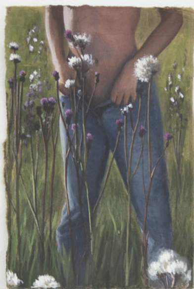
Louise Sartor Cirses , 2017 Gouache on cardboard 13,5 × 9 cm