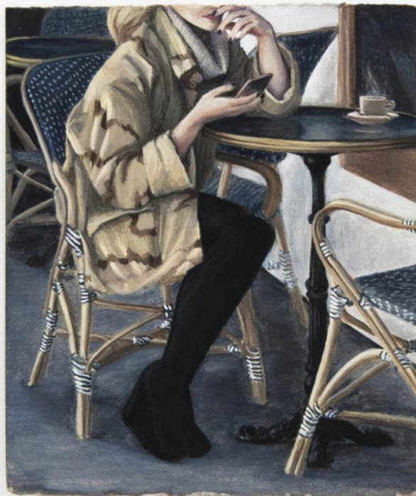
Louise Sartor Lu à 9:38, 2017 Gouache on cardboard 17,5 × 14,5 cm © Élise Fourché