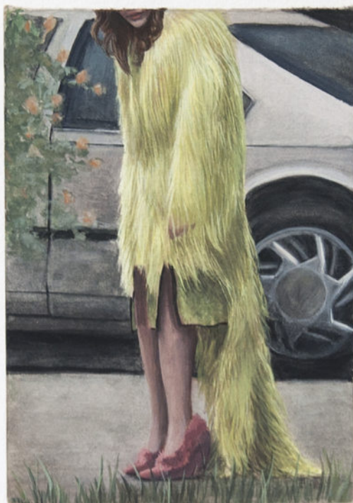
Louise Sartor Grinch , 2017 Gouache on cardboard 17,5 × 12 © Élise Fourché