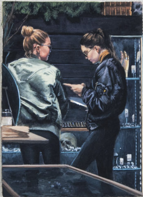
Louise Sartor Bombers , 2017 20 × 14,5 cm