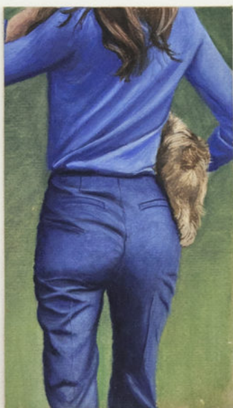
Louise Sartor Monochrome bleu , 2017 Gouache on cardboard 18 × 10 cm