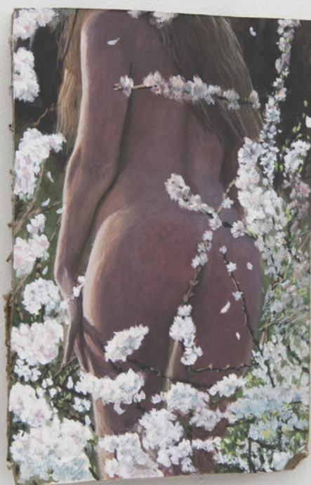
Louise Sartor Cerisiers , 2017 16,5 × 10,5 × 2 cm © Élise Fourché