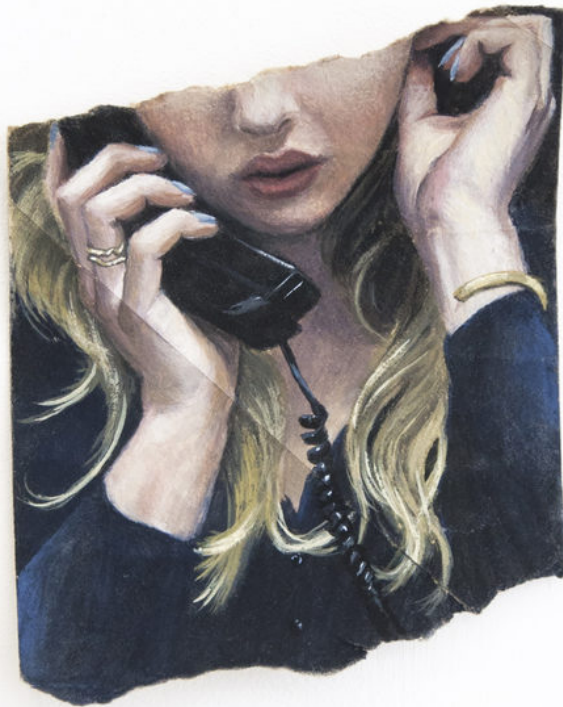
Louise Sartor Allo? , 2017 Gouache on toilet paper tube 13 × 10 cm