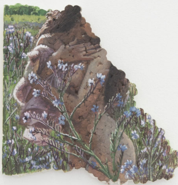
Louise Sartor Buglosse , 2017 Gouache on polystyrene 16,5 × 10,5 × 1 cm