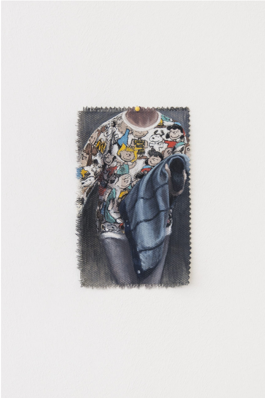
Louise Sartor Snoopy , 2017 Gouache on canvas 14,5 × 9 cm