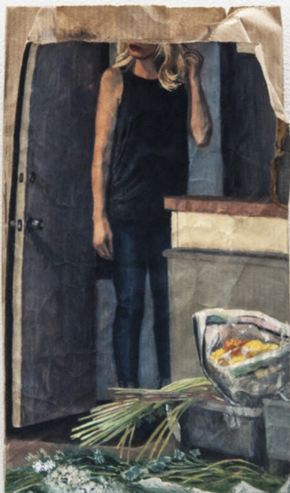
Louise Sartor Soucis , 2017 Gouache kraft envelope 24 × 16 cm