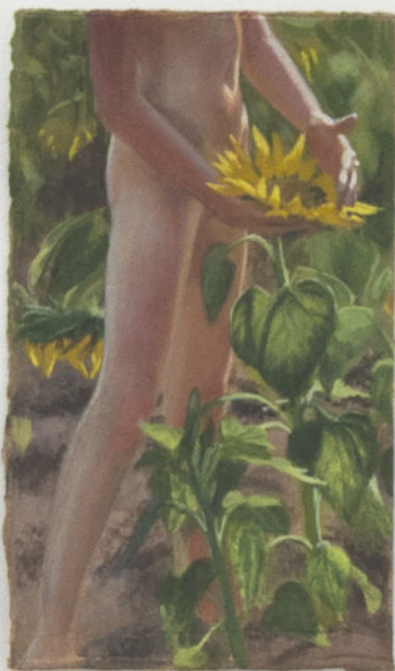
Louise Sartor Tournesols , 2017 Gouache on cardboard 13,5 × 8 cm © Élise Fourché