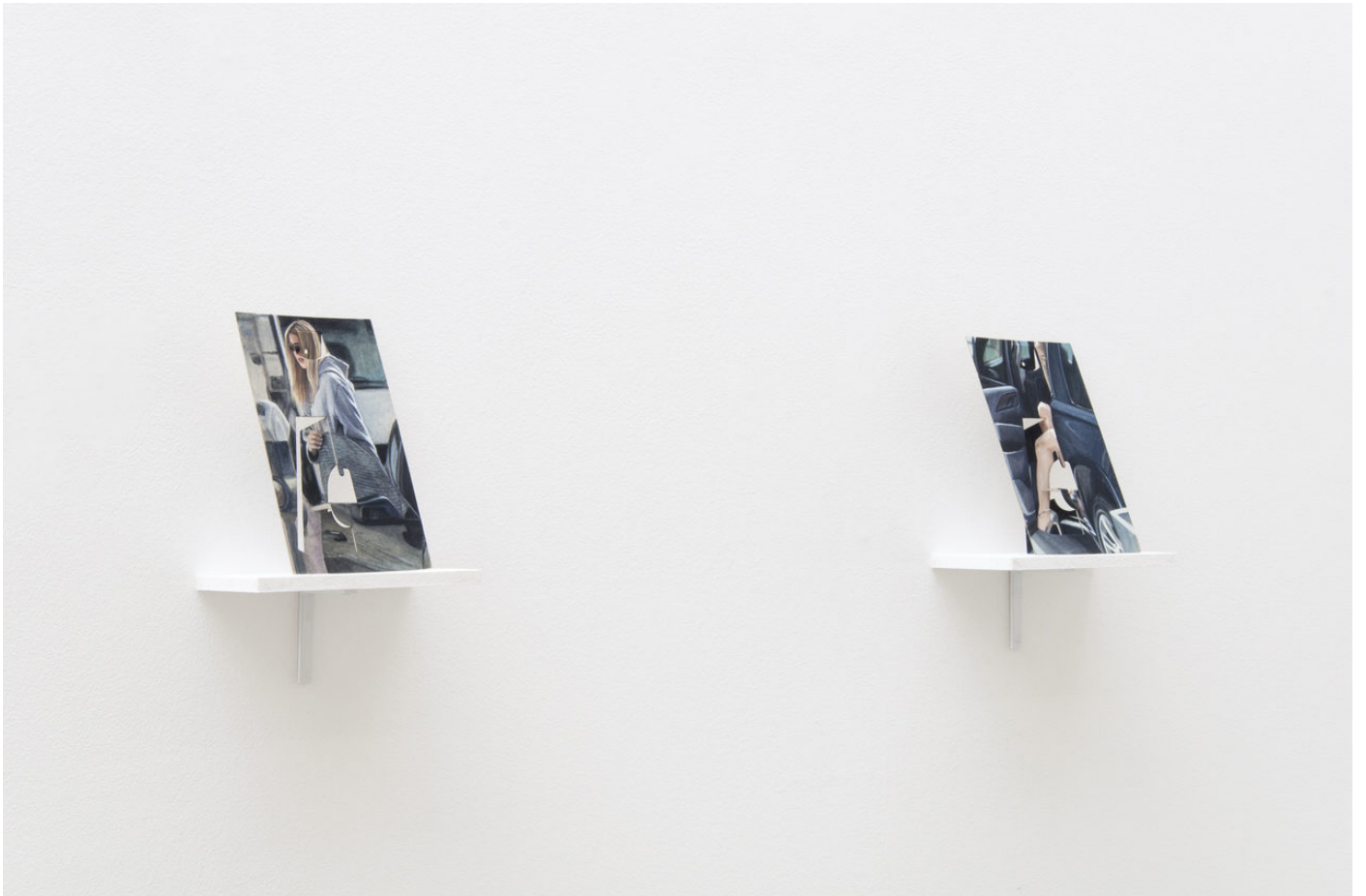
Louise Sartor Car to Bar , 2017 Gouache on cardboard frame background (diptych) 19,13,5 × 6 cm (each) © Élise Fourché