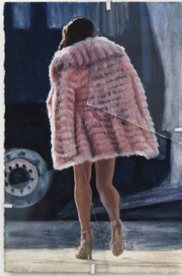
Louise Sartor Out and About in Belgrade , 2017 Gouache sur papier, glass 16,5 × 11 cm