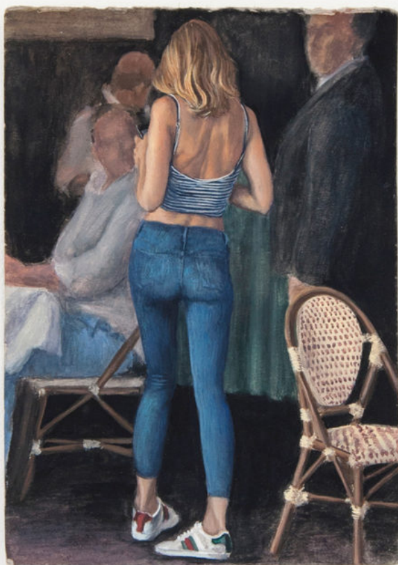
Louise Sartor Lu à 18:21 , 2017 Gouache on cardboard 21 × 15 cm © Élise Fourché