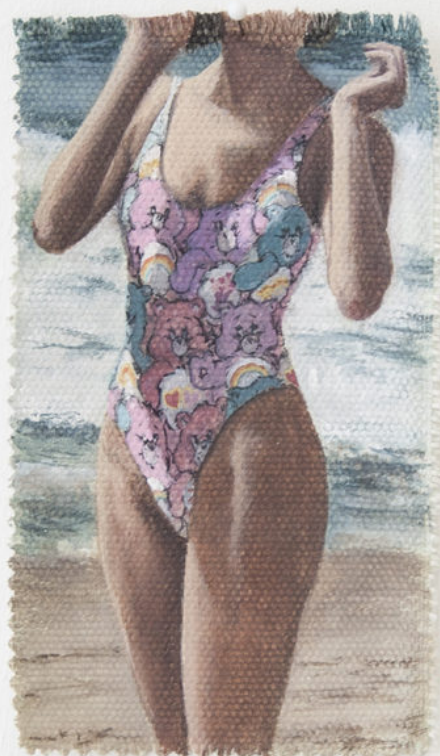
Louise Sartor Bisounours , 2017 Gouache on canvas 14,5 × 8,5 cm © Élise Fourché