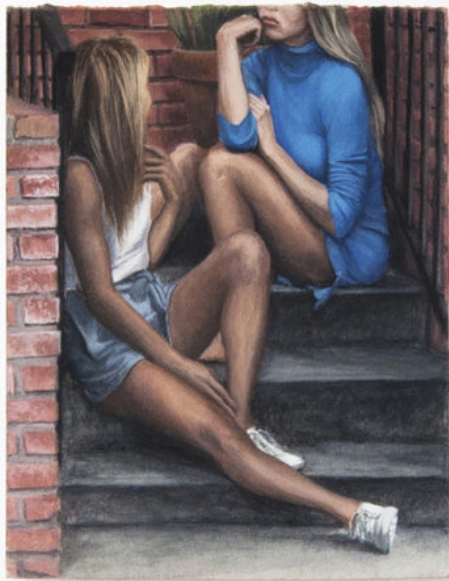
Louise Sartor BFFs , 2017 Gouache on cardboard 18 × 14 cm