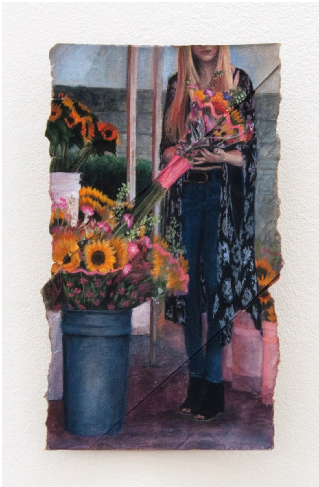
Louise Sartor Tournesols , 2017 Gouache on cardboard 22 × 13 cm