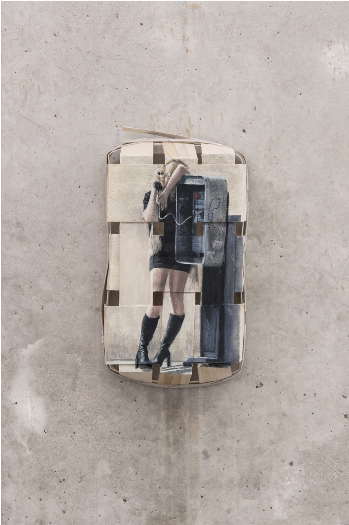
Louise Sartor Payphone , 2017 Gouache on wooden box 25 × 14 × 6 cm