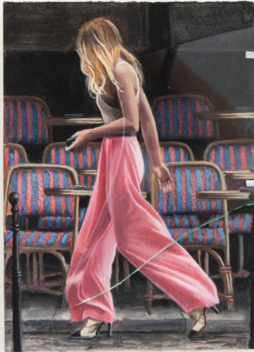
Louise Sartor Out & About in Saint Germain , 2017 Gouache on paper, glass 16 × 12 cm