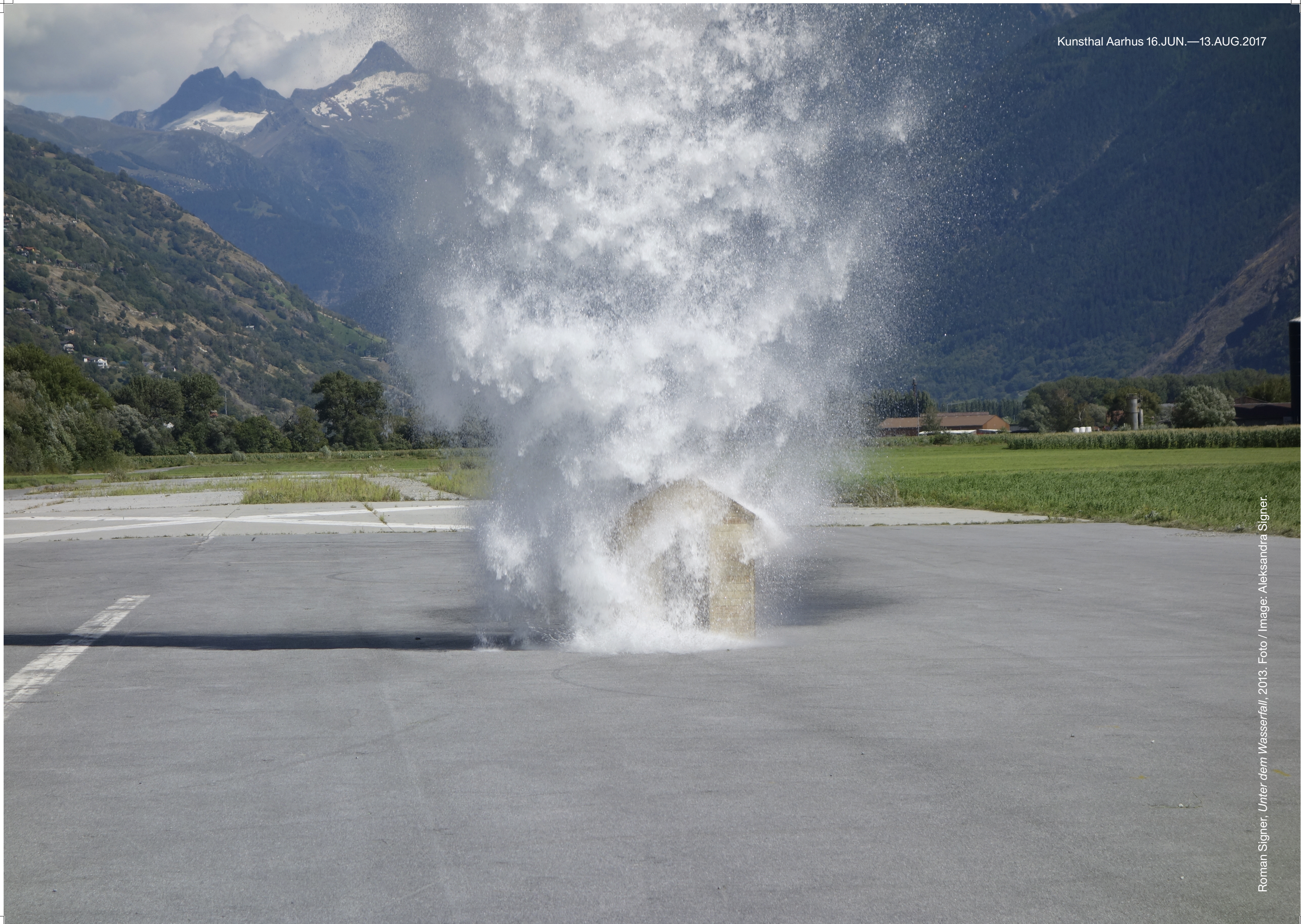
Roman Signer, Unter dem Wasserfall , 2013.