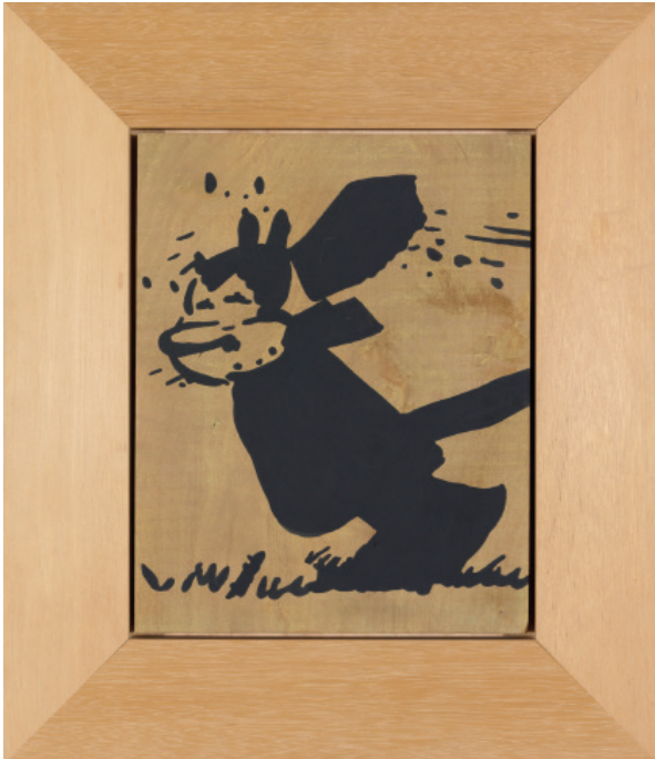
Sherrie Levine, Untitled (Krazy Kat : 5) , 1988 Caséine sur bois (merisier) 47 x 40 cm Collection MAMCO, don de la Fondation MAMCO