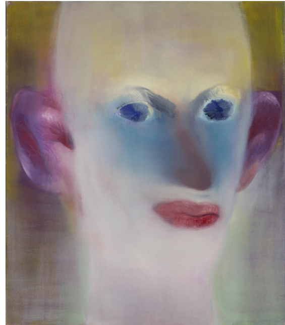
Miriam Cahn, Sans titre (13 + 14 + 18.07.2003) , 2003 Huile sur toile 105 x 90 cm Collection MAMCO, œuvre acquise grâce à Blondeau et Cie