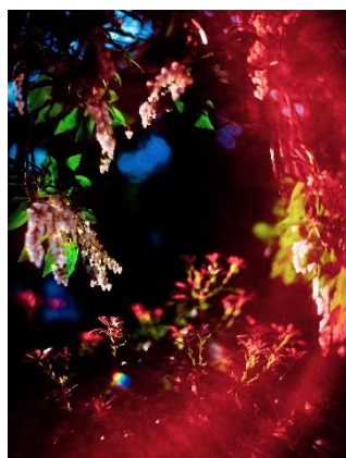
Yosuke Takeda “071949” , 2019