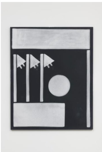
“Violets II”, 2018