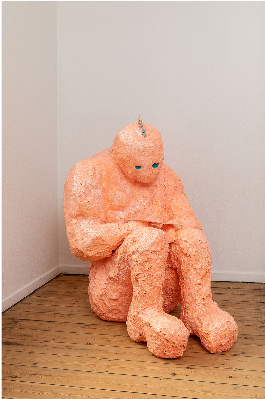
Melchior de Tinguy, Buddy is sad? , 2020, mixed media, 127 x 115 x 80 cm.