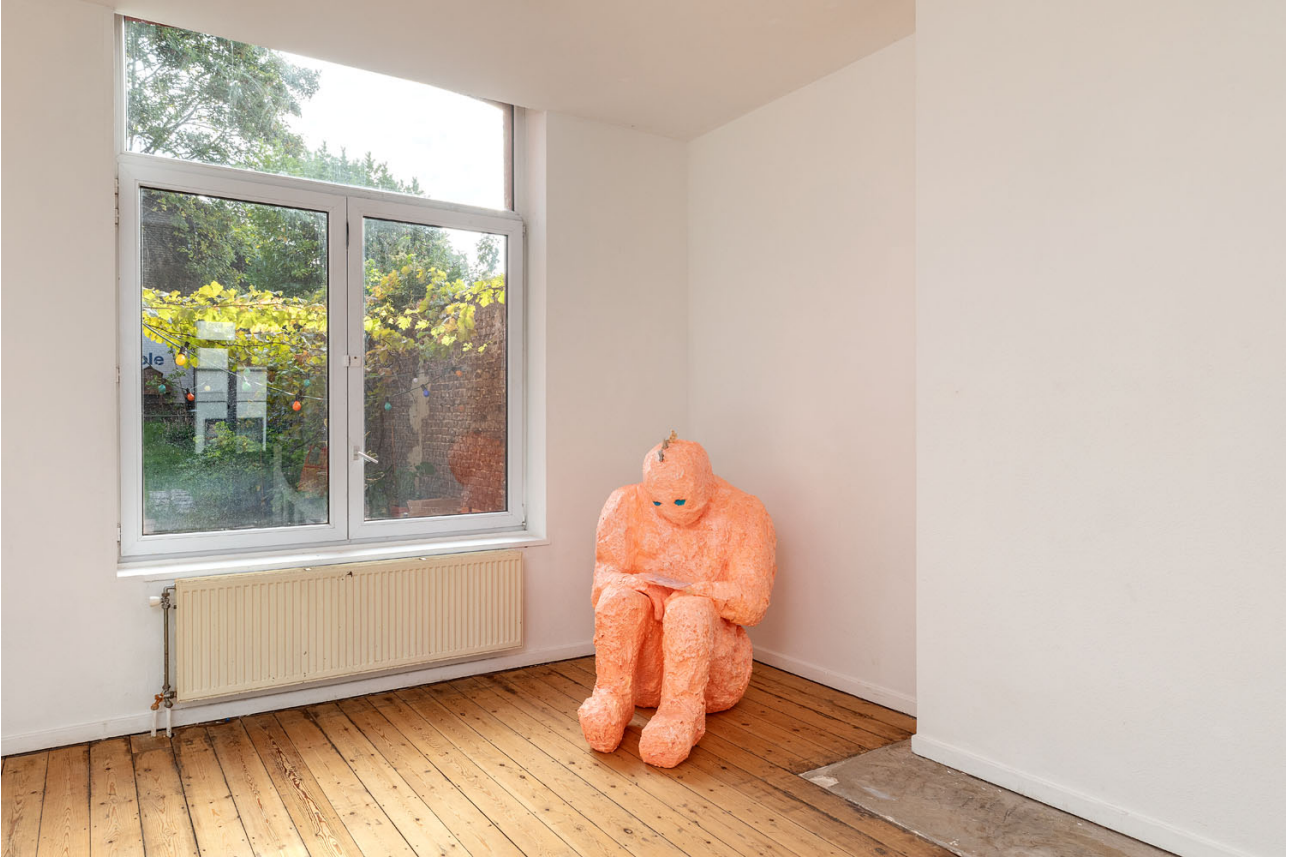
Melchior de Tinguy, Inside Out , exhibition view, Island 2020.