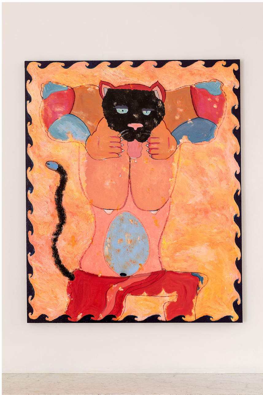
Melchior de Tinguy, "Dancing with the wind" Hommage à Karl Wirsum , 2020, acrylic paint on wood panels, 110 x 90 cm.