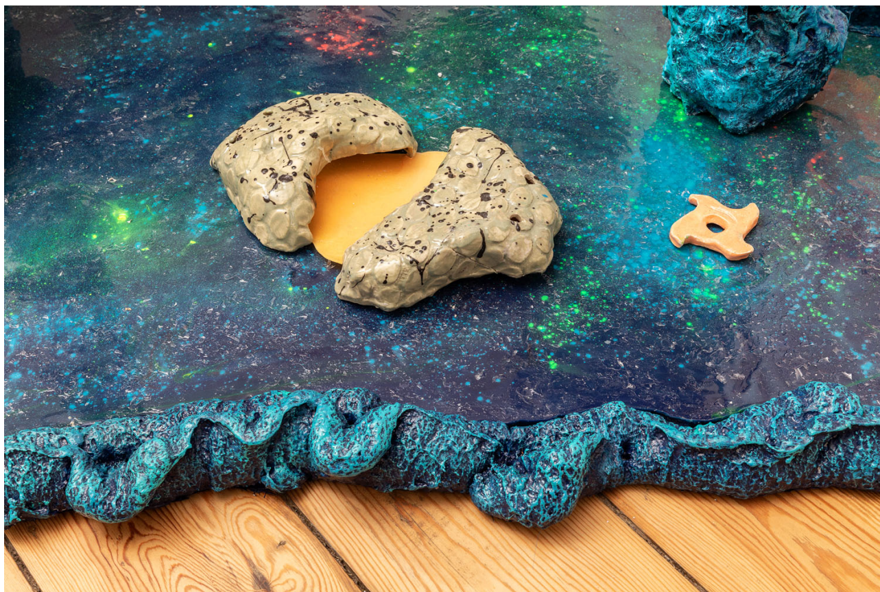
detail, Melchior de Tinguy, Bonne nuit les petits , 2020, mixed media, 166 x 156 x 140 cm.