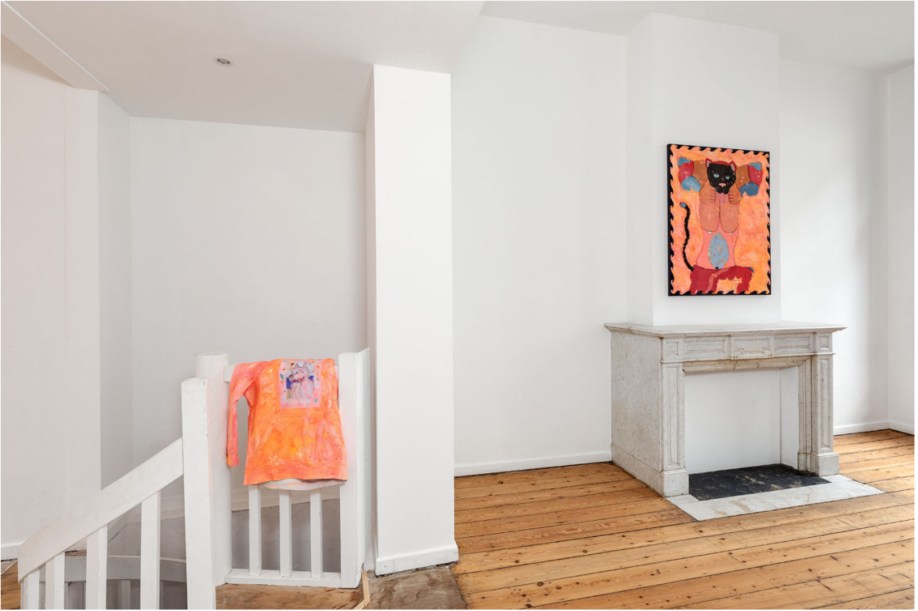
Melchior de Tinguy, Inside Out , exhibition view, Island 2020.