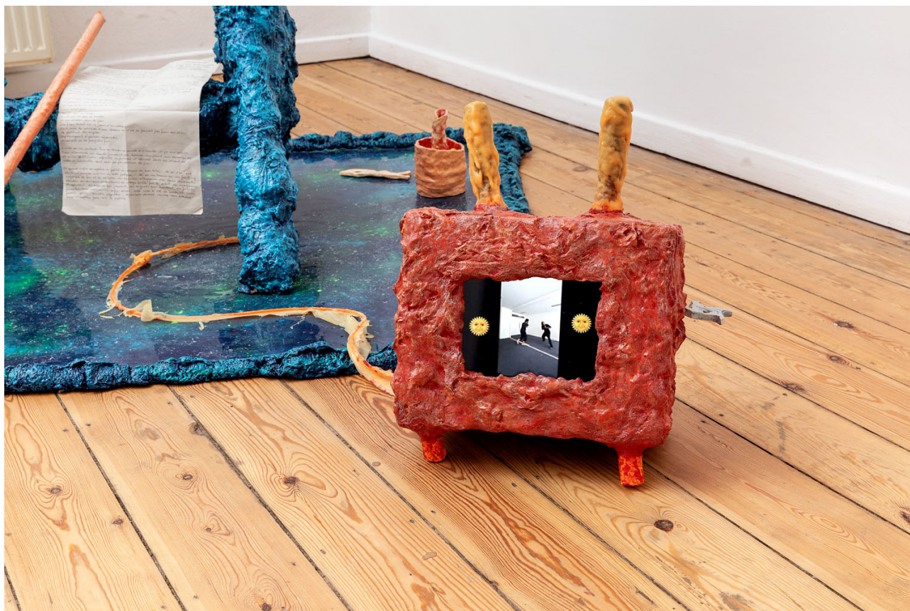
Melchior de Tinguy, Le Funambule , 2020, mixed media, 43 x 32 x 18 cm.