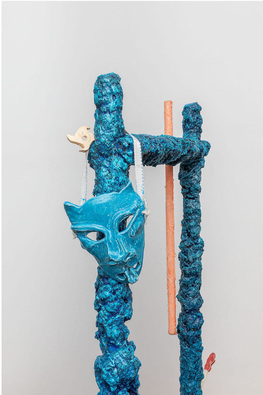
detail, Melchior de Tinguy, Bonne nuit les petits , 2020, mixed media, 166 x 156 x 140 cm.