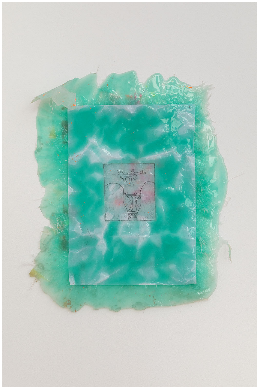
Melchior de Tinguy, Just one left , 2020, mixed media, 39 x 30,5 cm.