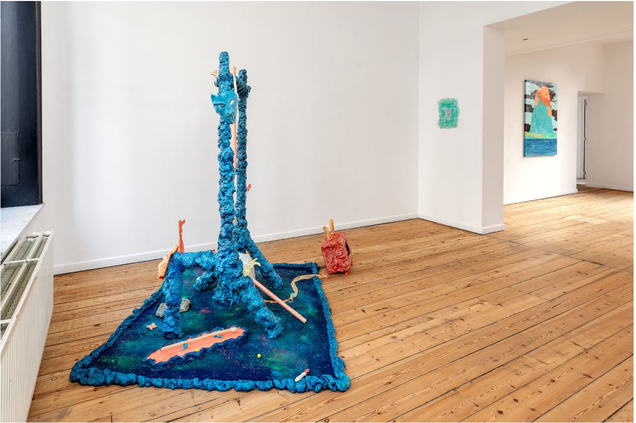
Melchior de Tinguy, Inside Out , exhibition view, Island 2020.