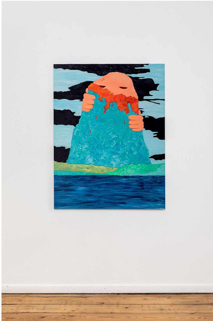
Melchior de Tinguy, Dînette d'Onigrini , 2020, acrylic paint on wood panels, 130 x 90 cm.