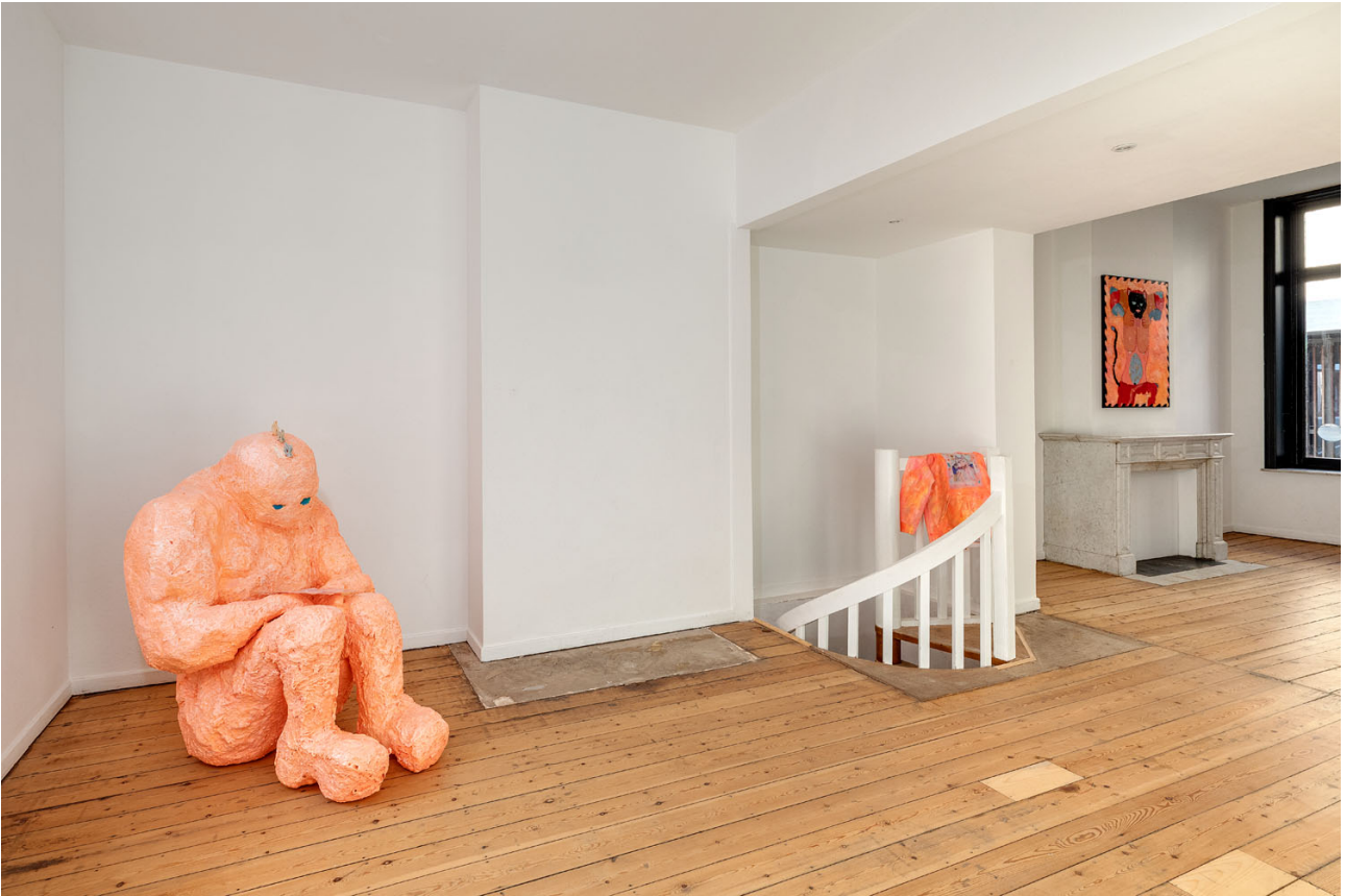
Melchior de Tinguy, Inside Out , exhibition view, Island 2020.