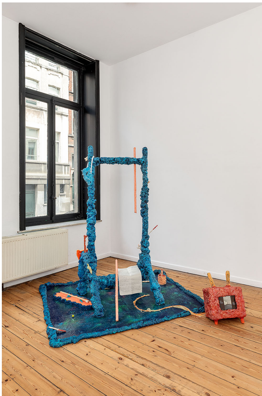
Melchior de Tinguy, Bonne nuit les petits , 2020, mixed media, 166 x 156 x 140 cm.