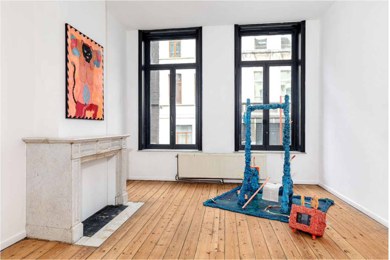
Melchior de Tinguy, Inside Out , exhibition view, Island 2020.