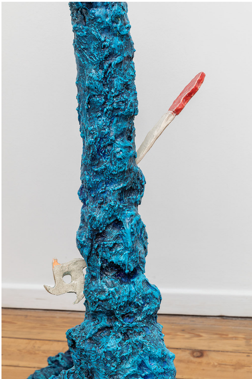
detail, Melchior de Tinguy, Bonne nuit les petits , 2020, mixed media, 166 x 156 x 140 cm.