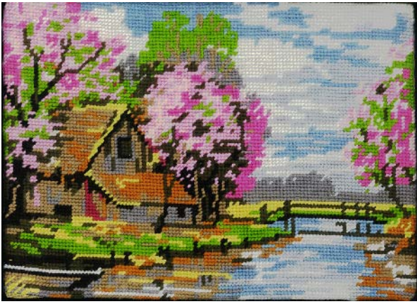
Jef Geys Canvas Painting (Spring), 1985 Canevas à l'aiguille sur plaque d'Isorel unique