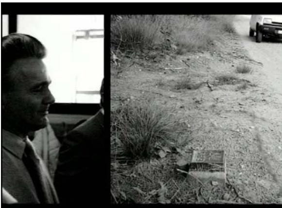
Jef Geys Day and Night and Day..., 2002