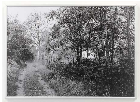
Jef Geys Chalet, 1977-2015 photographie noir et blanc (photographie1977, tirage 2015), cadre 31 x 43,3 cm 2/3 + 2 ap