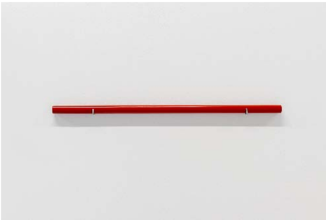
Jef Geys Stabas, 1966 bois peint 57,8 x 2 cm de diamètre unique