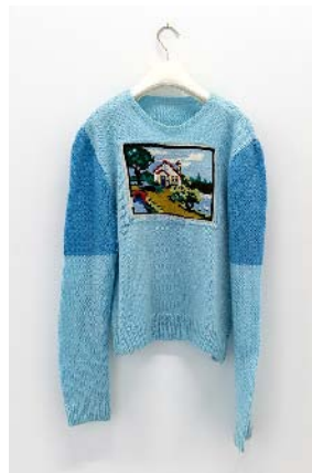
Jef Geys Landscape Sweater, 1967 pull avec canevas à l'aiguille unique