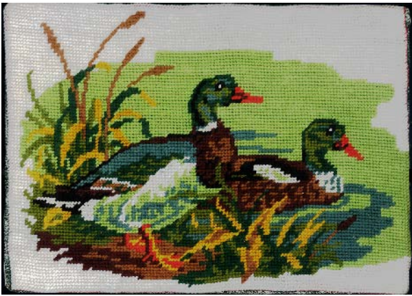
Jef Geys Canvas Painting (Ducks), 1985 Canevas à l'aiguille sur plaque d'Isorel unique