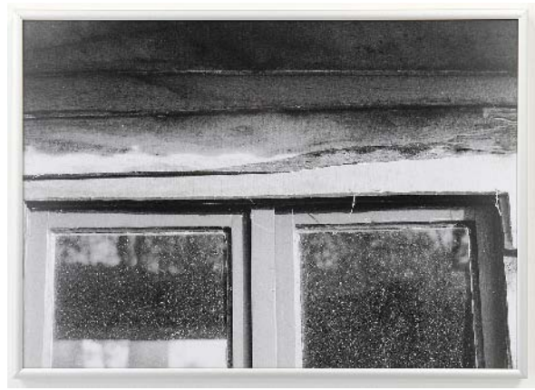
Jef Geys Chalet, 1977-2015 photographie noir et blanc (photographie1977, tirage 2015), cadre 31 x 43,3 cm 2/3 + 2 ap