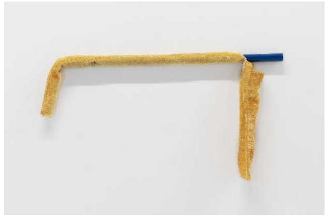
Jef Geys Stabas, 1966 plastique et tissu 57,8 x 2 cm de diamètre; 60 x 3 cm unique