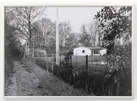
Jef Geys Chalet, 1977-2015 photographie noir et blanc (photographie1977, tirage 2015), cadre 31 x 43,3 cm 2/3 + 2 ap