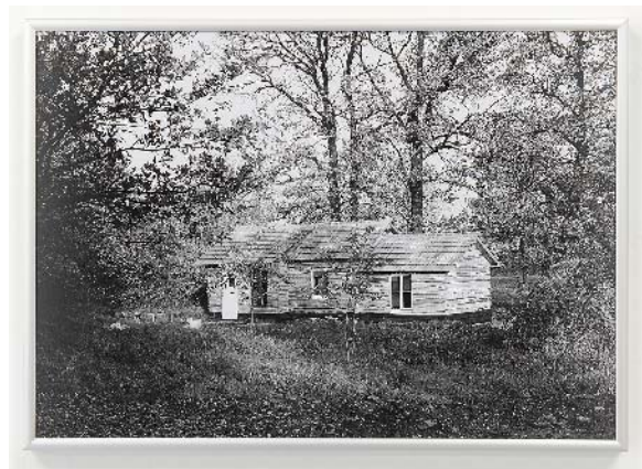
Jef Geys Chalet, 1977-2015 photographie noir et blanc (photographie 1977, tirage 2015), cadre 31 x 43,3 cm 2/3 + 2 ap