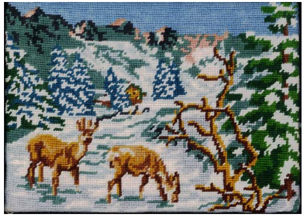
Jef Geys Canvas Painting (Deers), 1985 Canevas à l'aiguille sur plaque d'Isorel unique