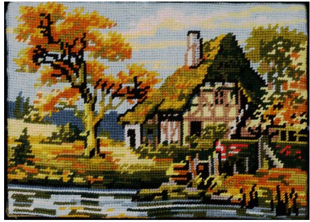
Jef Geys Canvas Painting (Fall), 1985 Canevas à l'aiguille sur plaque d'Isorel unique