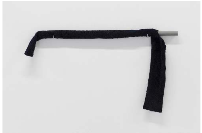
Jef Geys Stabas, 1966 bois peint et tissu 57,8 x 2 cm de diamètre; 60 x 3 cm unique