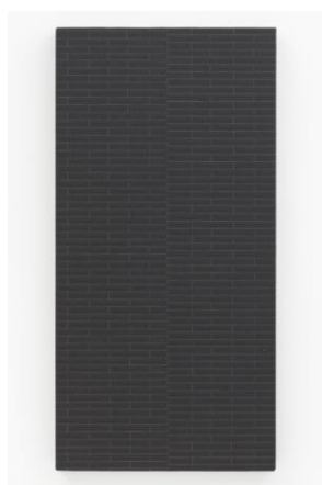
“Untitled”, 2017 Acrylic on canvas 49.4 x 24.5 x 2.6 cm © Maria Taniguchi