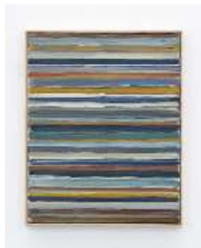
Masaaki Yamada "Work C. 0", 1960 Oil on canvas 10 25/32 x 8 25/32 inches (27.4 x 22.3 cm) © Estate of Yamada Masaaki