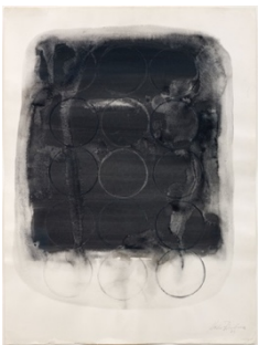
Hideko Fukushima "Untitled", 1963 Ink on paper 76 x 56 cm