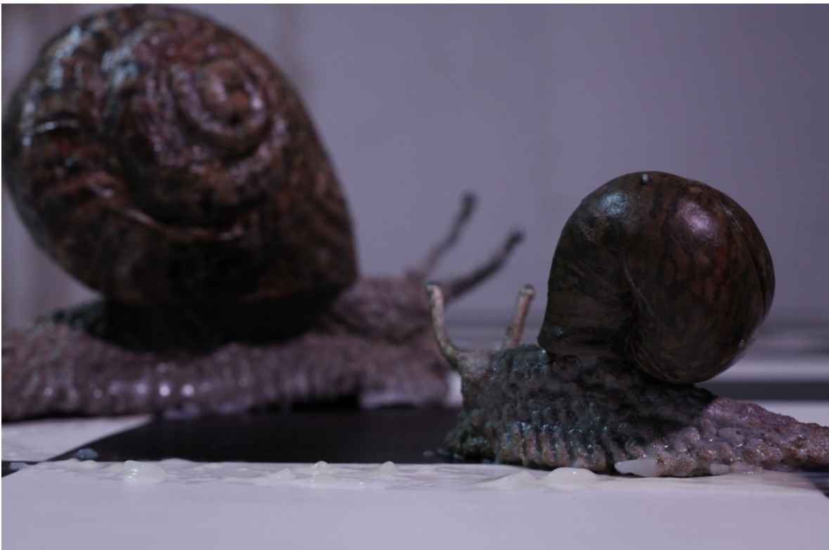
Stuart Middleton, keep going, 2018. Stop-Motion-Animation mit Ton, 6:24 Min.