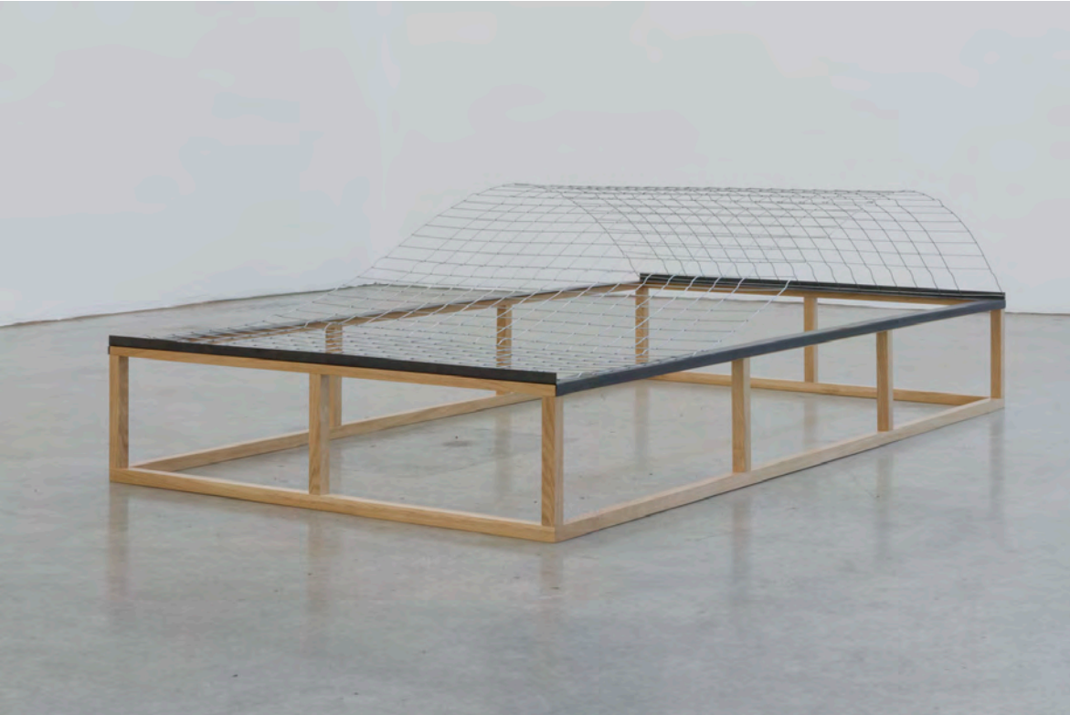
Valentin Ruhry, Welle, 2012