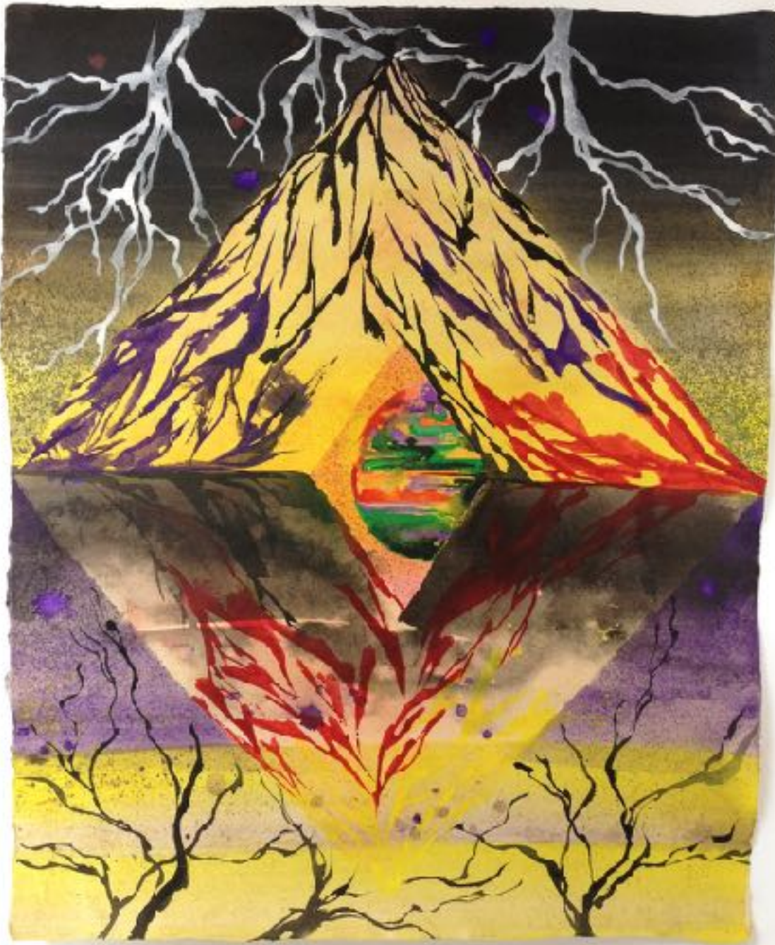
Alexandre Joly Sacred Peanuts Island Mischtechnik