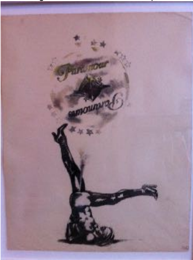
Pearl C Hsiung Untitled 09 , 2012, Tinte auf Papier, 39 x 48 cm