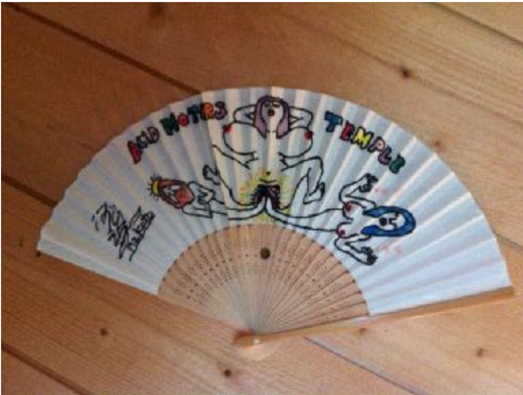
Sofie Shubert Toy boy , 2011 Farbstift auf Papier