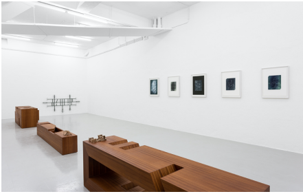
Rita Sobral Campos, O Trágico Destino Vertical , 2020. Vista da exposição Kunsthalle Lissabon, Lisboa.