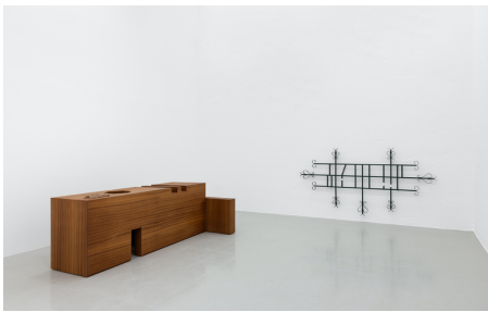
Rita Sobral Campos, O Trágico Destino Vertical , 2020. Vista da exposição com Bruno , 2020; Techno Medieval , 2020. Kunsthalle Lissabon, Lisboa.