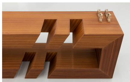
Rita Sobral Campos, O Trágico Destino Vertical , 2020. Thomasina , 2020 (pormenor). Escultura em contraplacado de mogno, com acabamento a óleo de tung, fabricada por Atelier São Vicente; Impressão 3D em aço, fabricada por Shapeways, 68 x 200 x 45 cm. Cortesia da artista. Kunsthalle Lissabon, Lisboa. Foto: Bruno Lopes.