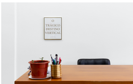
Rita Sobral Campos, O Trágico Destino Vertical , 2020. Offset sobre papel Conqueror Vergé 220gr, impresso por Gráfica de Sapadores, 40 x 30 cm. Cortesia da artista. Kunsthalle Lissabon, Lisboa. Foto: Bruno Lopes.