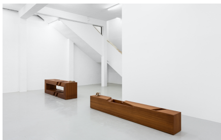
Rita Sobral Campos, O Trágico Destino Vertical , 2020. Vista da exposição com Thomasina , 2020; Zelda , 2020. Cortesia da artista. Kunsthalle Lissabon, Lisboa. Foto: Bruno Lopes.