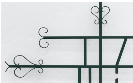
Rita Sobral Campos, O Trágico Destino Vertical , 2020. Techno Medieval , 2020 (pormenor). Escultura em ferro pintado a esmalte, fabricada por Pedro Canoilas, 100 x 200 x 6 cm. Cortesia da artista. Kunsthalle Lissabon, Lisboa. Foto: Bruno Lopes.