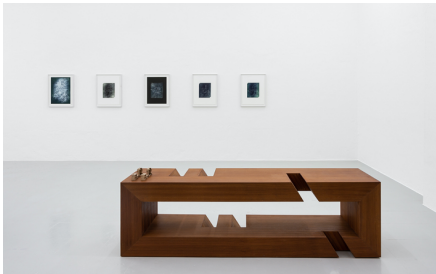
Rita Sobral Campos, O Trágico Destino Vertical , 2020. Vista da exposição Kunsthalle Lissabon, Lisboa.