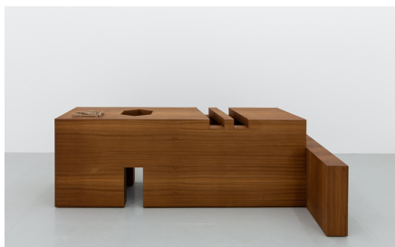
Rita Sobral Campos, O Trágico Destino Vertical , 2020. Bruno , 2020. Escultura em contraplacado de mogno, com acabamento a óleo de tung, fabricada por Atelier São Vicente; Impressão 3D em aço, fabricada por Shapeways, 72 x 200 x 50 cm. Cortesia da artista. Kunsthalle Lissabon, Lisboa. Foto: Bruno Lopes.