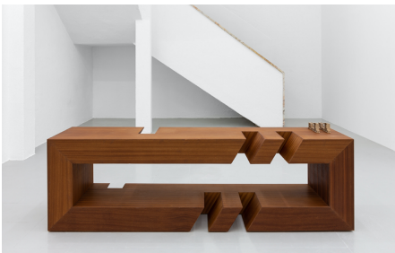
Rita Sobral Campos, O Trágico Destino Vertical , 2020. Thomasina , 2020. Escultura em contraplacado de mogno, com acabamento a óleo de tung, fabricada por Atelier São Vicente; Impressão 3D em aço, fabricada por Shapeways, 68 x 200 x 45 cm. Cortesia da artista. Kunsthalle Lissabon, Lisboa. Foto: Bruno Lopes.