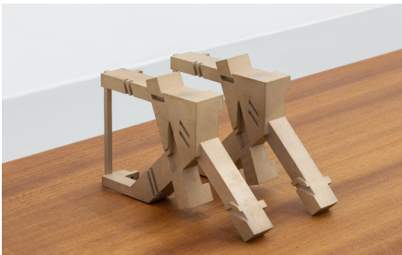
Rita Sobral Campos, O Trágico Destino Vertical , 2020. Zelda , 2020 (detail). Escultura em contraplacado de mogno, com acabamento a óleo de tung, fabricada por Atelier São Vicente; Impressão 3D em aço, fabricada por Shapeways, 42 x 250 x 30 cm. Cortesia da artista. Kunsthalle Lissabon, Lisboa. Foto: Bruno Lopes.