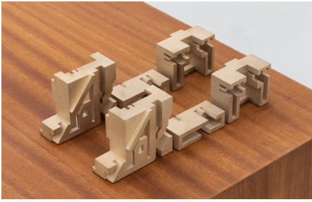
Rita Sobral Campos, O Trágico Destino Vertical , 2020. Thomasina , 2020 (detail). Escultura em contraplacado de mogno, com acabamento a óleo de tung, fabricada por Atelier São Vicente; Impressão 3D em aço, fabricada por Shapeways, 68 x 200 x 45 cm. Cortesia da artista. Kunsthalle Lissabon, Lisboa. Foto: Bruno Lopes.