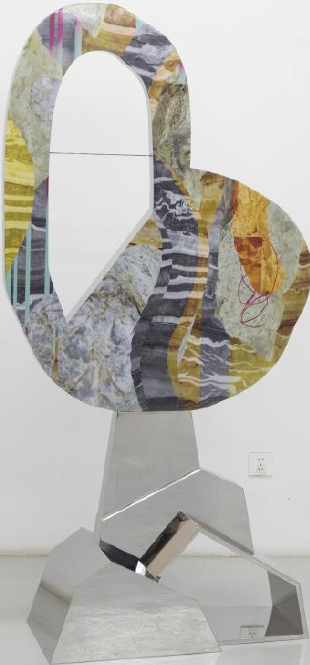
Mare O No. 6, 2017-2018 188 x 95 x 36 cm 不锈钢上丝网印 Stainless steel, Screenprint