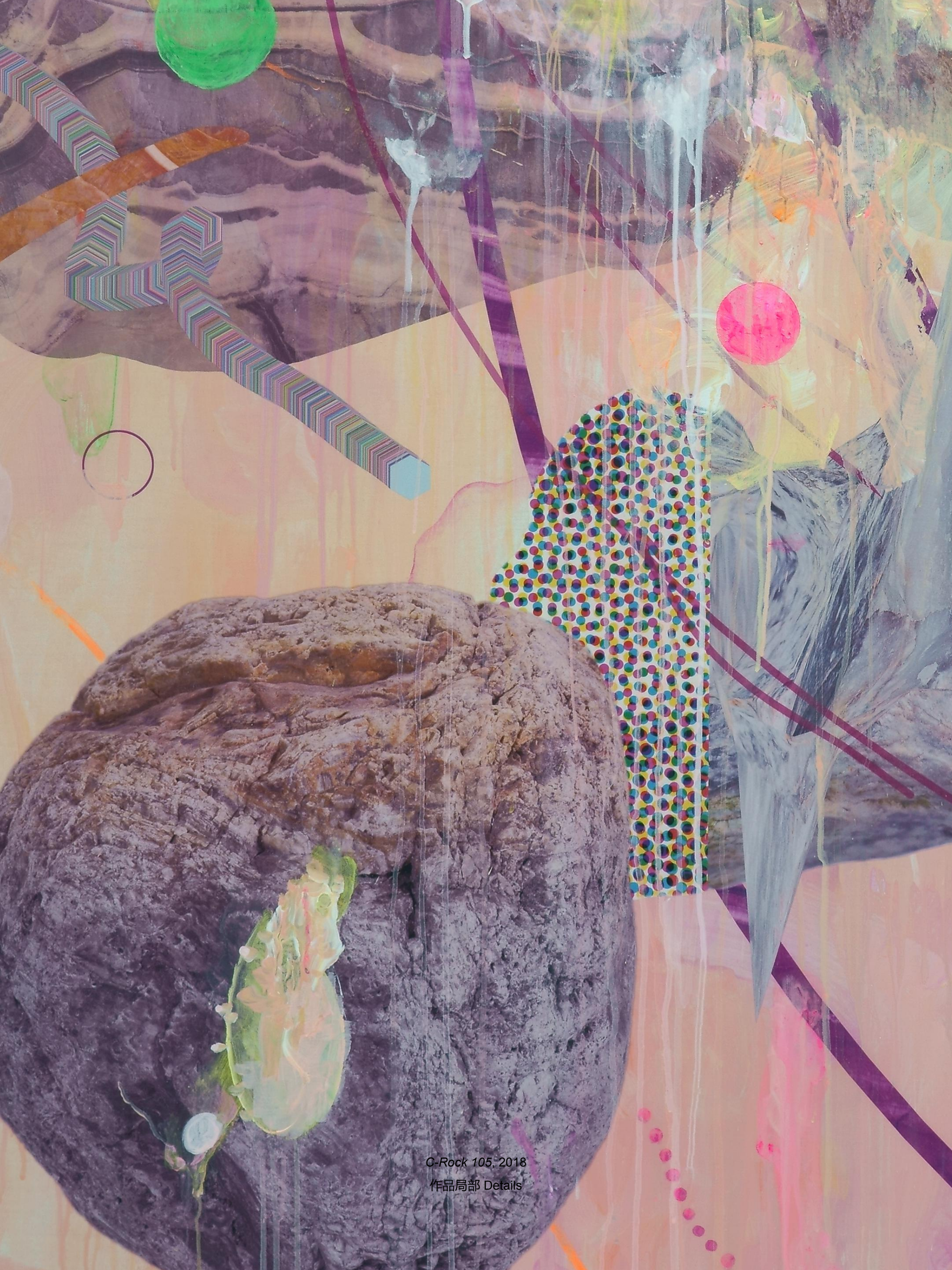
G-Rock 105, 2018 作品局部 Details