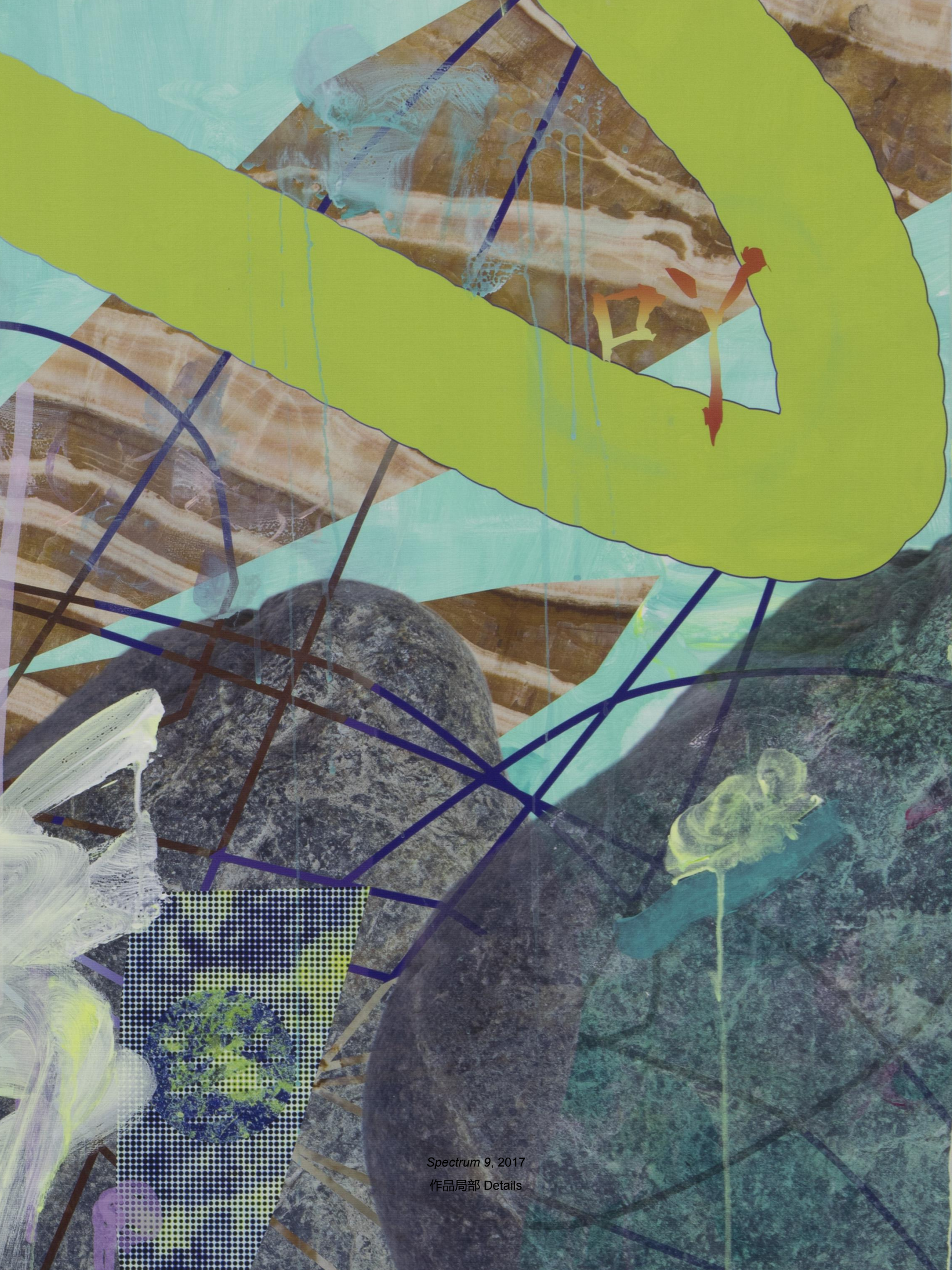
Spectrum 9, 2017 作品局部 Details