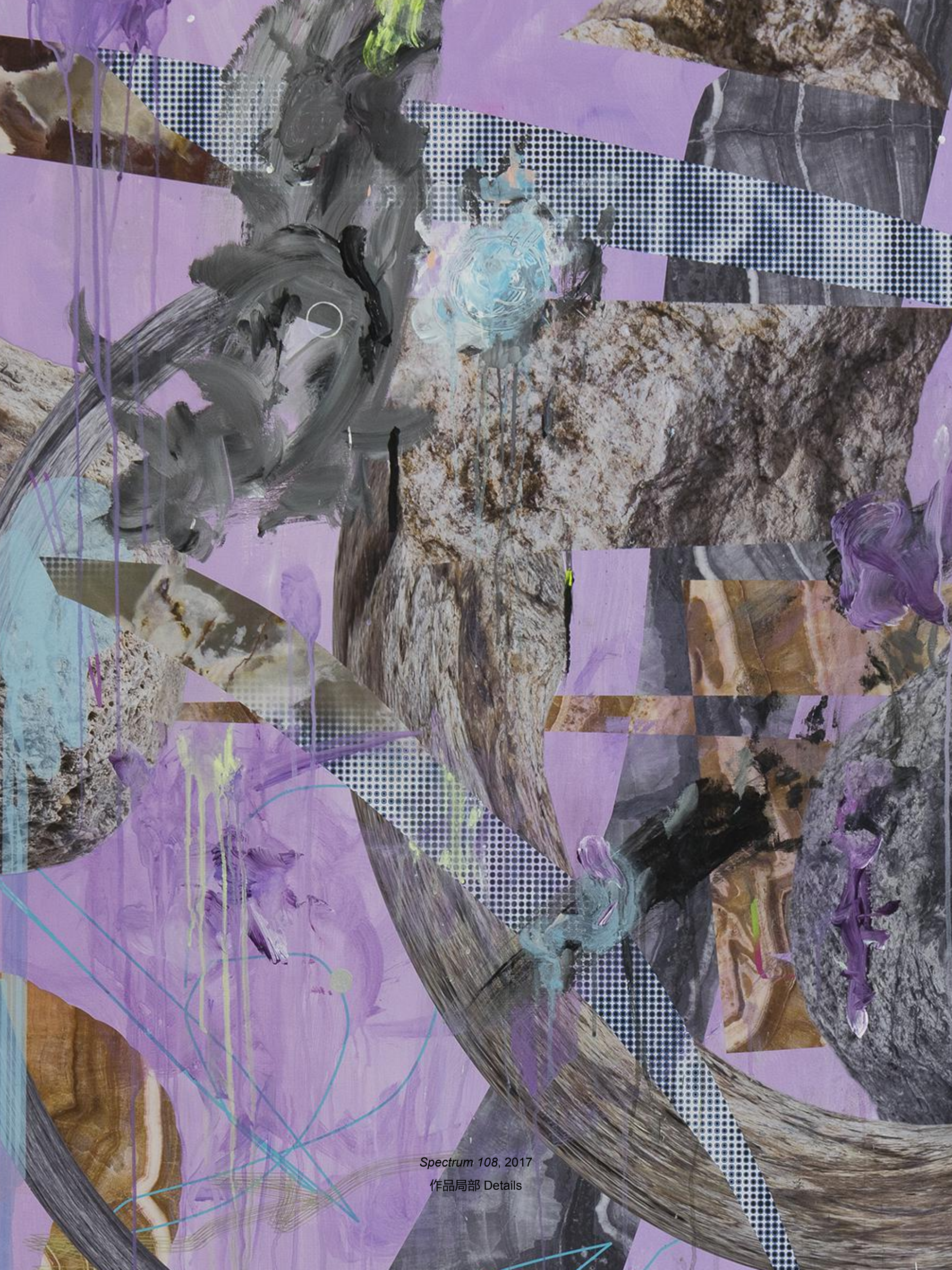
Spectrum 108, 2017