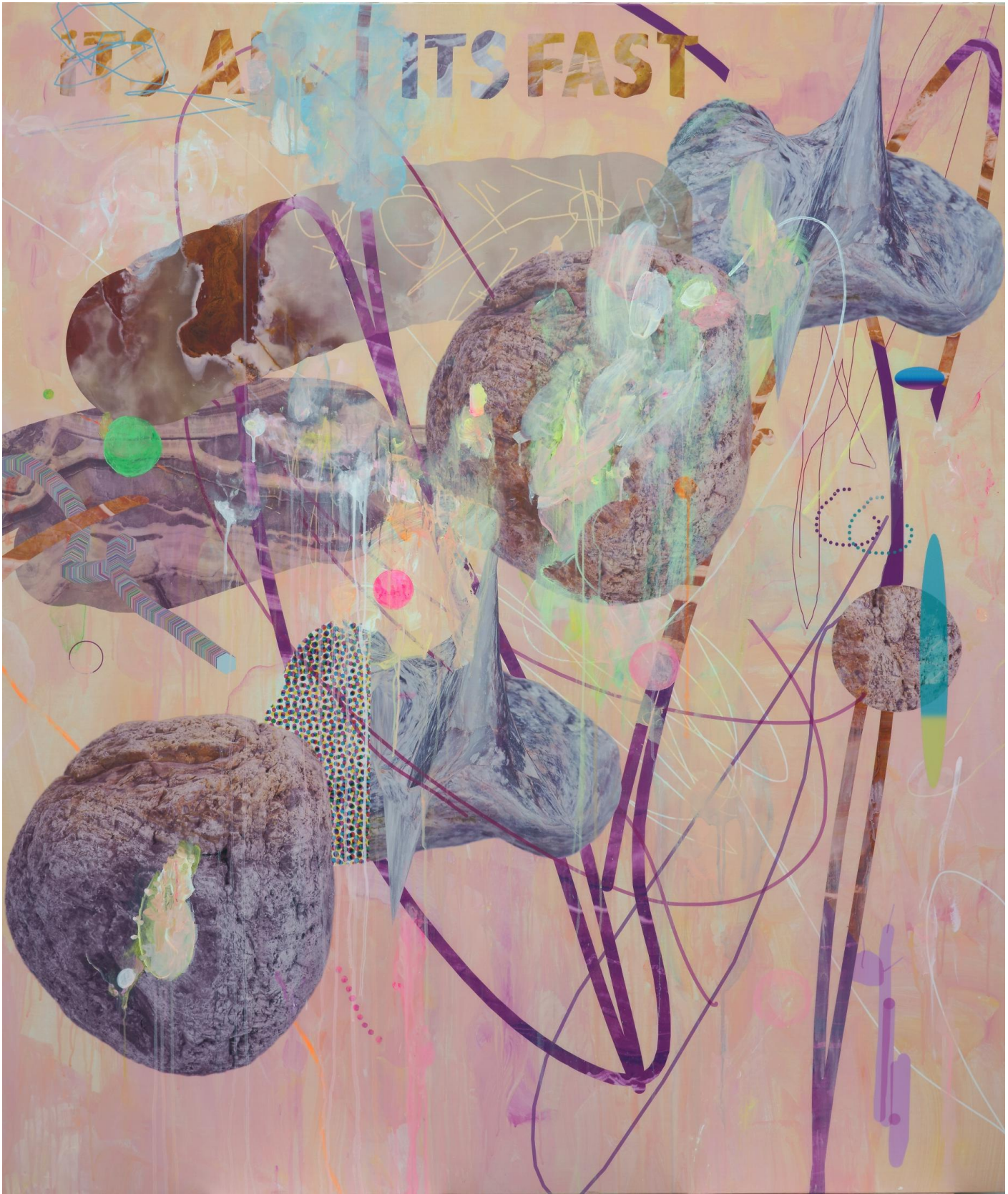
C-Rock 105 , 2018 180 x 150cm 布面丙烯，丝网印 acrylic, screen print on canvas