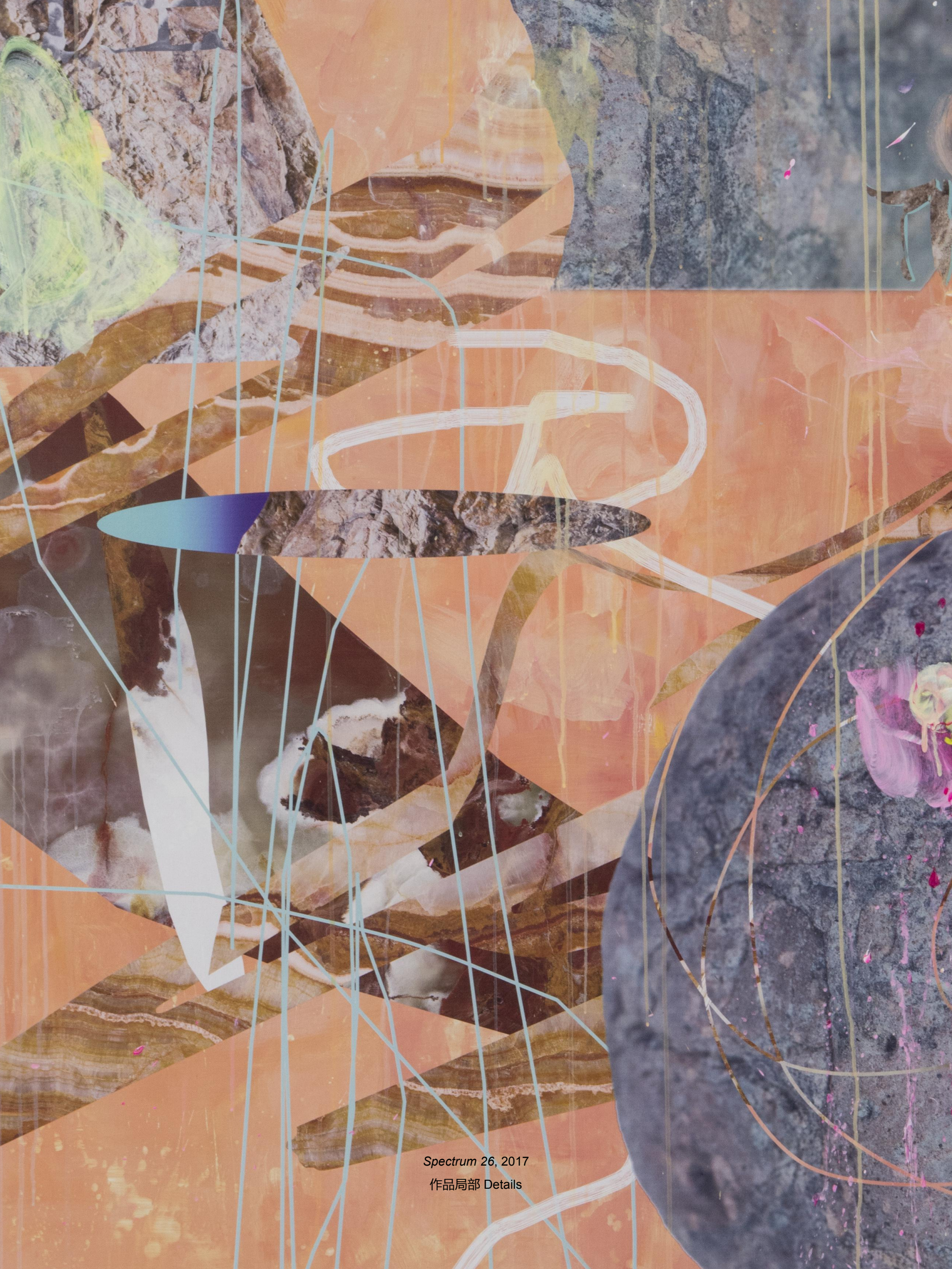
Spectrum 26, 2017 作品局部 Details