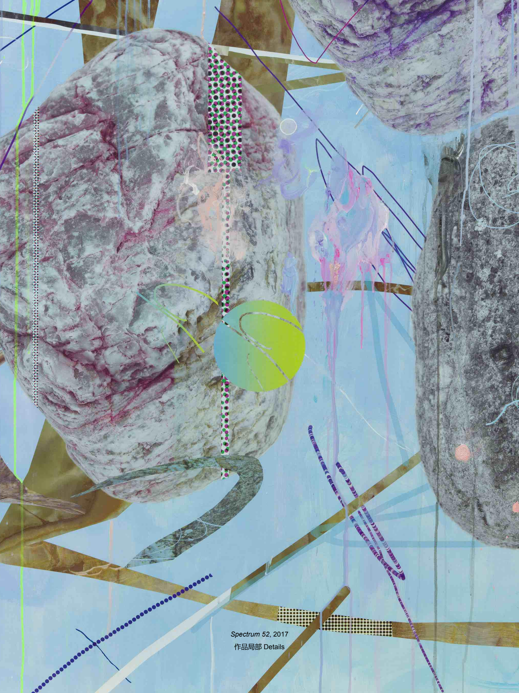
Spectrum 52, 2017 作品局部 Details