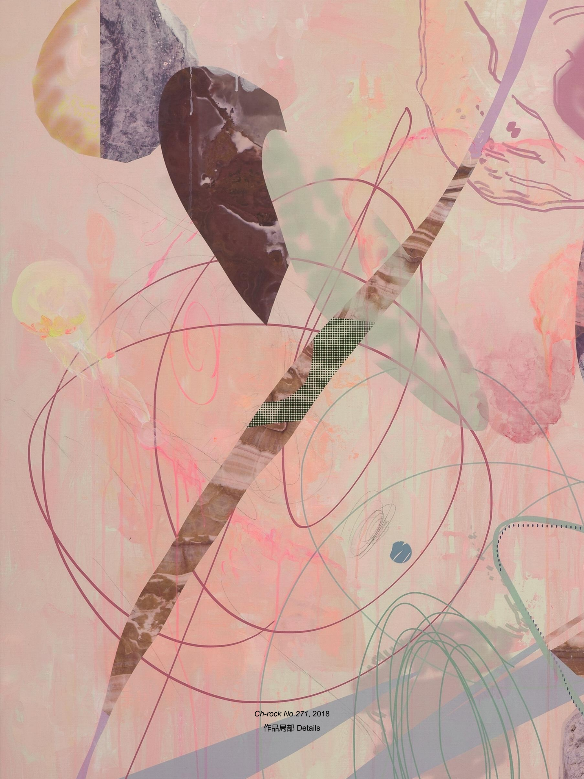
Ch-rock No.271, 2018 作品局部 Details