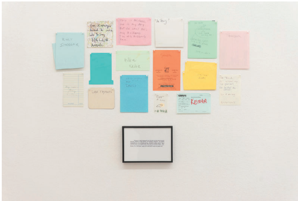
Joseph Grigely Untitled Conversations (Names), 1998 Framed text and 16 sheets of paper, pins 53 x 76 cm Unique