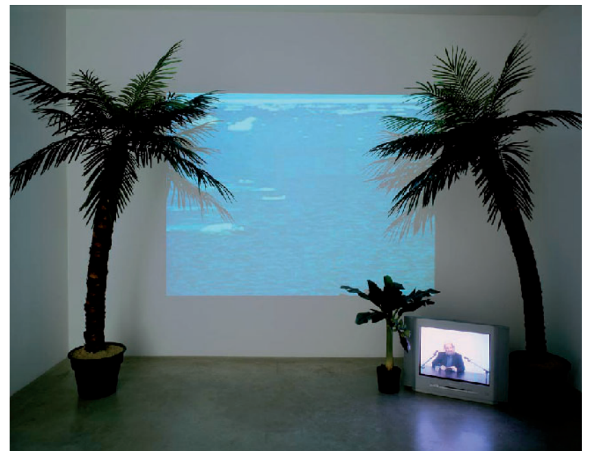
Exhibition views, Joseph Grigely: It's Everywhere, Air de Paris, 2005. More information