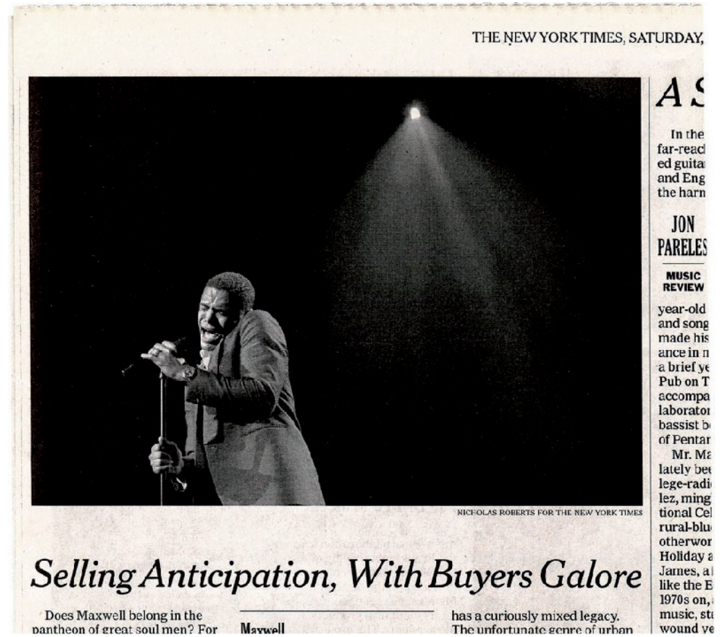
Joseph Grigely Songs without Words (Maxwell), 2012 framed digital pigment print 76 x 90 cm / 83,34 x 98,58 cm Edition of 3