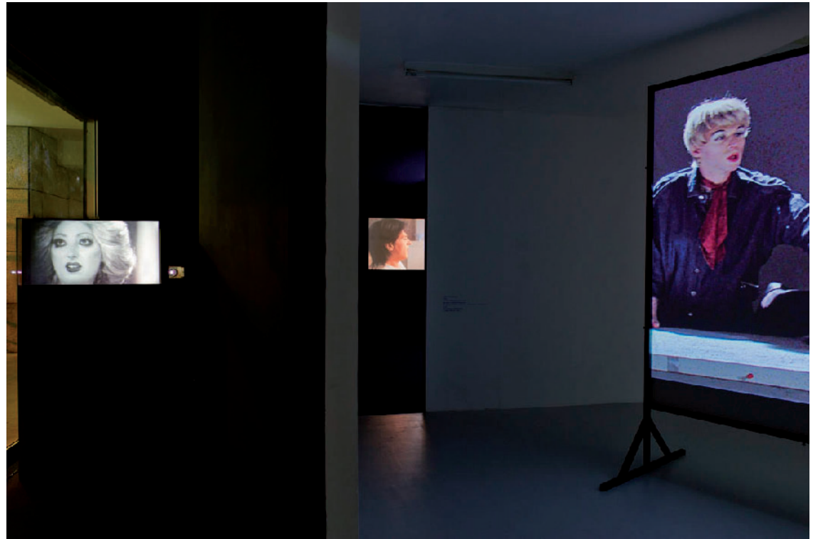
Exhibition Views, Brice Dellspurger: Bons Baisers d'Hollywood, Air de Paris, 2013. More Information