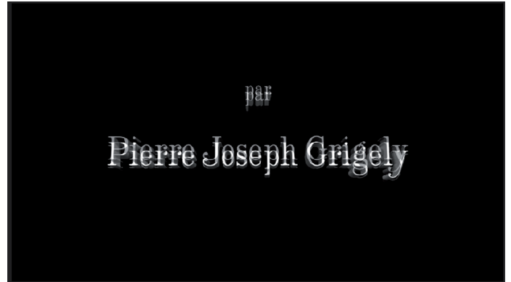
Joseph Grigely Pierre Joseph Grigely, 2017 digital pigment print on Photorag Hahnemühle paper 305g, frame 81 x 46 cm