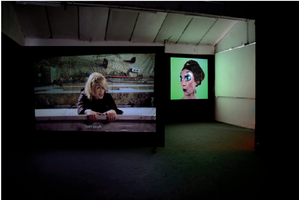
Exhibition Views, Brice Dellsperger: Like Mirror, Transpalette, Bourges, 2013. More Information