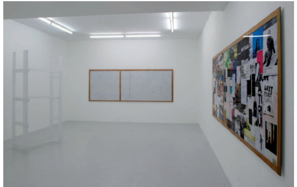
Exhibition views, Joseph Grigely: Remains, Air de Paris, 2012. More information