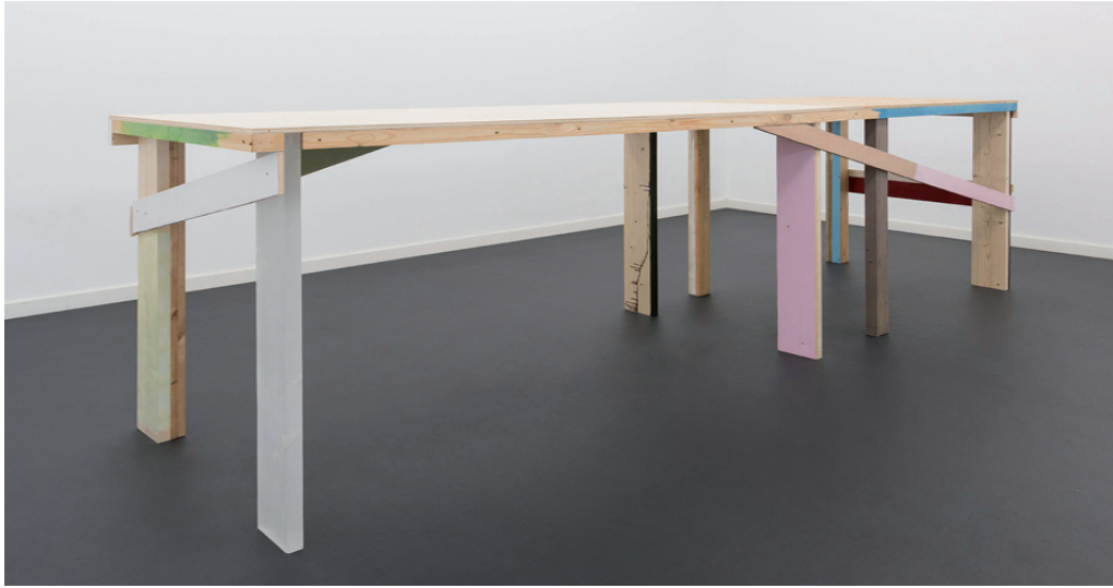
Joseph Grigely et Amy Vogel Horizontal Storage Rack (Madrid), 2014/2017 Wood, Crystal Urethane, and Polyurethane 366 x 87 x 112 cm Unique