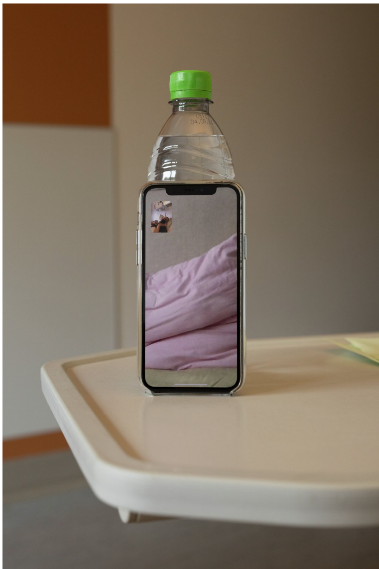
Wolfgang Tillmans Lüneburg (self) , 2020