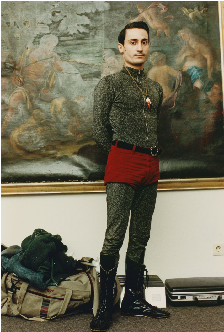
Wolfgang Tillmans Domenico, 1992

Courtoisie de l'artiste et de la | Courtesy of the artist and Galerie Chantal Crousel, Paris. © Wolfgang Tillmans.