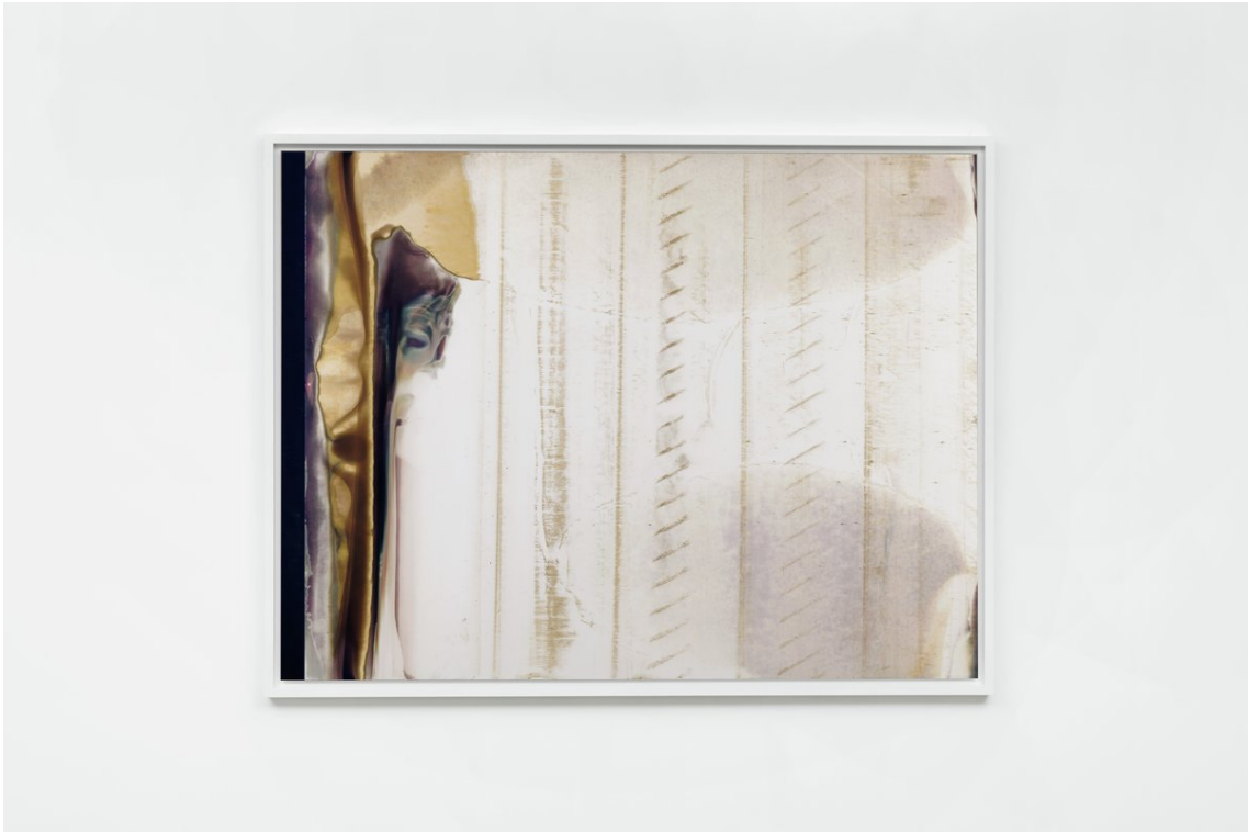
Wolfgang Tillmans Silver 246, 2017

Courtoisie de l'artiste et de la | Courtesy of the artist and Galerie Chantal Crousel, Paris. Photo: Aurélien Mole.