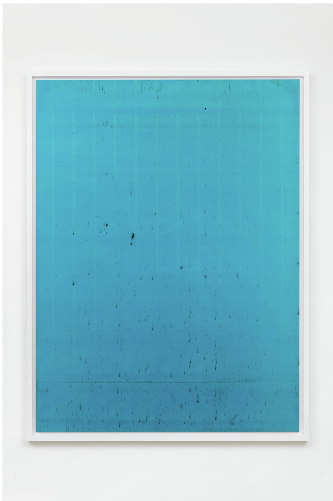
Wolfgang Tillmans Silver 209, 2014

Courtoisie de l'artiste et de la | Courtesy of the artist and Galerie Chantal Crousel, Paris. Photo: Aurélien Mole.