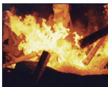
Risaku Suzuki "01, KK-1102", 2004 Chromogenic print 407 x 508 mm