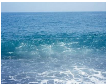
Risaku Suzuki "13, DK-198", 2013 Chromogenic print 952 x 1190 mm