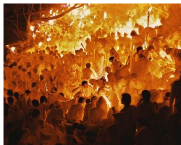
Risaku Suzuki "04, W-1916", 2004 Chromogenic print 407 x 508 mm