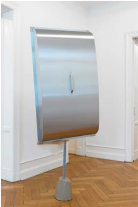
“Formage de tête” (Capot seul), 2011 Aluminium, silicon, stainless steel, lacquer, cast iron 233 x 90 x 40 cm NB2011_03