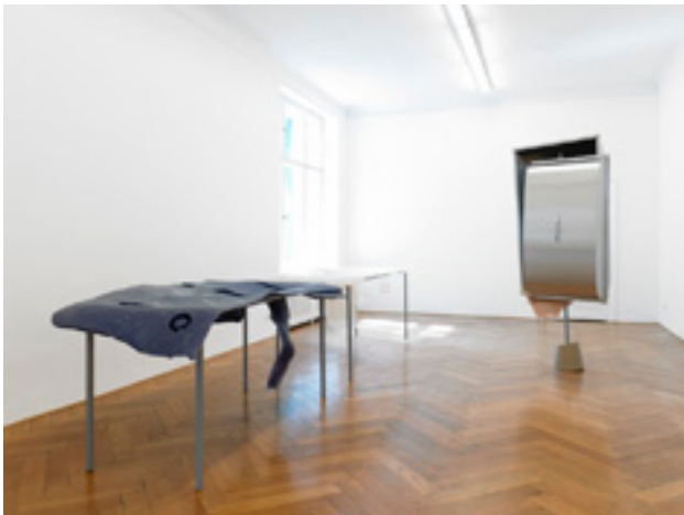
“Formage de tête” (Capot double), 2011 Aluminium, silicon, stainless steel, lacquer, cast iron 238 x 99 x 50 cm