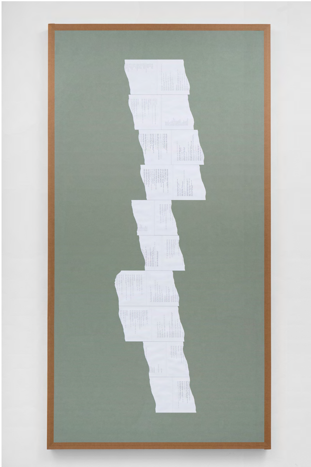
Jay Chung Q Takeki Maeda Es wurde ihr Beistand angeboten und sie nahm den Beistand an, 2021 Torn paper and wet adhesive tape on colored paper 254 x 134 x 5 cm | 100 x 52 3/4 x 2 in