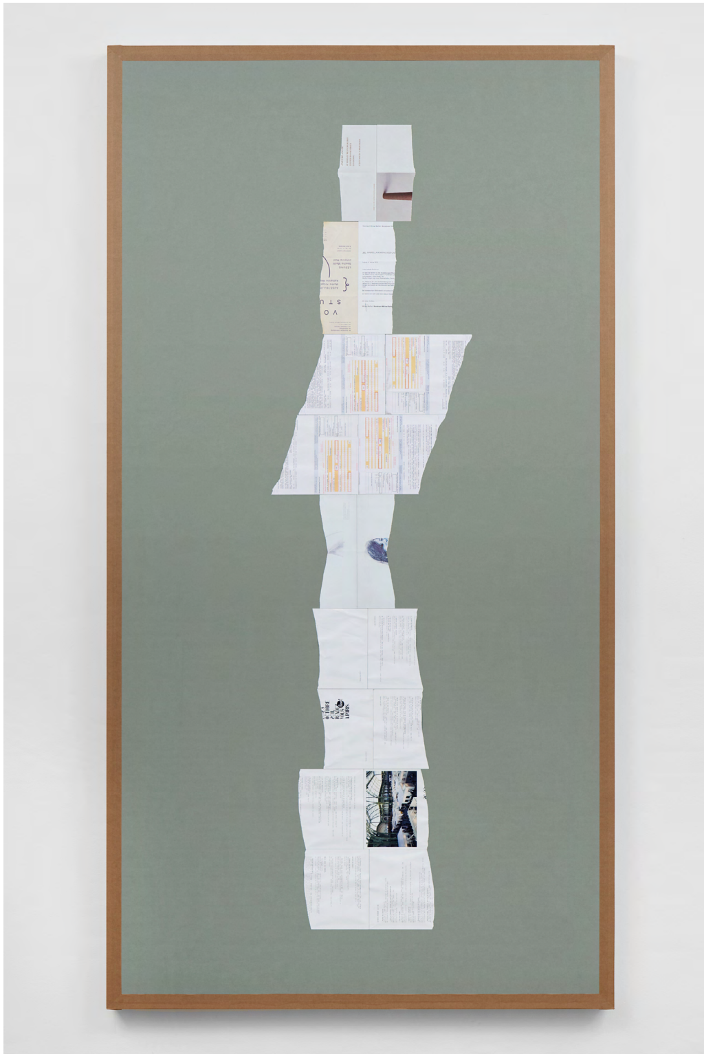
Jay Chung Q Takeki Maeda Sie haben gesehen, wie ich Sie aufgenommen habe, vorübergehend, in guter Weise, wie ich Sie vorübergehend auf dem Weg begleitet habe, 2021 Torn paper and wet adhesive tape on colored paper 254 x 134 x 5 cm | 100 x 52 3/4 x 2 in