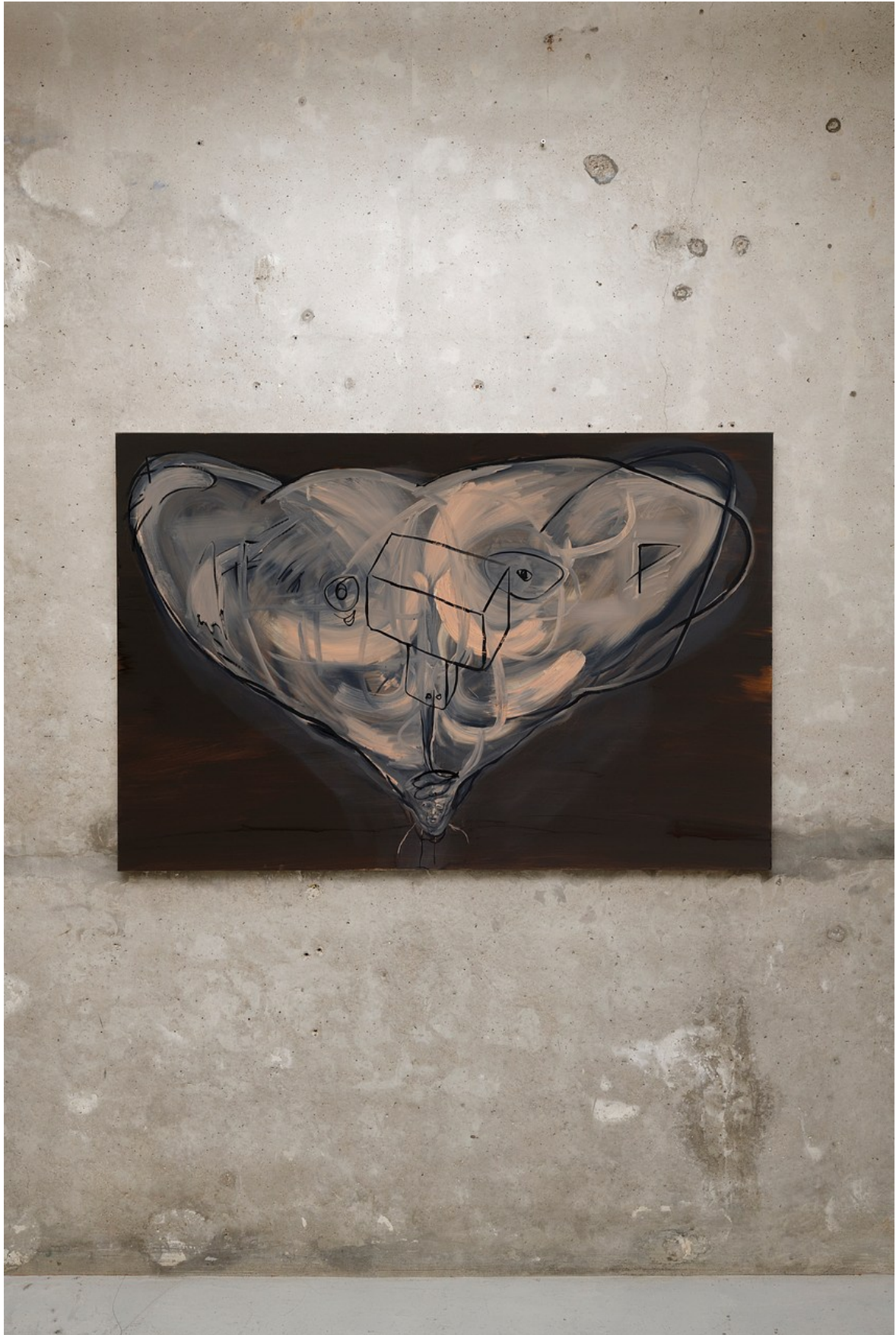
Nathaniel Mellors "Browserer" at Crèveœur, Paris, 2021