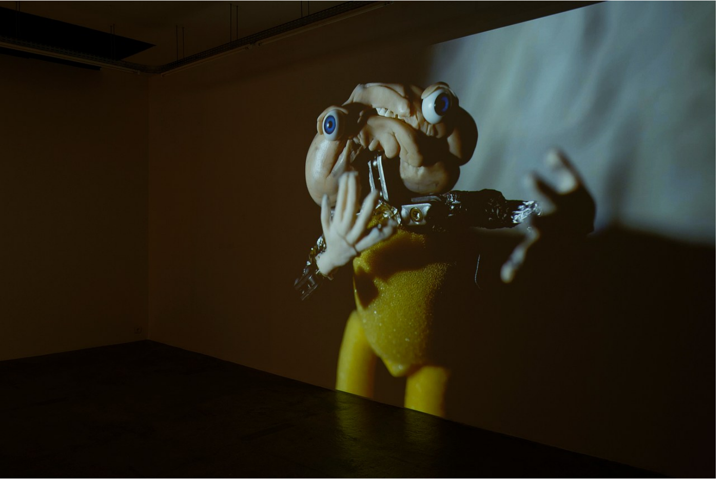
Nathaniel Mellors "Browserer" at Crèveœur, Paris, 2021