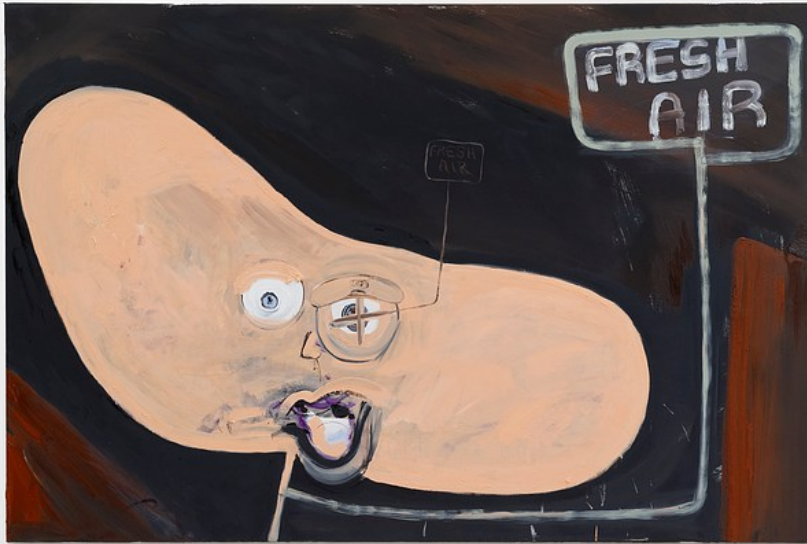
Nathaniel Mellors "Browserer" at Crèveœur, Paris, 2021