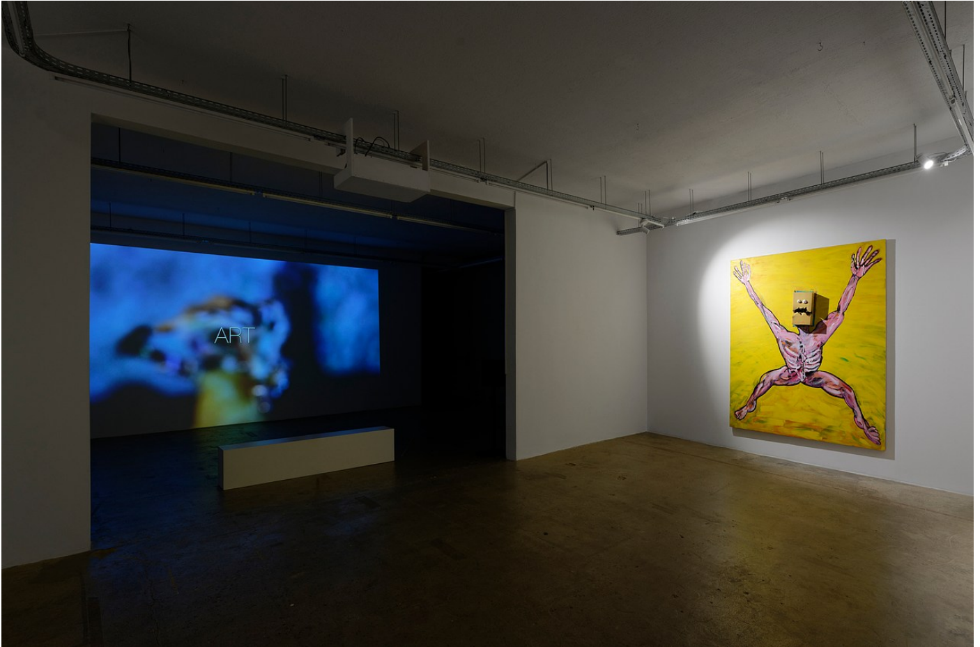
Nathaniel Mellors “Browserer” at Crèveœur, Paris, 2021