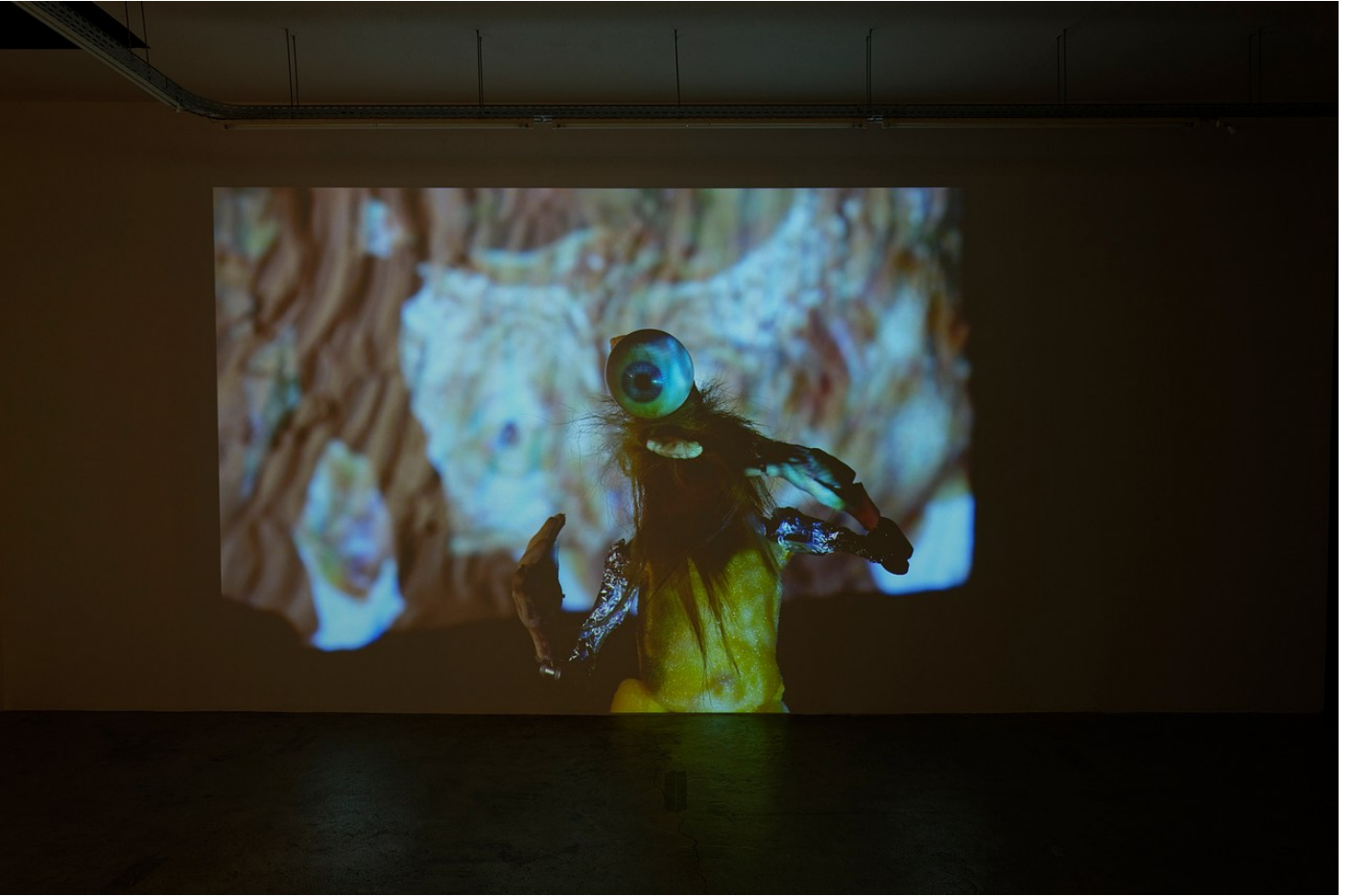
Nathaniel Mellors "Browserer" at Crèveœur, Paris, 2021