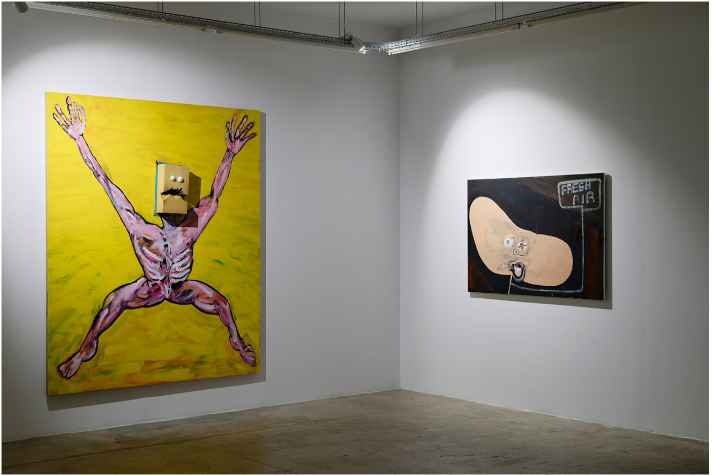
Nathaniel Mellors "Browserer" at Crèveœur, Paris, 2021