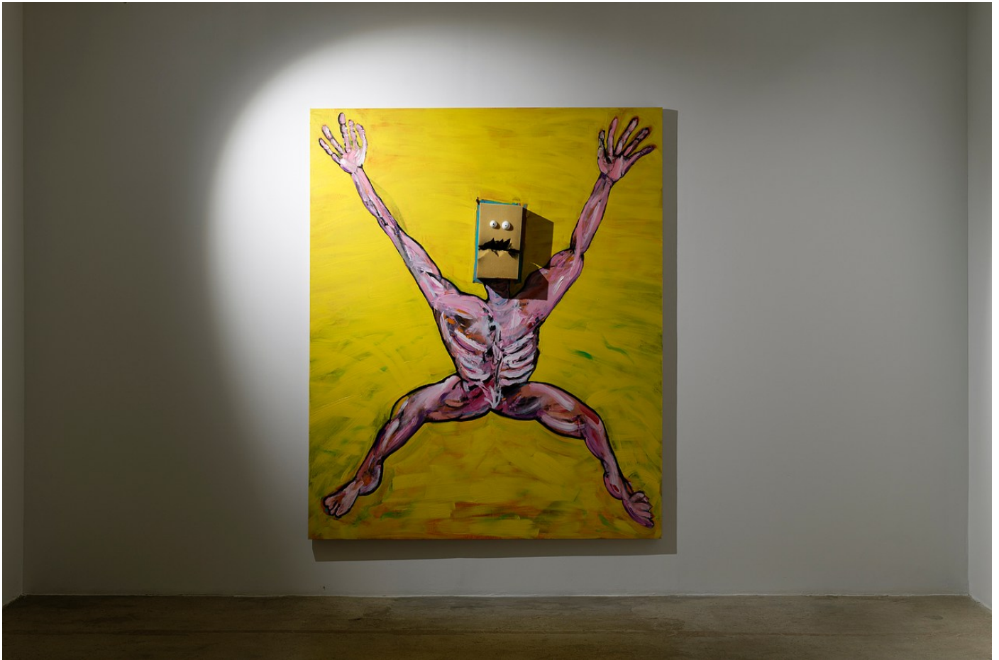
Nathaniel Mellors "Browserer" at Crèveœur, Paris, 2021