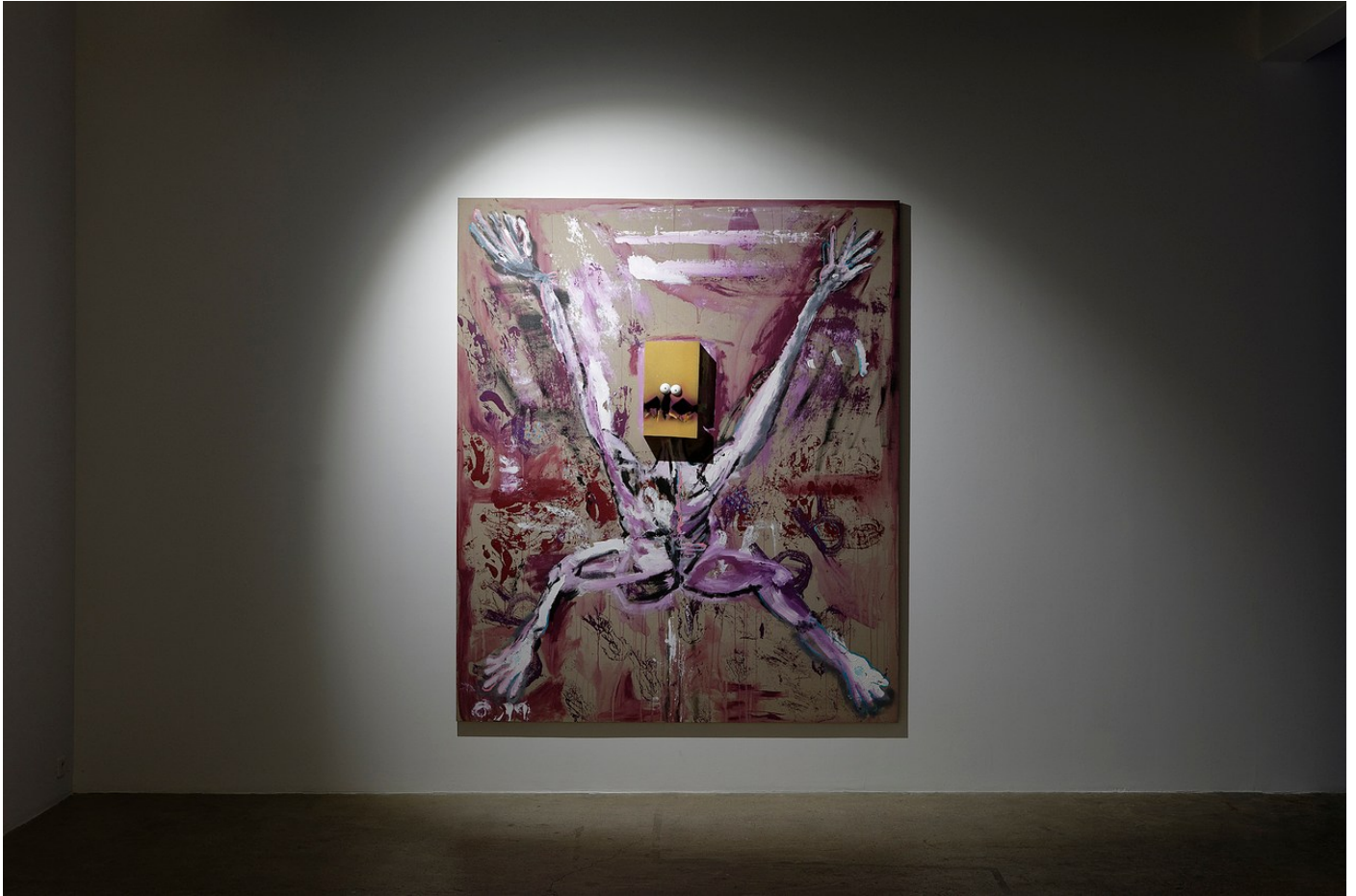
Nathaniel Mellors "Browserer" at Crèveœur, Paris, 2021