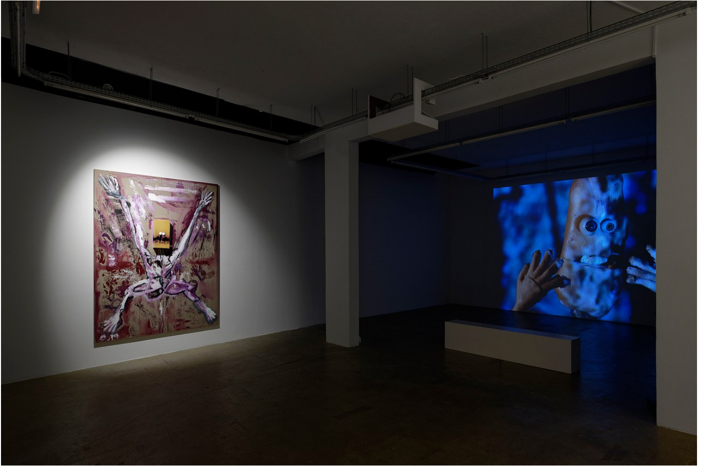
Nathaniel Mellors “Browserer” at Crèveœur, Paris, 2021