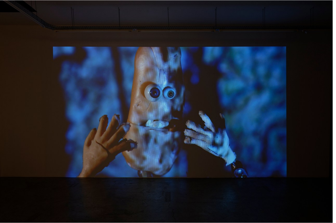
Nathaniel Mellors “Browserer” at Crèveœur, Paris, 2021