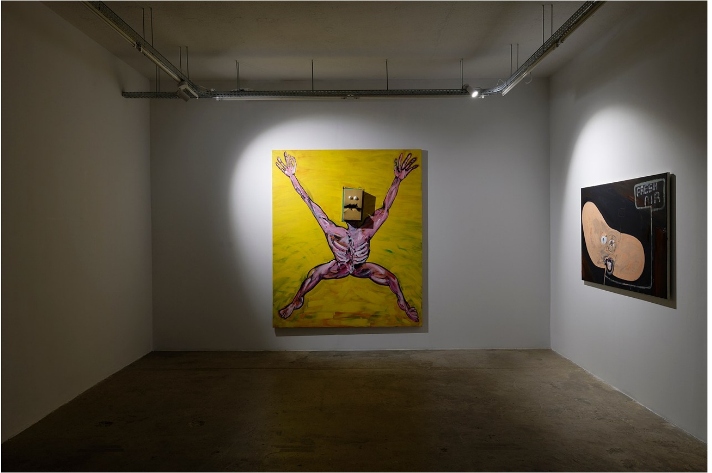
Nathaniel Mellors "Browserer" at Crèveœur, Paris, 2021