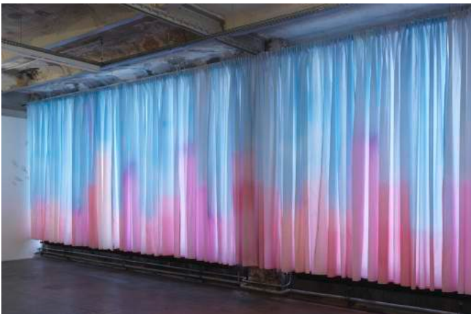
Nicolas Rabant, Baie de Guisseny , 2018 Vue de l'exposition «Rapelle-toi de la couleur des fraises», Le Crédac, Ivry Rideaux peints, 350x2000 cm