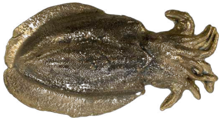
Nicolas Rabant, Seiche , 2021 Cuivre, étain 14x30 cm