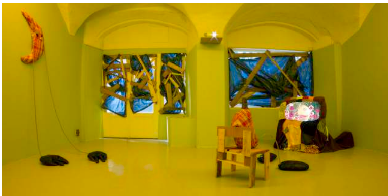
Hilary Galbreath, BUG EYES , 2019, installation de médiums mixtes Musique par Christophe Scarpa et David Donovan Courtesy de l'artiste et de In extenso, Clermont-Ferrand © photo : Michael Collet