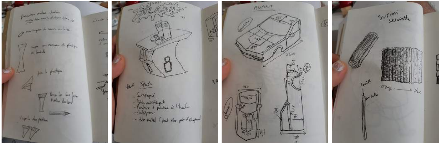
Carnet de croquis de l'artiste, déc. 2020

Compte-tenu de la crise sanitaire, son exposition, initialement prévue au printemps 2021, a été décalée à l'automne 2021.