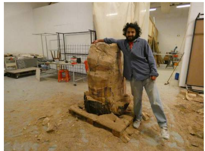
Vues de l'atelier Les Chantiers, Passerelle Centre d'art contemporain, Brest, janv. 2021