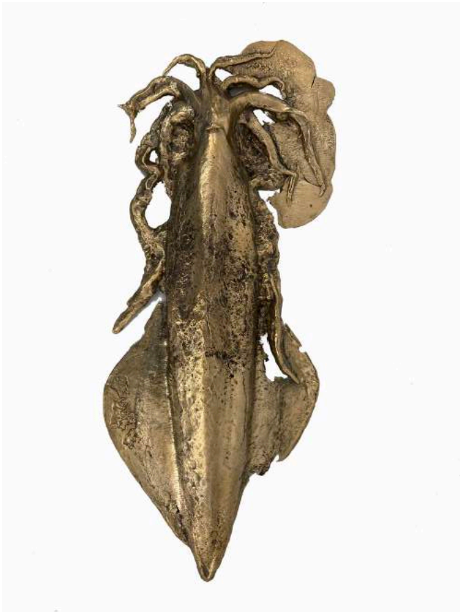
Nicolas Rabant, Calamar , 2021 Cuivre, étain 25x55 cm