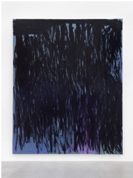
Astrid Fernández XX, 2021 pigments on nettle 430 x 350cm