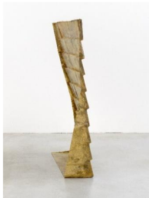
Gonalo Sena Montanhas e Escamas, 2016 [Mountains and Scales] concrete and epoxy resin 180 x 112 x 45 cm courtesy Galería Heinrich Ehrhardt, Madrid Foto: Roman Marz, 2021 © Oldenburger Kunstverein