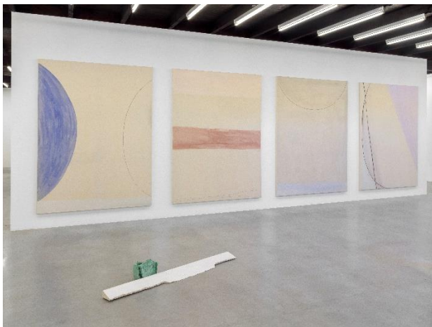
(on the wall) Astrid Fernández XIII ^ / CCJII ^ / XVII ^ / XVCII ^, 2021 pigments / coal on nettle 240 x 190 cm