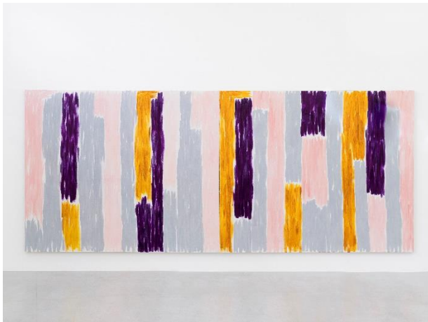
Emanuel Seitz Untitled, 2021 acrylic on canvas 250 x 600 cm (Diptychon) courtesy Jacky Strenz, Frankfurt Foto: Roman Marz, 2021 © Oldenburger Kunstverein