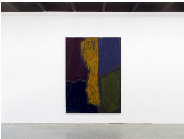
Emanuel Seitz Untitled, 2021 acrylic on canvas 225 x 165 cm