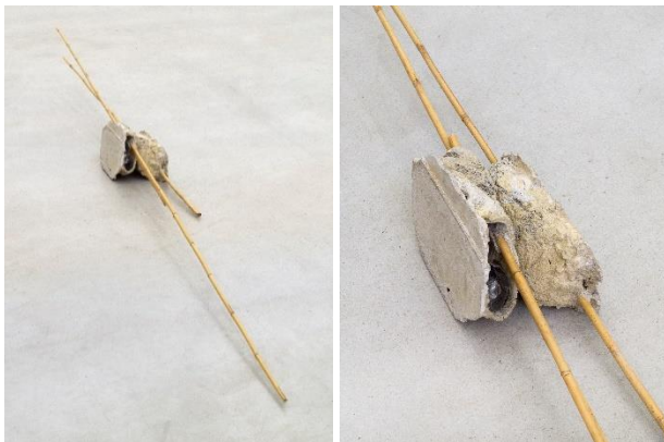
Gonalo Sena Erosion Horizon, 2021 concrete, polyurethane, wire, plastic bottles and bamboo 26 x 348 x 24 cm courtesy Galería Heinrich Ehrhardt, Madrid Foto: Roman Marz, 2021 © Oldenburger Kunstverein