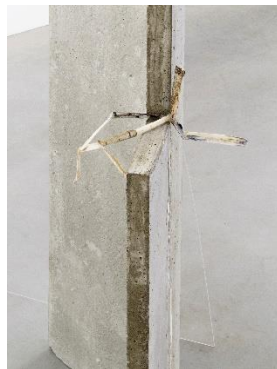
Gonçalo Sena Drought, 2019 concrete, iron, perspex, glue, ink, sea shells (solen marginatus) 150 x 45 x 115 cm courtesy Galería Heinrich Ehrhardt, Madrid Foto: Roman März, 2021 © Oldenburger Kunstverein