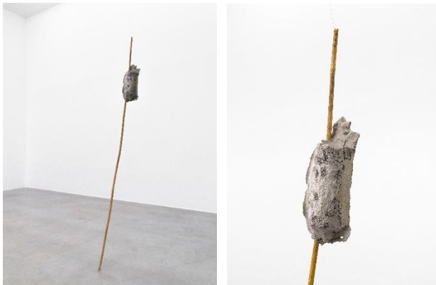
Gonçalo Sena Erosion Horizon, 2020 concrete, brass wire, polyurethane, bamboo and braided line 230 x 12 x 11 cm courtesy Galería Heinrich Ehrhardt, Madrid Foto: Roman März, 2021 © Oldenburger Kunstverein