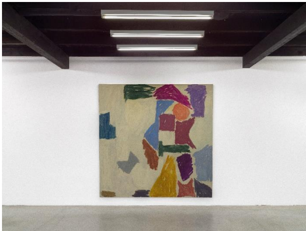
Emanuel Seitz Untitled, 2021 acrylic on canvas 250 x 250 cm courtesy Galeria Heinrich Ehrhardt, Madrid Foto: Roman März, 2021 © Oldenburger Kunstverein