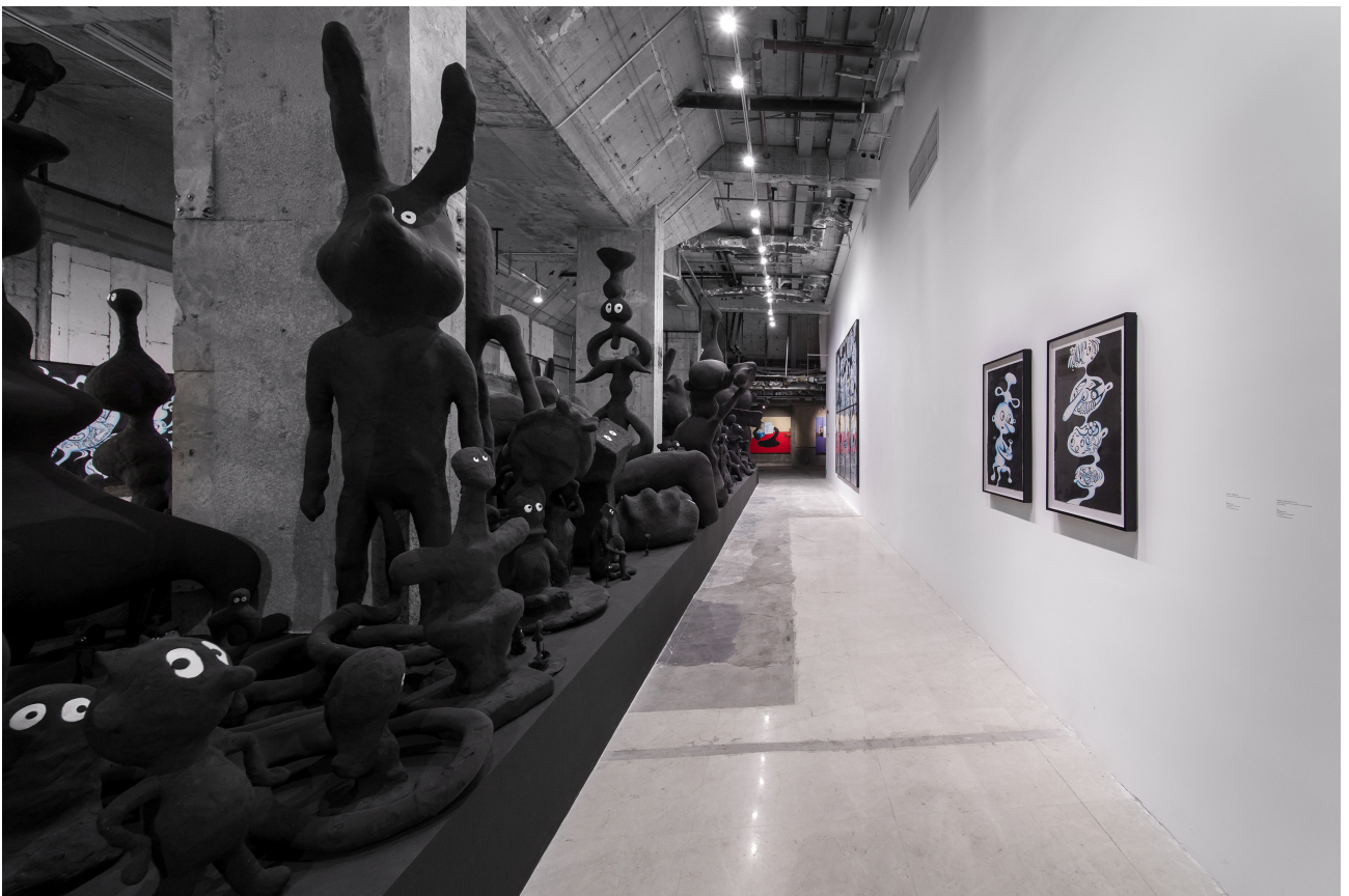
展览现场，“第一个艺术家”，没顶画廊，上海，2021