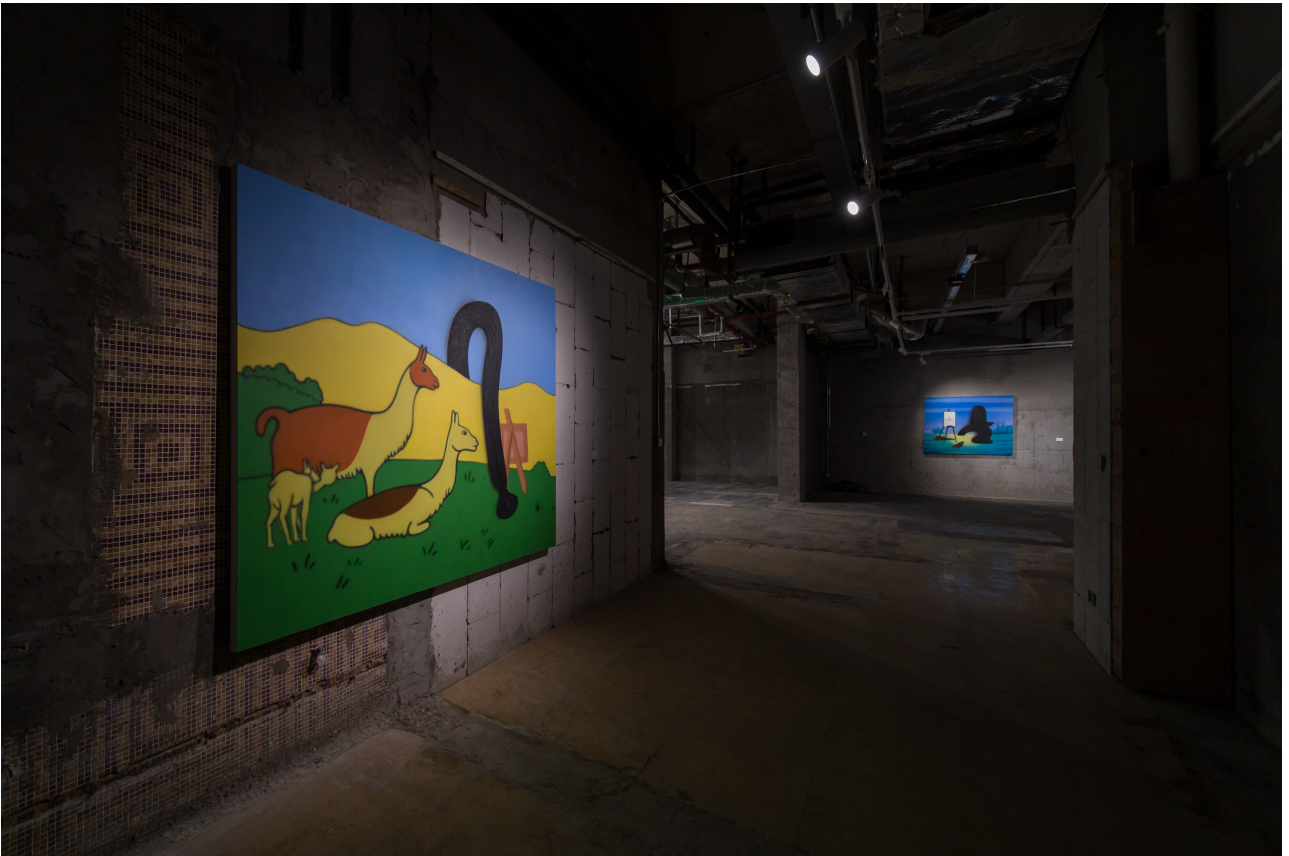
展览现场，“第一个艺术家”，没顶画廊，上海，2021