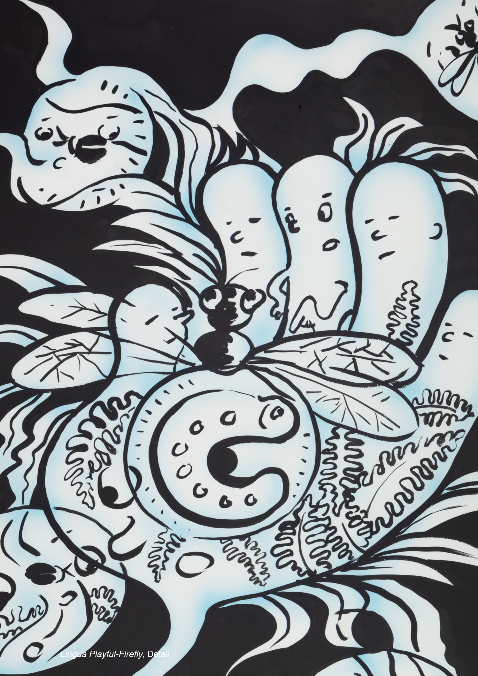
Lingua Playful-Firefly, Detail