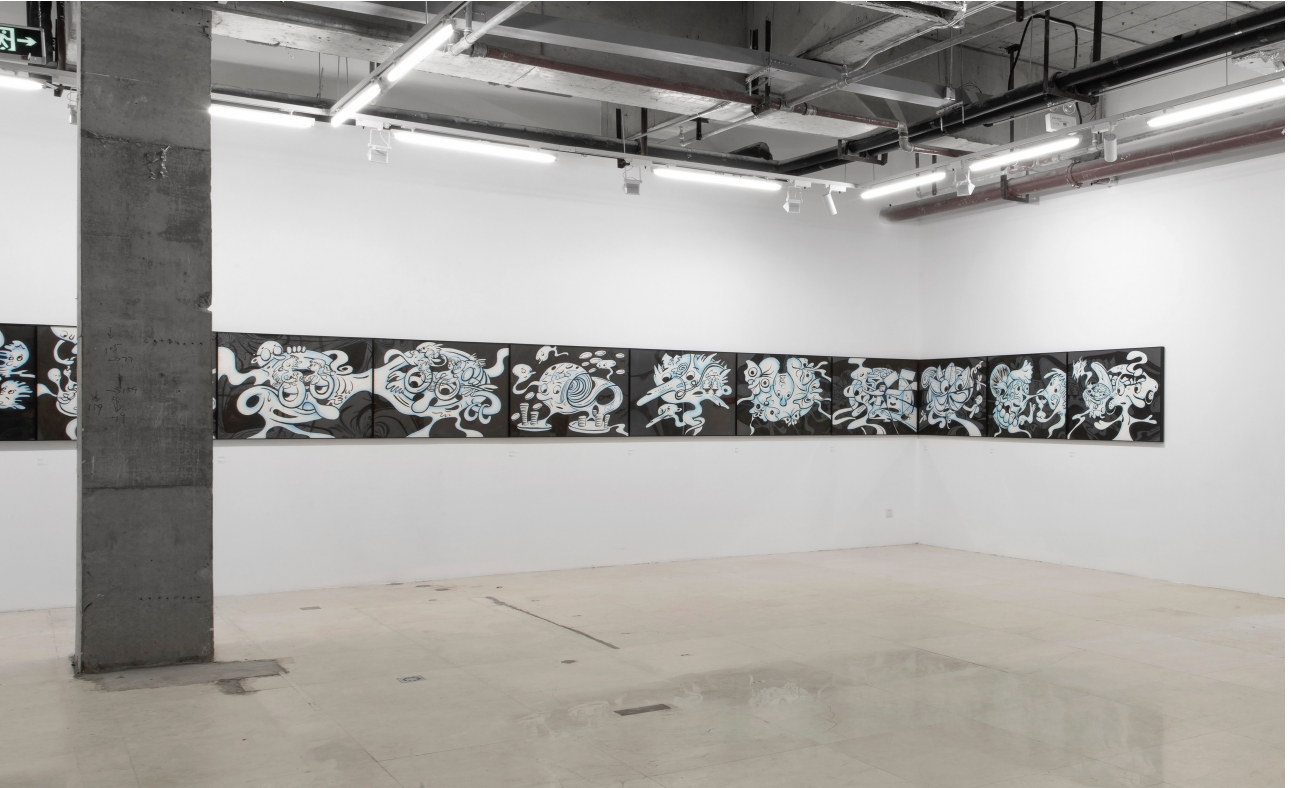
展览现场，“第一个艺术家”，没顶画廊，上海，2021