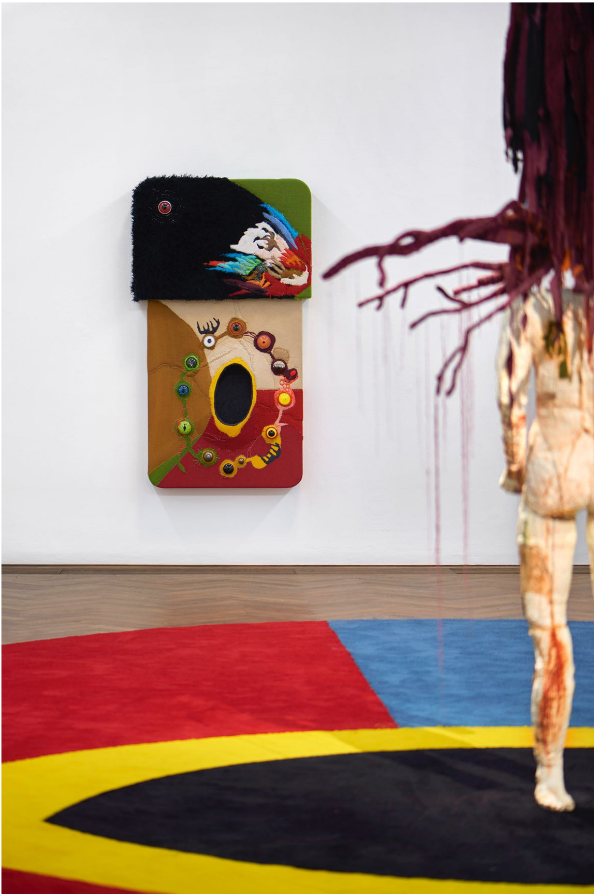
Installationsansicht, Pedro Wirz, Environmental Hangover , Kunsthalle Basel, 2022, Blick auf Coro de Princesa (Amarelão) , 2022 (links), Chapéu Telúrico , 2022 (rechts), Ovo Espacial , 2022 (Boden).