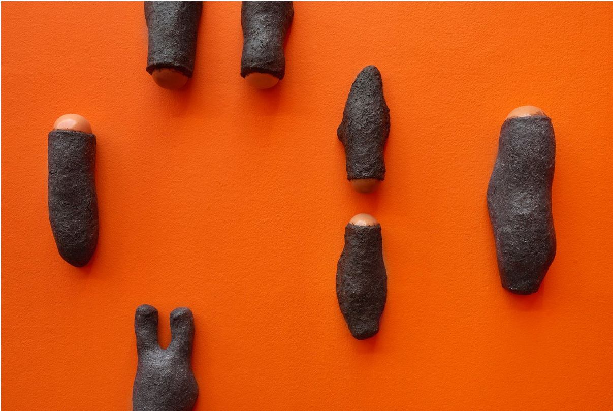
Installationsansicht, Pedro Wirz, Environmental Hangover , Kunsthalle Basel, 2022, Blick auf die Serie Sour Ground , 2022. Installation view, Pedro Wirz, Environmental Hangover , Kunsthalle Basel, 2022, view on the series Sour Ground , 2022.