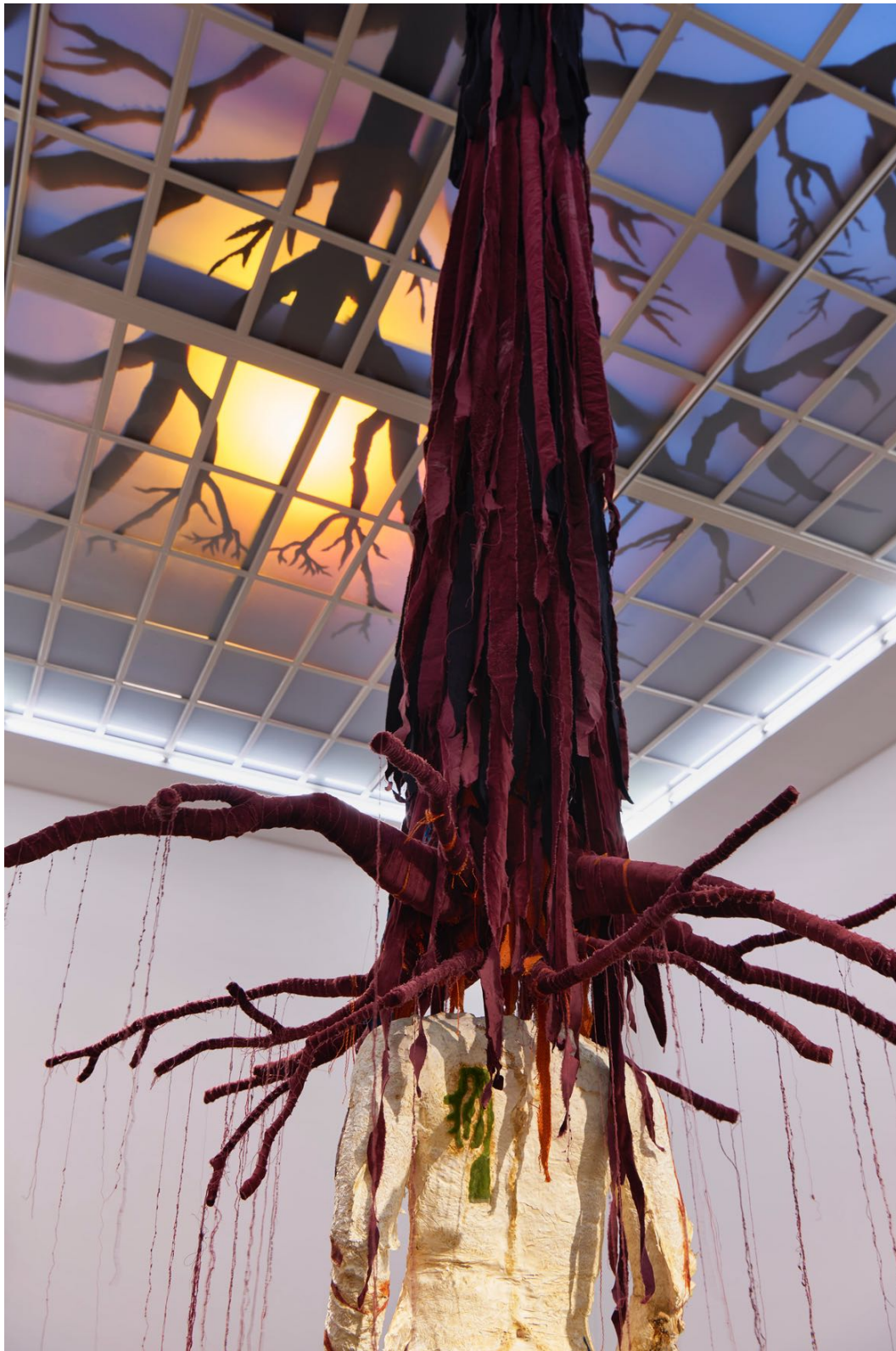
Installationsansicht, Pedro Wirz, Environmental Hangover , Kunsthalle Basel, 2022, Blick auf Chapéu Telúrico , 2022. Installation view, Pedro Wirz, Environmental Hangover , Kunsthalle Basel, 2022, view on Chapéu Telúrico , 2022.

Pressebilder / Press Images Download-Link: kunsthallebasel.ch/presse/