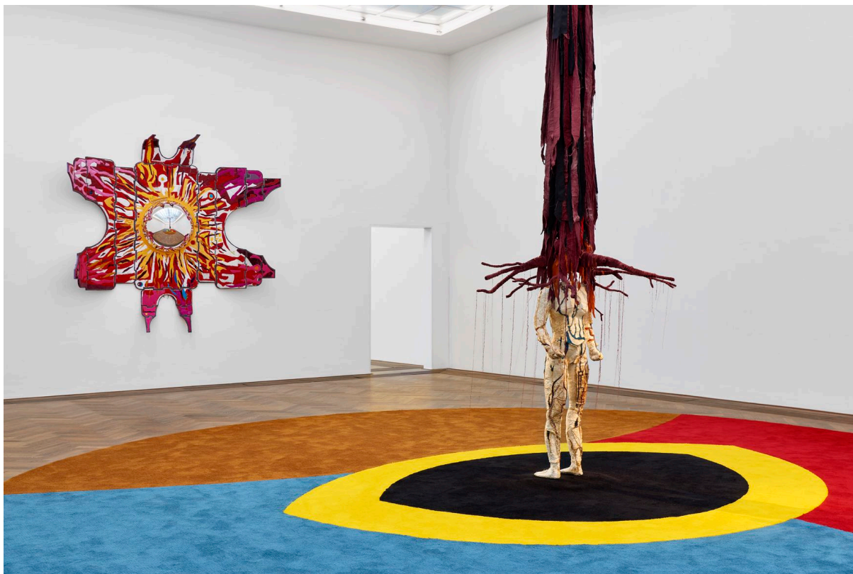
Installationsansicht, Pedro Wirz, Environmental Hangover , Kunsthalle Basel, 2022, Blick auf Flor Satélite , 2022 (links), Chapéu Telúrico , 2022 (rechts), Ovo Espacial , 2022 (Boden). Installation view, Pedro Wirz, Environmental Hangover , Kunsthalle Basel, 2022, view on Flor Satélite , 2022 (left), Chapéu Telúrico , 2022 (right), Ovo Espacial , 2022 (floor).