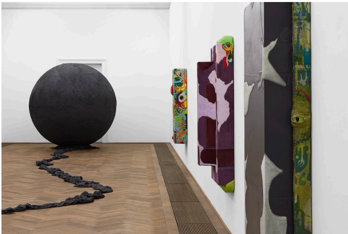
Installationsansicht, Pedro Wirz, Environmental Hangover , Kunsthalle Basel, 2022, Blick v. l. n. r. auf Exúvia , 2022, Coro de Princesa (Sumaúma) , 2022, Coro de Princesa (Seringa) , 2022, Coro de Princesa (Envira Preta) , 2022.