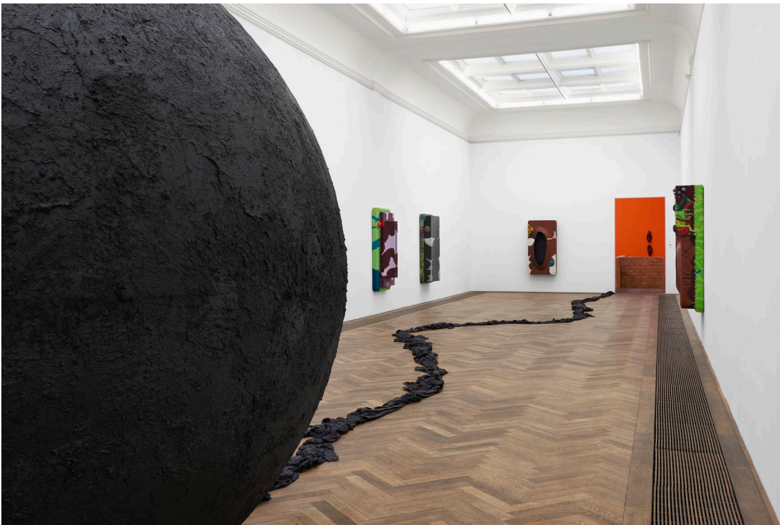
Installationsansicht, Pedro Wirz, Environmental Hangover , Kunsthalle Basel, 2022. Installation view, Pedro Wirz, Environmental Hangover , Kunsthalle Basel, 2022.