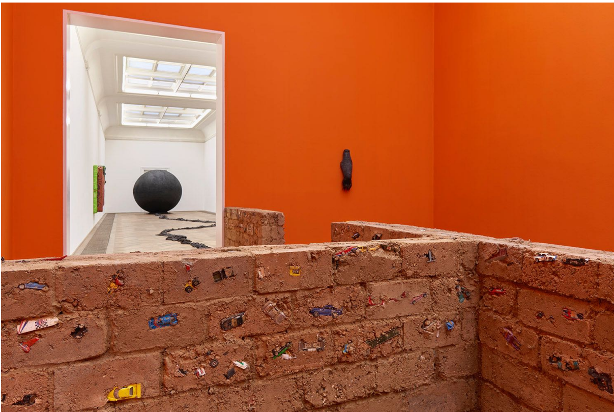
Installationsansicht, Pedro Wirz, Environmental Hangover , Kunsthalle Basel, 2022. Installation view, Pedro Wirz, Environmental Hangover , Kunsthalle Basel, 2022.