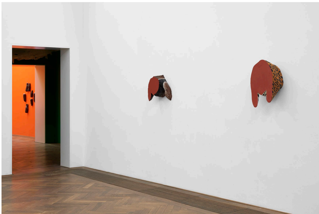
Installationsansicht, Pedro Wirz, Environmental Hangover , Kunsthalle Basel, 2022, Blick auf Bicho Abstrato (Tamanduá) , 2022 (links), und Bicho Abstrato (Onça) , 2022 (rechts). Installation view, Pedro Wirz, Environmental Hangover , Kunsthalle Basel, 2022, view on Bicho Abstrato (Tamanduá) , 2022 (left), und Bicho Abstrato (Onça) , 2022 (right).