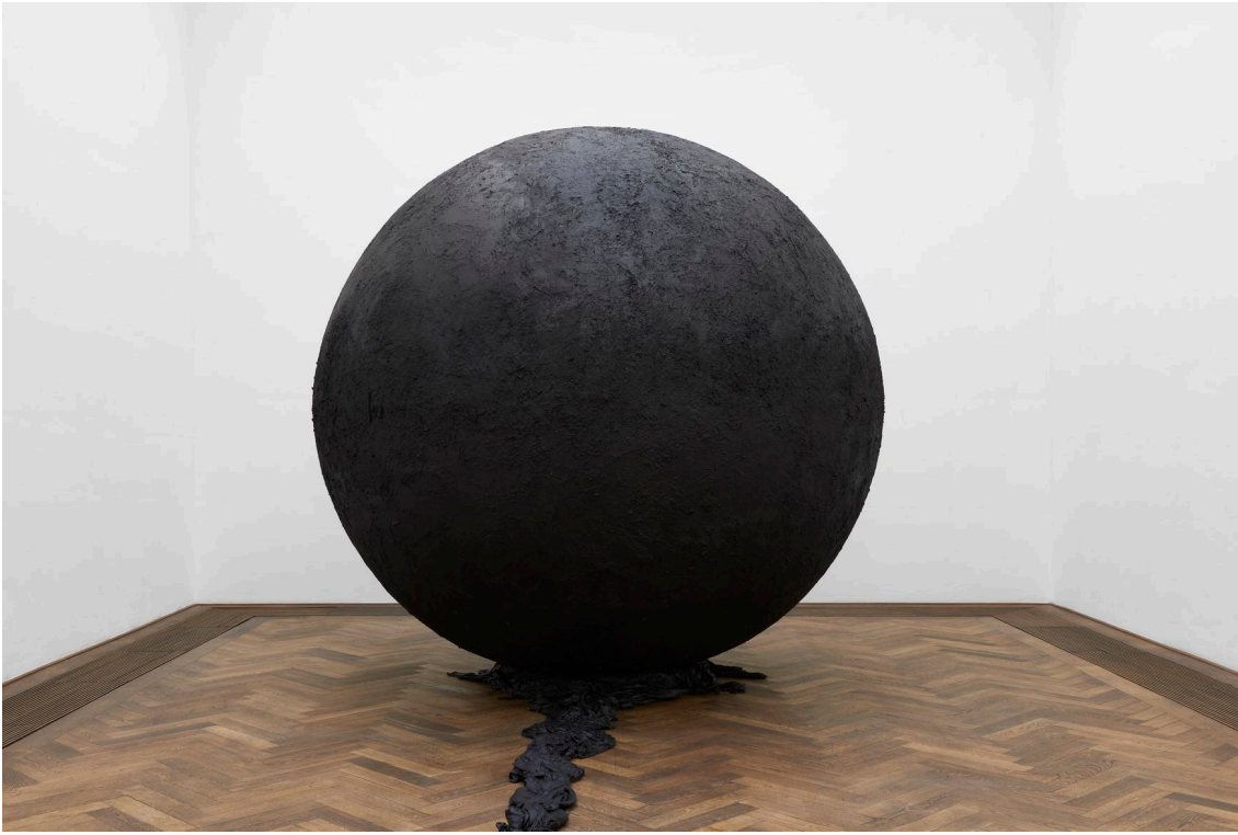
Installationsansicht, Pedro Wirz, Environmental Hangover , Kunsthalle Basel, 2022, Blick auf Exúvia , 2022. Installation view, Pedro Wirz, Environmental Hangover , Kunsthalle Basel, 2022, view on Exúvia , 2022.