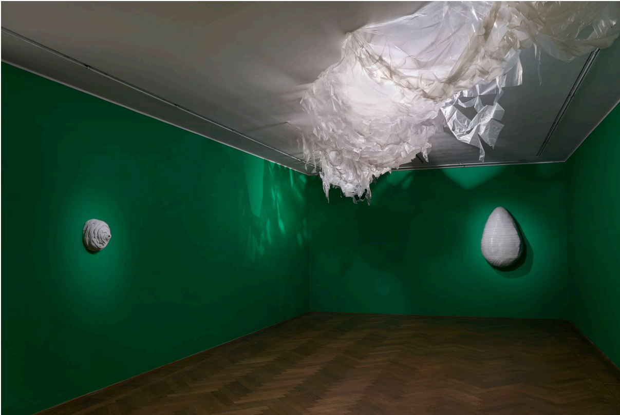
Installationsansicht, Pedro Wirz, Environmental Hangover , Kunsthalle Basel, 2022, Blick auf Untitled (Nest) , 2022 (links), Bela Peça , 2022 (rechts), Corpo Seco , 2022 (Decke). Installation view, Pedro Wirz, Environmental Hangover , Kunsthalle Basel, 2022, view on Untitled (Nest) , 2022 (left), Bela Peça , 2022 (right), Corpo Seco , 2022 (ceiling).