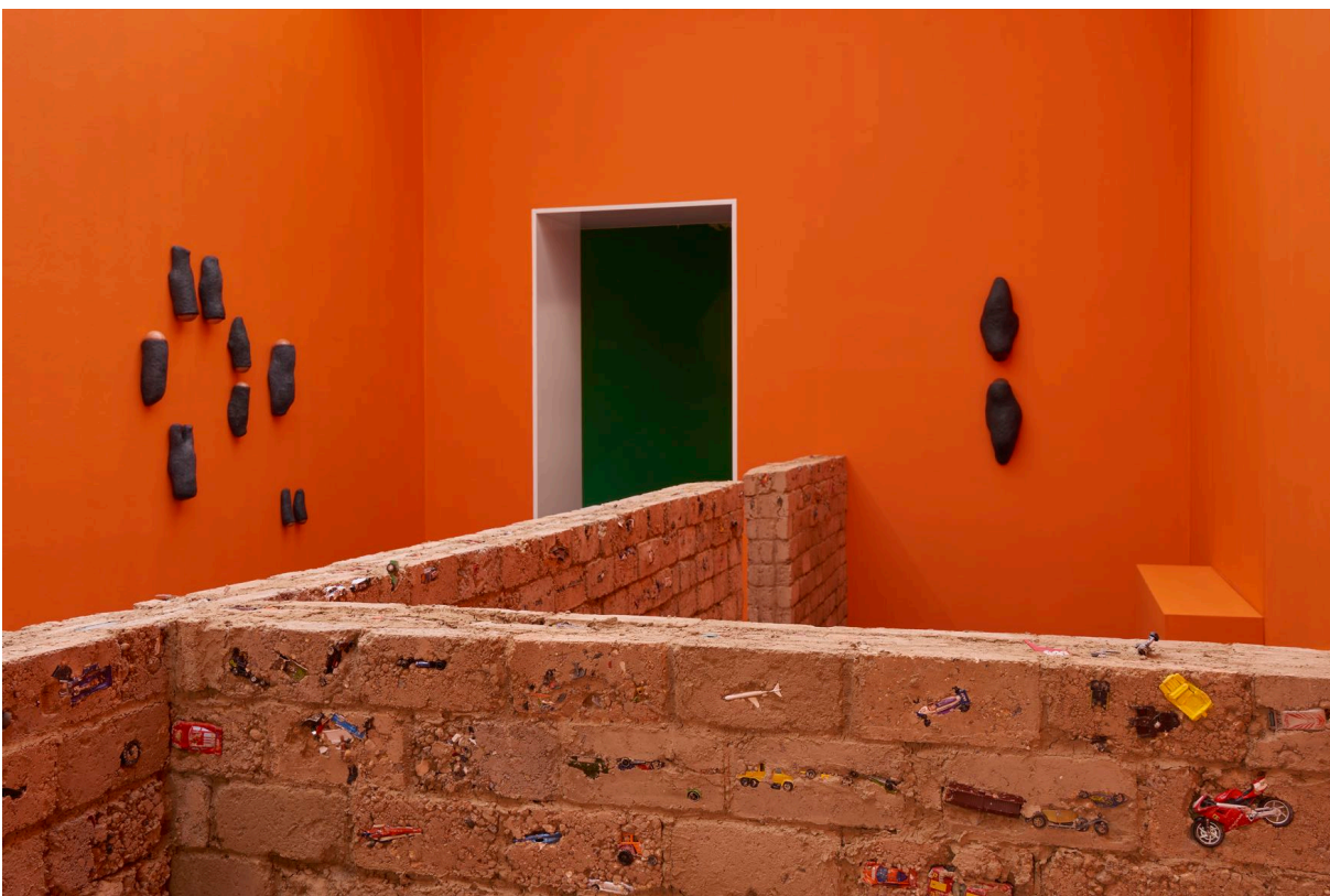
Installationsansicht, Pedro Wirz, Environmental Hangover , Kunsthalle Basel, 2022, Blick auf Our cities are made to be destroyed , 2016–2022 (vorne) und die Serie Sour Ground , 2022 (hinten). Installation view, Pedro Wirz, Environmental Hangover , Kunsthalle Basel, 2022, view on Our cities are made to be destroyed , 2016–2022 (front) and the series Sour Ground , 2022 (back).