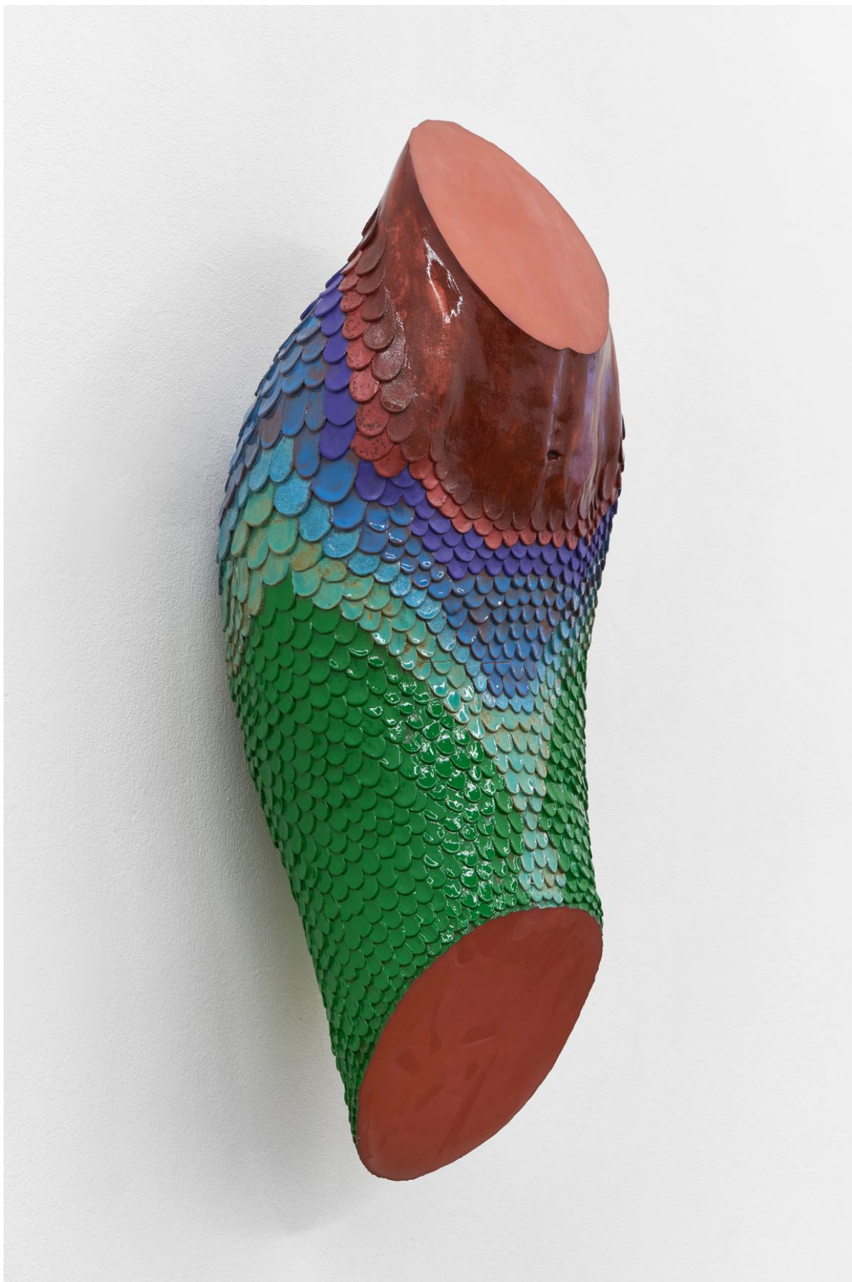
Installationsansicht, Pedro Wirz, Environmental Hangover , Kunsthalle Basel, 2022, Blick auf Bicho Abstrato (Iara) , 2022. Installation view, Pedro Wirz, Environmental Hangover , Kunsthalle Basel, 2022, view on Bicho Abstrato (Iara) , 2022.