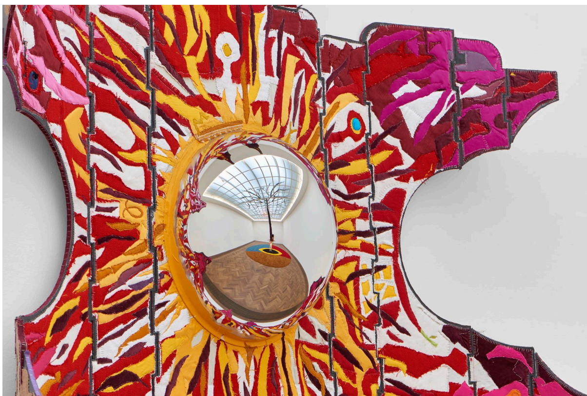
Installationsansicht, Pedro Wirz, Environmental Hangover , Kunsthalle Basel, 2022, Blick auf Flor Satélite , 2022. Installation view, Pedro Wirz, Environmental Hangover , Kunsthalle Basel, 2022, view on Flor Satélite , 2022.