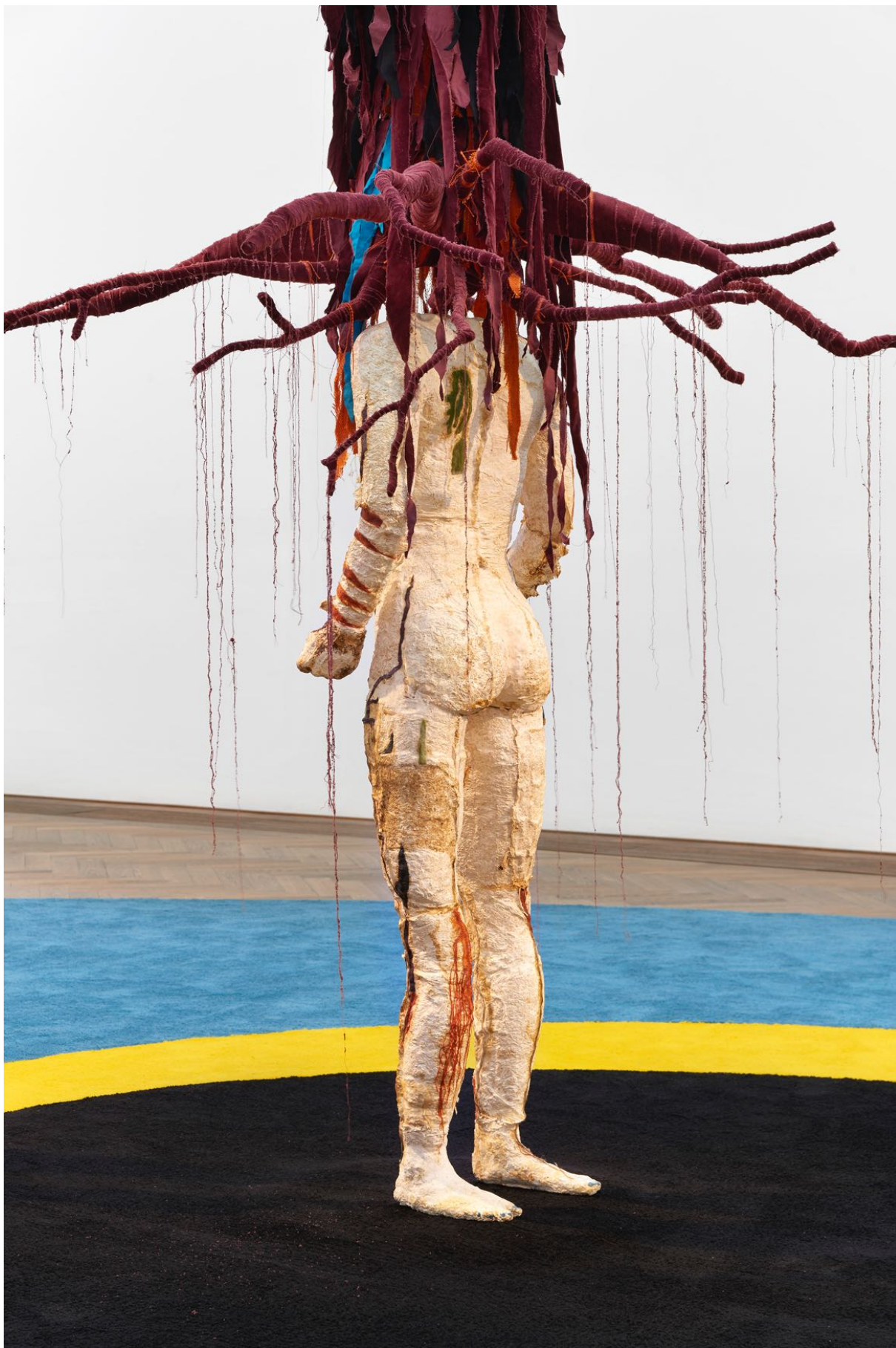
Installationsansicht, Pedro Wirz, Environmental Hangover , Kunsthalle Basel, 2022, Blick auf Chapéu Telúrico , 2022, und Ovo Espacial , 2022 (Boden). Installation view, Pedro Wirz, Environmental Hangover , Kunsthalle Basel, 2022, view on Chapéu Telúrico , 2022, and Ovo Espacial , 2022 (floor).