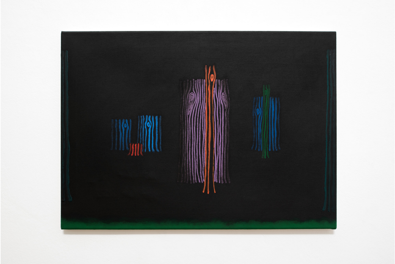
Nō - West , 2022 Acrylic on canvas 50 x 70 cm