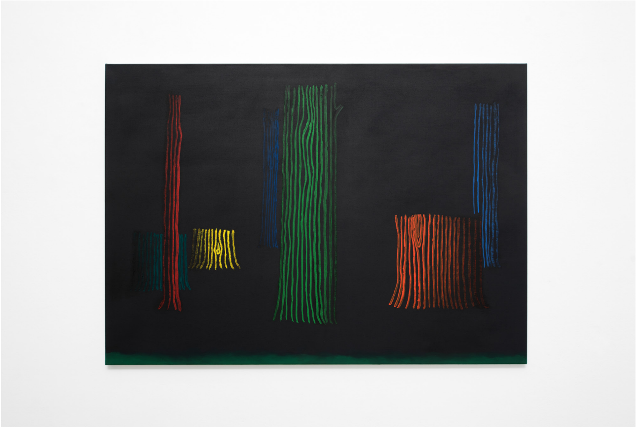
Kinderspiel , 2022 Acrylic on canvas 100 x 140 cm