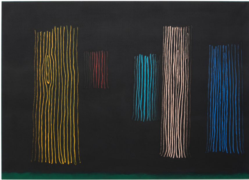
Schau , 2022 Acrylic on canvas 100 x 140 cm