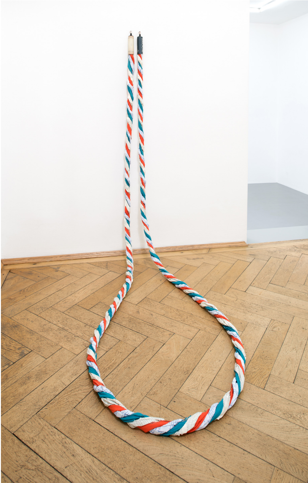
Drehbuch , 2022 Acrylic on canvas, cardboard and paper ca. 600 x 5 cm (Tripod: wood, metal ca. 70 x 30 cm)