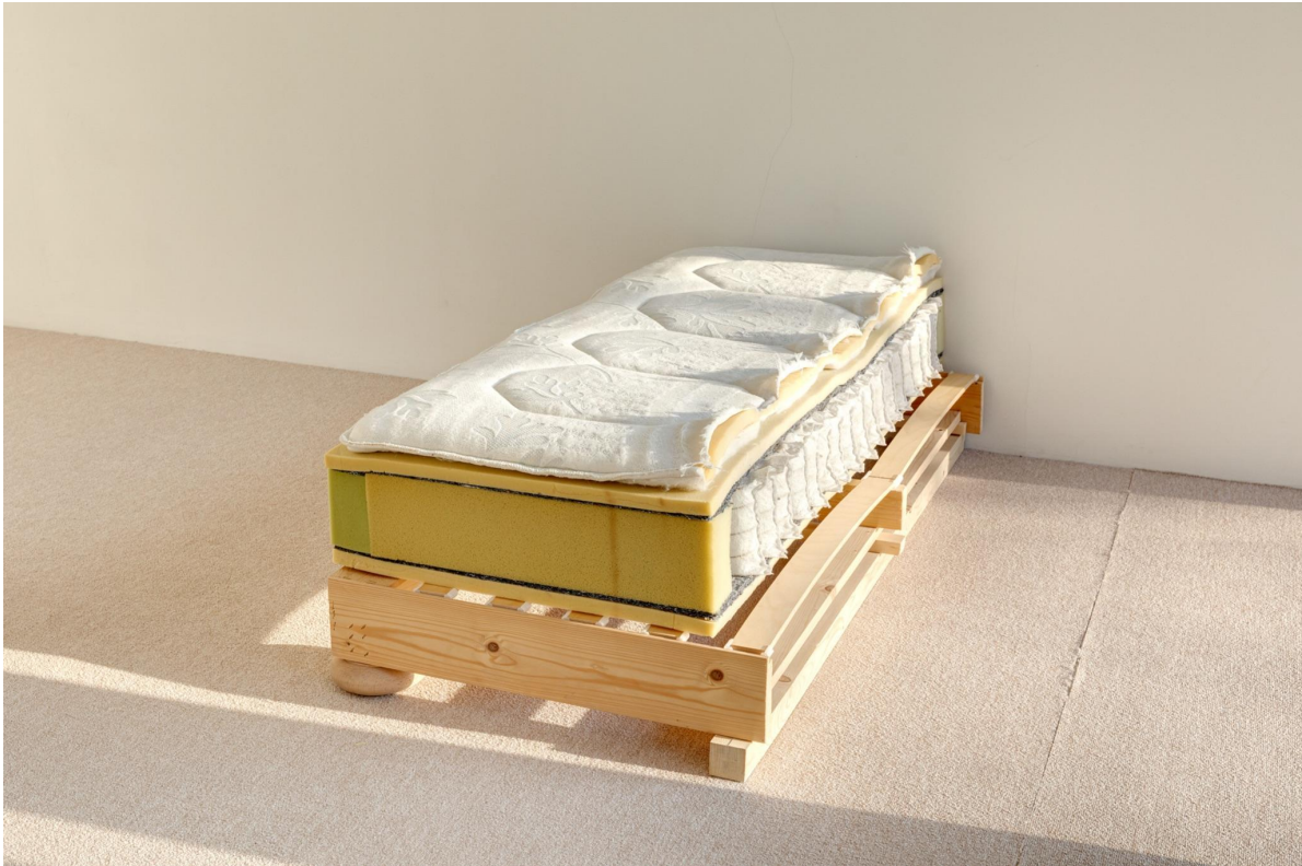
3. Victorien Soufflet, In bed with , 2020 matelas à ressorts et sommier à lattes en bois, 140 x 65 cm