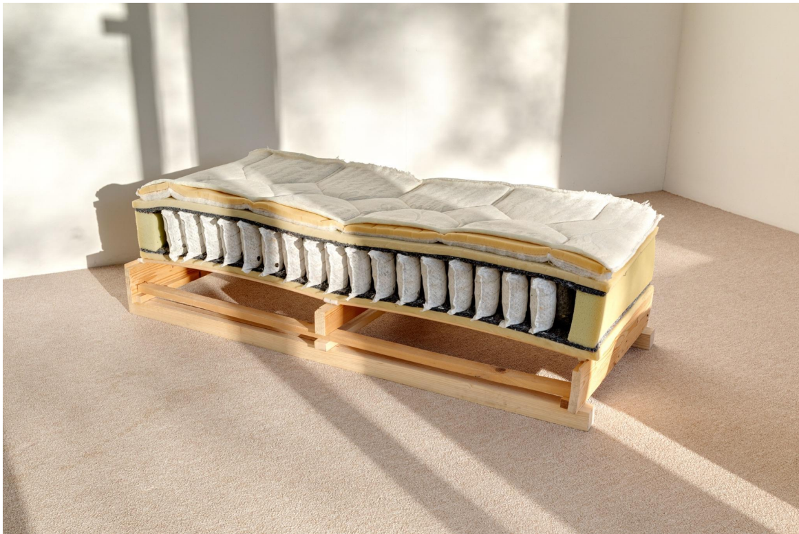
2. Victorien Soufflet, le vrai sexe , 2020 matelas à ressorts et sommier à lattes en bois, 140 x 60 cm