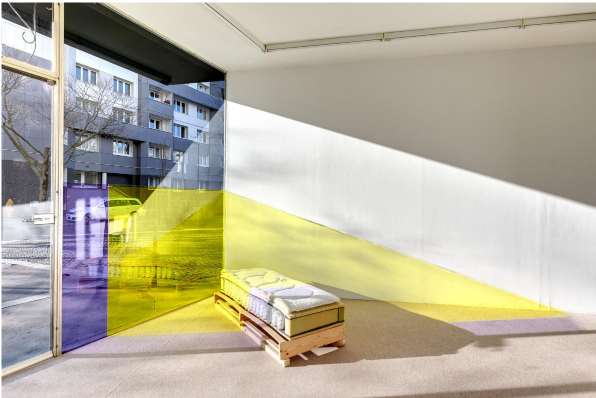
4. Victorien Soufflet, filtres de subjectivités violet jaune , 2020 PMMA, 135 x 196 cm