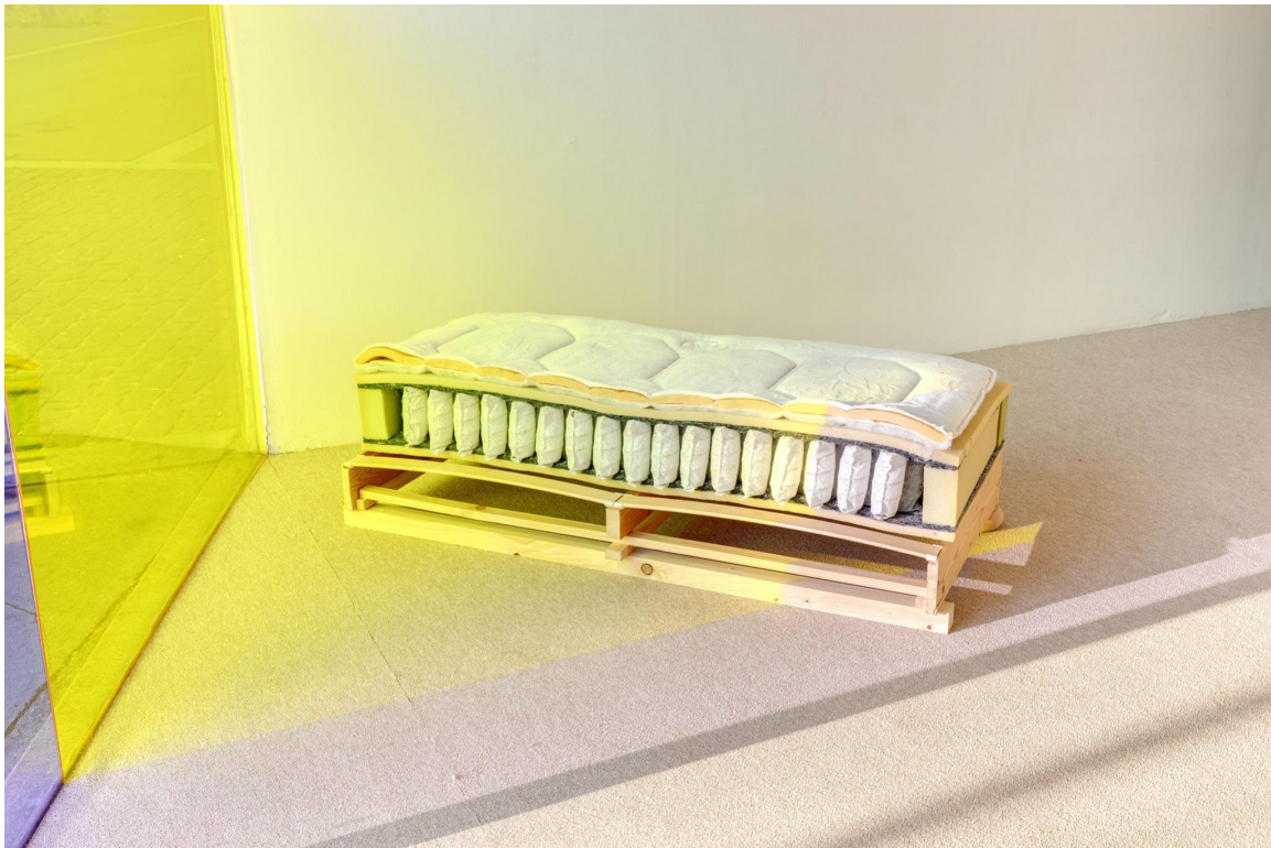
1. Victorien Soufflet, We live in a heterosexuality , 2020 matelas à ressorts et sommier à lattes en bois, 140 x 65 cm