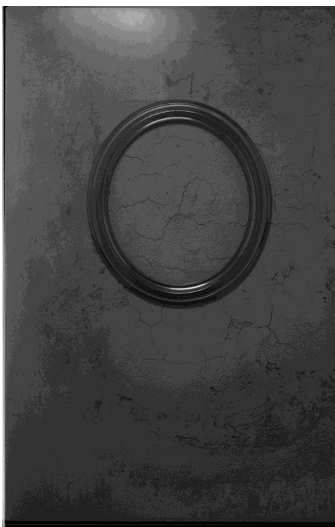
Jan Svoboda: Rámeček / Little Frame, 1968 fotografie na barytovém papíře / photograph on barita paper, 56 x 40,5 cm

Při přípravě výstavy představující novou edici Svobodových děl jsme se pokusili nalézt jeho „blížence“, jejichž díla mohou reflektovat, rozšířit i posunout zažité čtení Svobodových fotografií. Ústředním tématem výstavy je snaha budovat fotografický obraz jako autonomní plochu, adekvátně k vývoji moderního obrazu, ale také hledání hranice mezi fotografií, malbou a současným uměním. Vybraní umělci patří jak k Svobodovým generačním souputníkům a přátelům (Stanislav Kolíbal, Dalibor Chatrný, Běla Kolářová, Dušan Šimánek), k autorům s komplementární poetikou z okruhu galerie (Jan Merta, Jiří Kovanda, Jasanský/Polák), i k tvůrcům současné „postmediální“ fotografie (Jiří Thýn, Tereza Kabůrková). Do hry se Svobodovými „předobrazy“ a jejich odrazy jsme se snažili vnést fantazii, humor i možnost číst jeho umění novým, současnějším pohledem a v širších souvislostech.