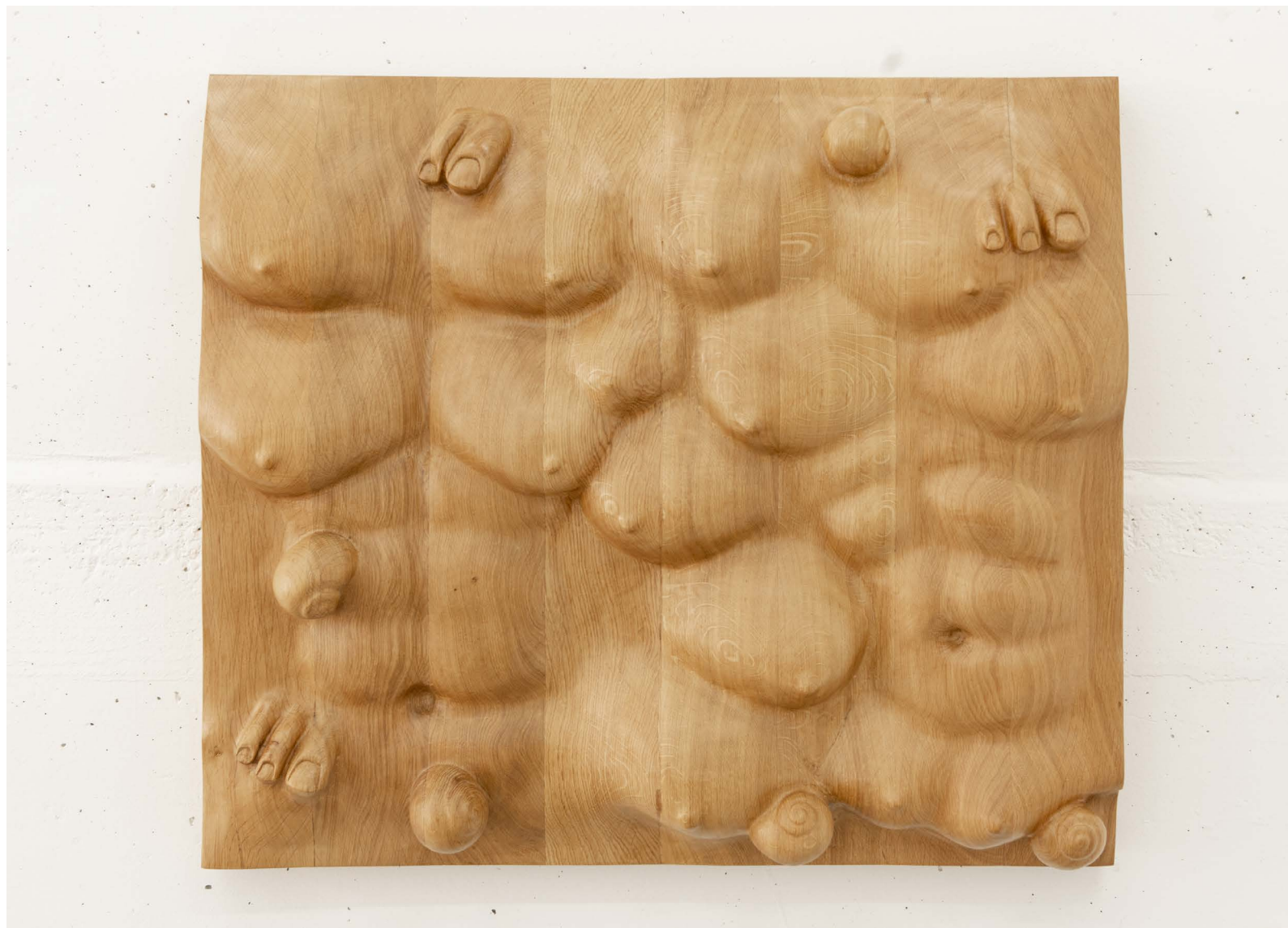
Daniel Dewar et Gregory Gicquel, Oak relief with body fragments and snails , 2019 chêne