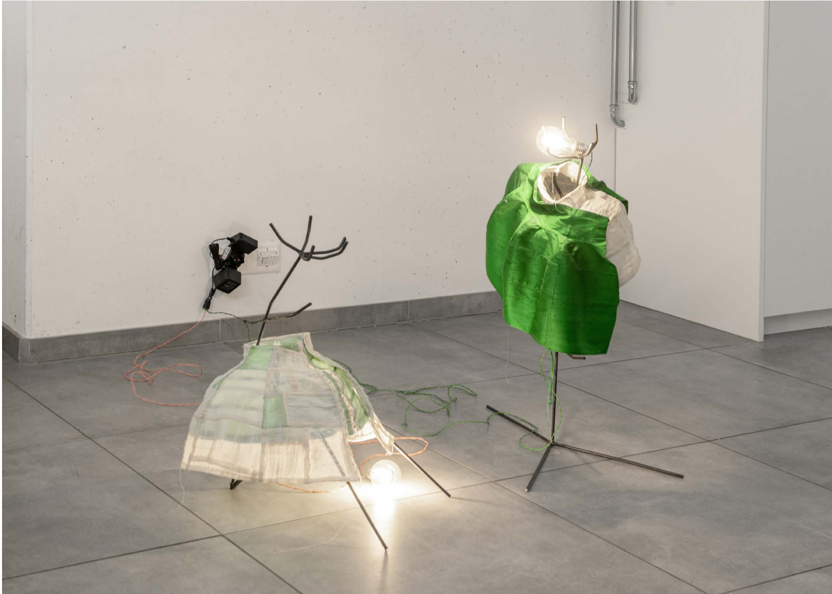
Karolin Braegger, Low-Slung Dress , 2022 and Actress I (Lamp) , 2020 ampoule, textile, acier, fil électrique