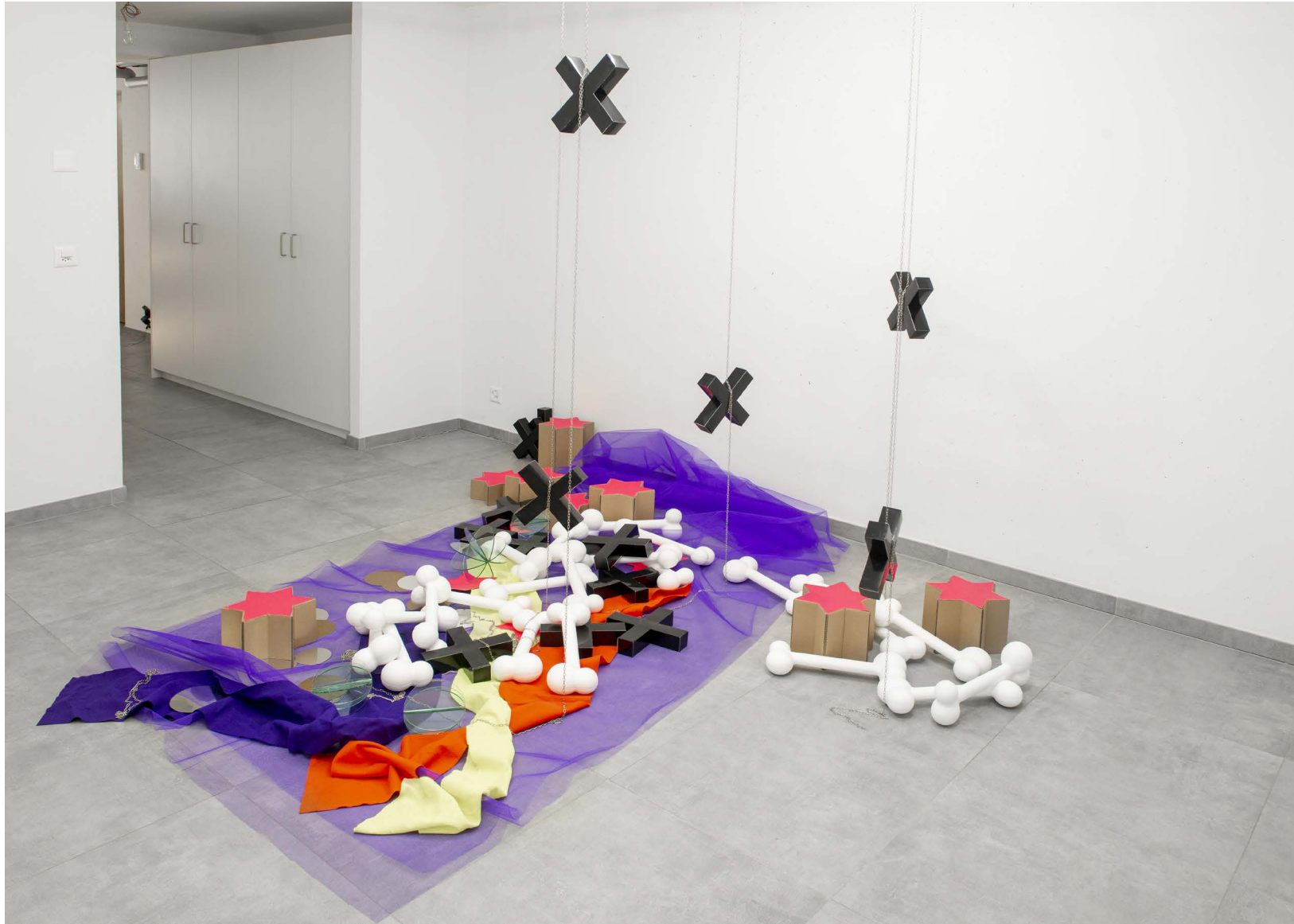
Delphine Coindet, Vide poche , 2005 polystyrène, papier, carton, plexiglas, feutre et chaînes métalliques