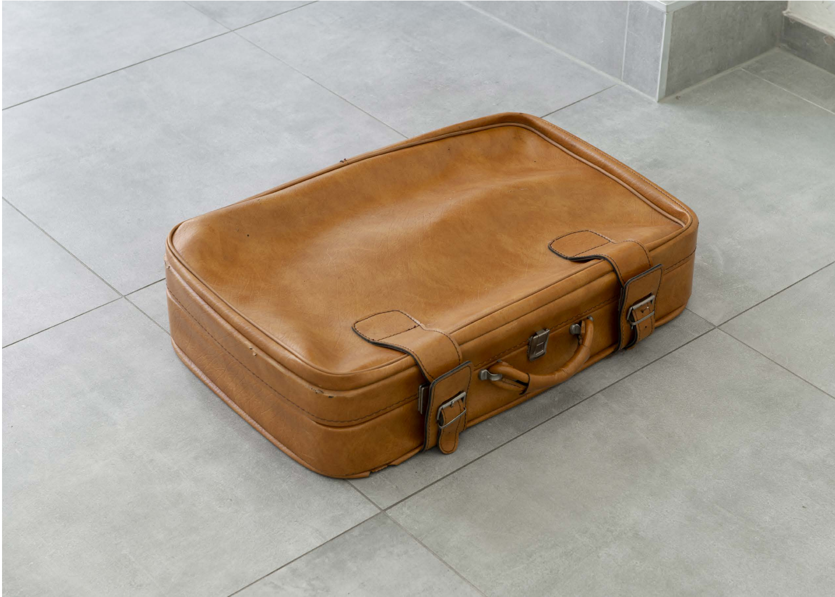
Grégoire-Cesare Marcel, Valise et moteur , 2021 valise et moteur