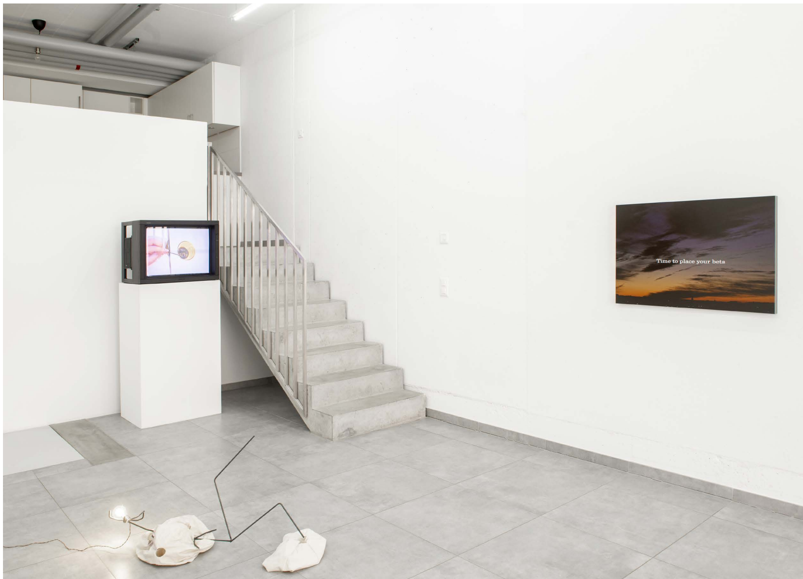
Why do we say a house burns down, when the fire is burning up ?, vue d'exposition, All Stars Lausanne.