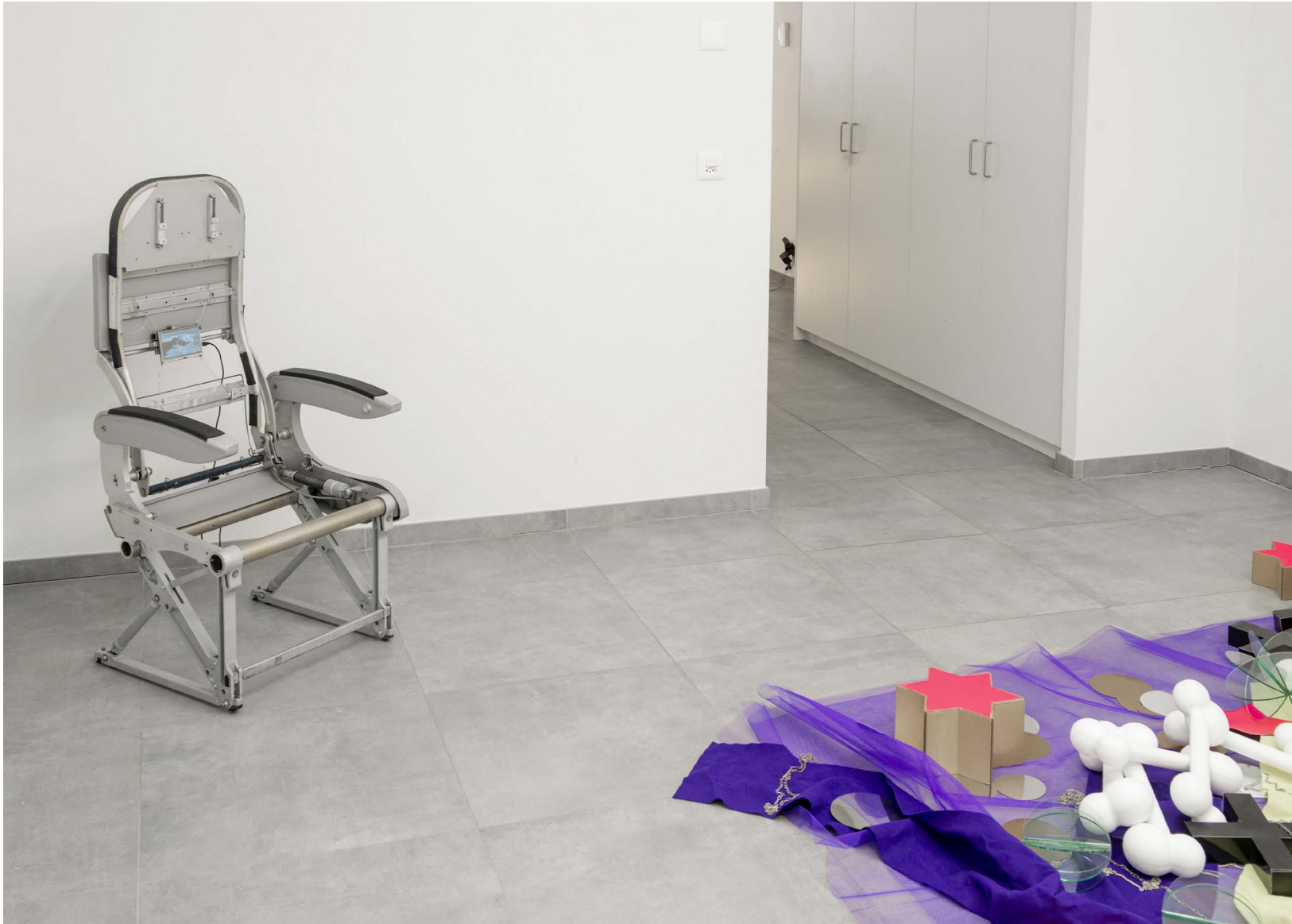
Why do we say a house burns down, when the fire is burning up ?, vue d'exposition, All Stars Lausanne.