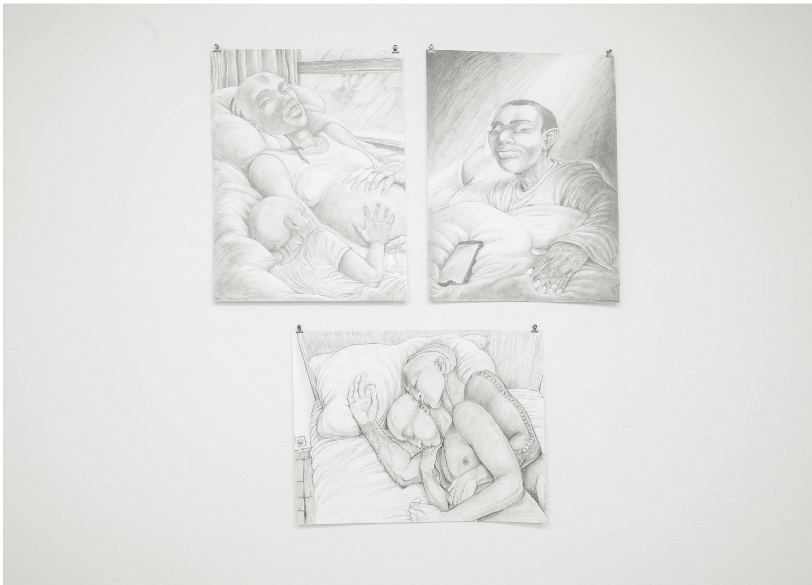
Nygel Panasco, Trois images de ma vie (Maman sacrée, Attente illusion, Repos bref) , 2022 critères, crayon