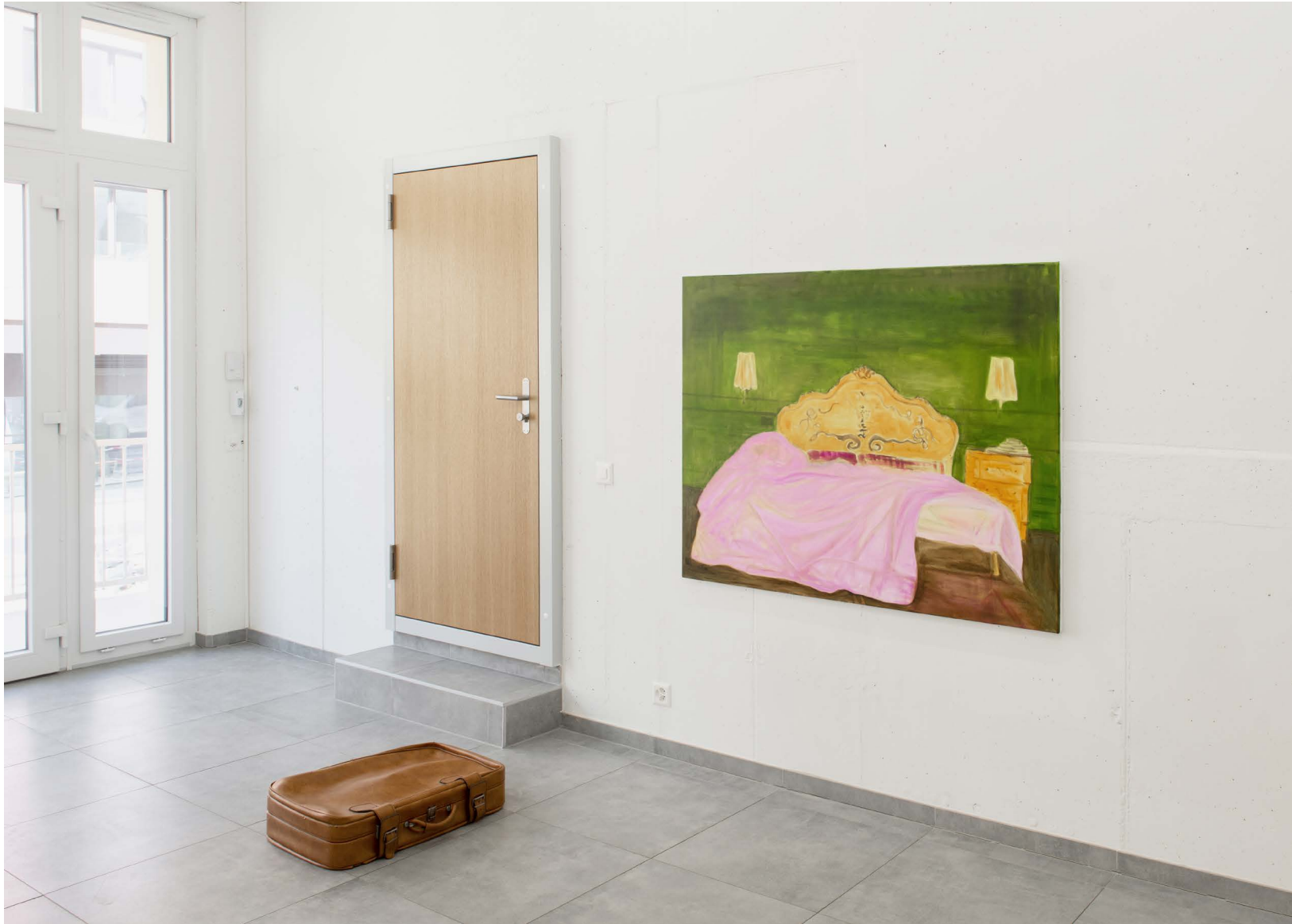
Why do we say a house burns down, when the fire is burning up ?, vue d'exposition, All Stars Lausanne.