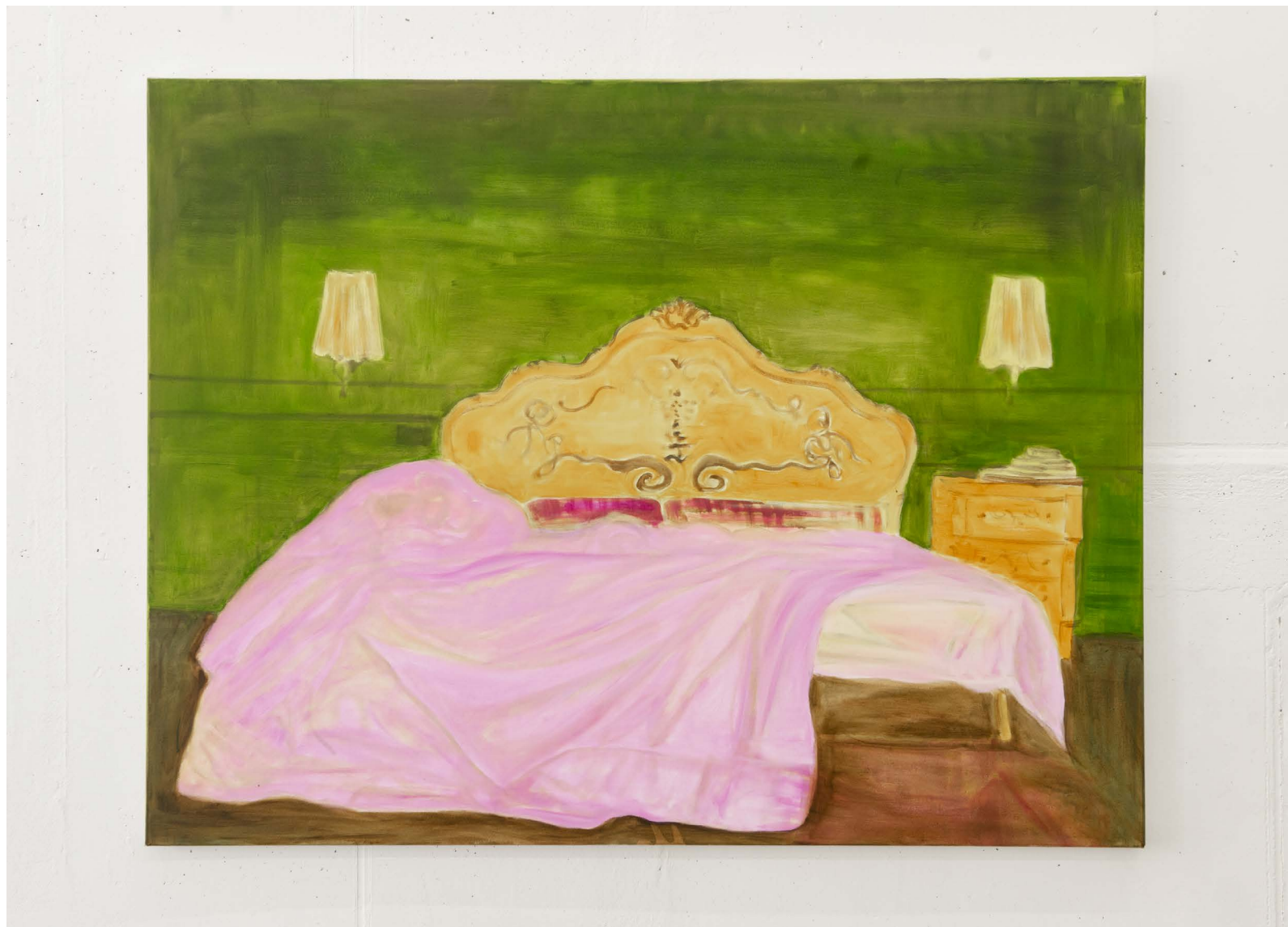
Caro Niederer, Interior Riviera , 2009 huile sur toile