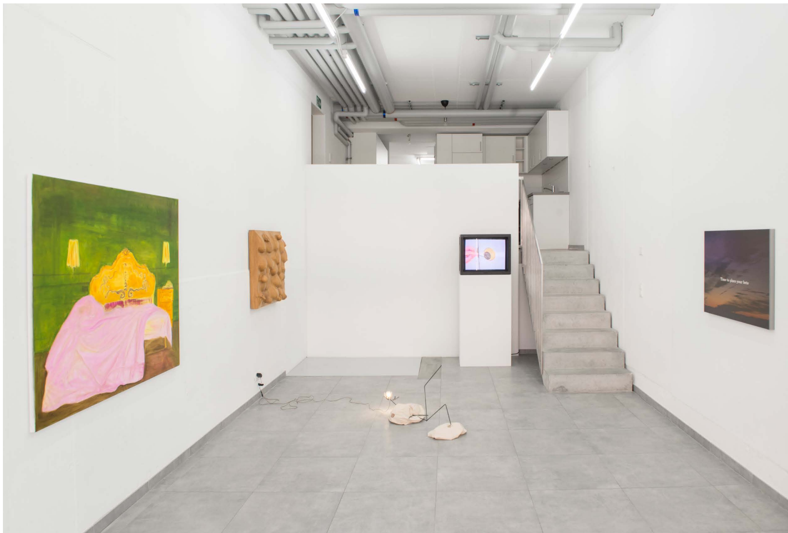
Why do we say a house burns down, when the fire is burning up ?, vue d'exposition, All Stars Lausanne.