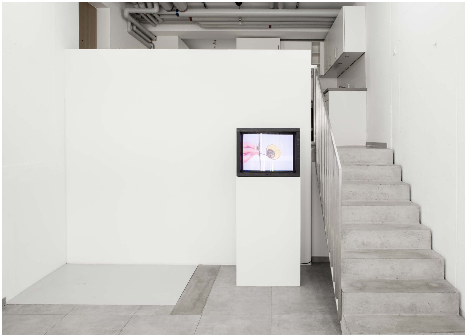
Claire Fontaine, Instructions for the sharing of, private property , 2006, vidéo numérique, couleur et son