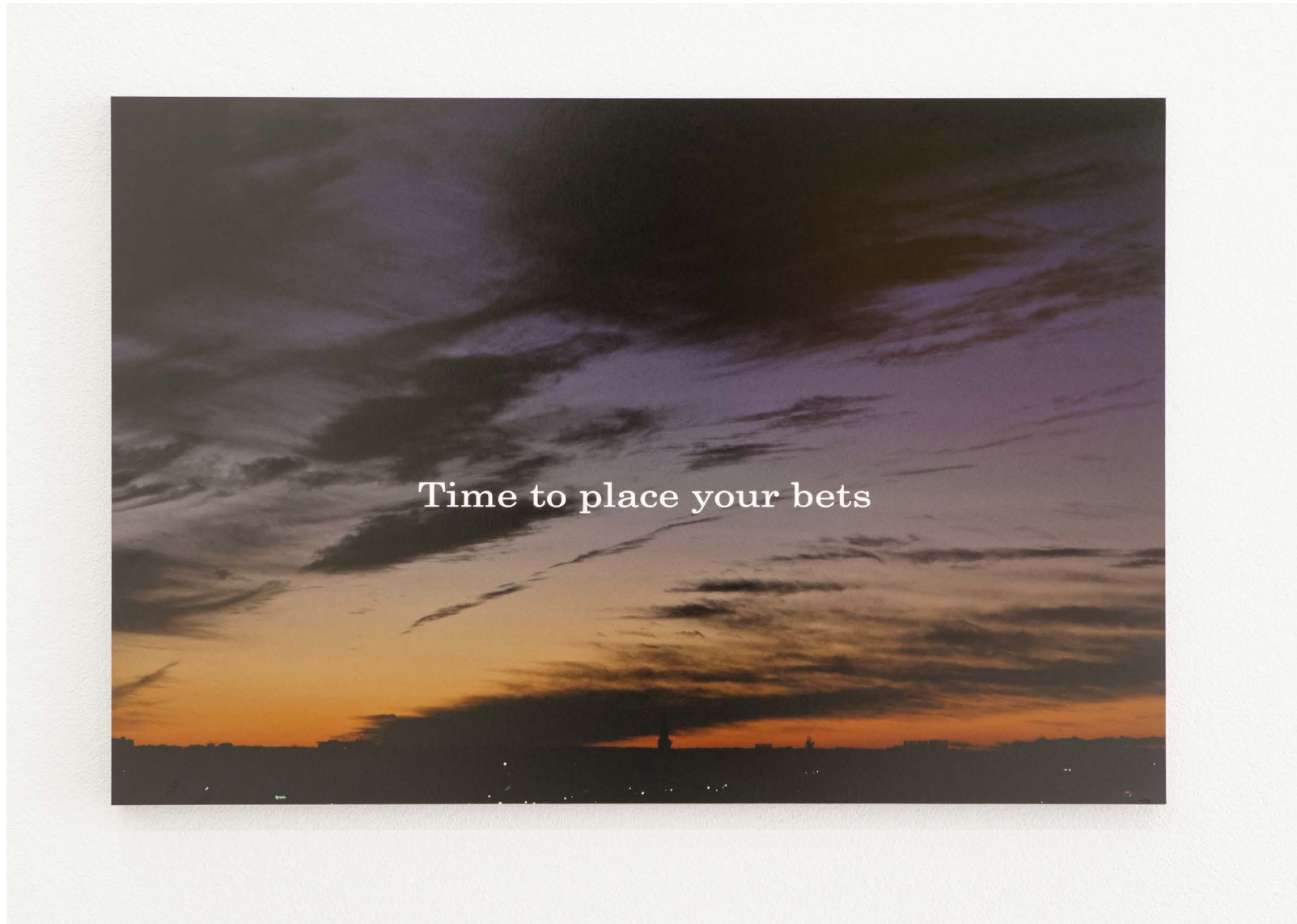
Michel Houellebecq, Inscriptions #013 (EN) , 2018 épreuve pigmentaire (2017) sur papier baryté monté sur Dibond