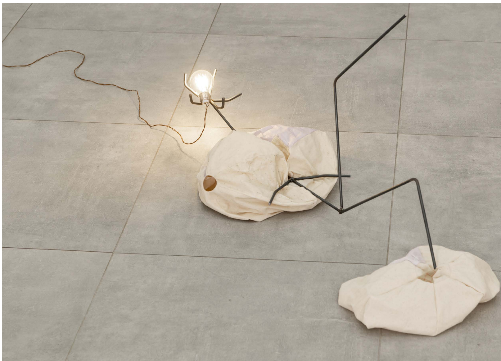
Karolin Braegger, One Skin Too Few , 2022 ampoule, textile, acier, fil électrique