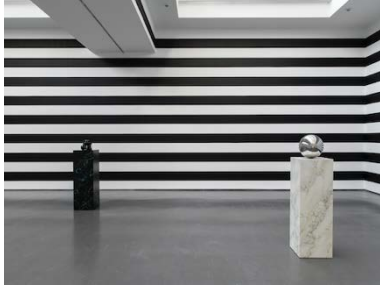
Yuki Kimura, COL SPORCAR SI TROVA , Installationsansicht Kunstverein für die Rheinlande und Westfalen, Düsseldorf, 2022