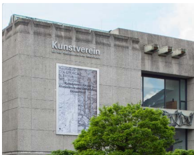
Yuki Kimura, COL SPORCAR SI TROVA , Kunstverein für die Rheinlande und Westfalen, Düsseldorf, 2022, Foto: Cedric Mussano

Grabbepplatz 4 40213 Düsseldorf T+49 (0) 211 21074 20 mail@kunstverein- duesseldorf.de