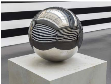
Yuki Kimura, Five Mirror Balls (2022, Detail), Stripe (2022), Installationsansicht COL SPORCAR SI TROVA , Kunstverein für die Rheinlande und Westfalen, Düsseldorf, 2022