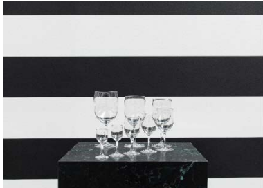
Yuki Kimura, Perfection (2022, Detail), Stripe (2022), Installationsansicht COL SPORCAR SI TROVA, Kunstverein für die Rheinlande und Westfalen, Düsseldorf, 2022