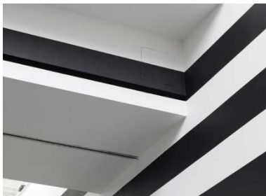
Yuki Kimura, Stripe (2022), Installationsansicht Kunstverein für die Rheinlande und Westfalen, Düsseldorf, 2022, Foto: Cedric Mussano