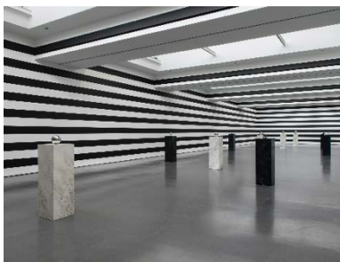
Yuki Kimura, COL SPORCAR SI TROVA , Installationsansicht Kunstverein für die Rheinlande und Westfalen, Düsseldorf, 2022, Foto: Cedric Mussano