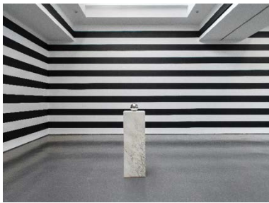
Yuki Kimura, Five Mirror Balls (2022, Detail), Stripe (2022), Installationsansicht COL SPORCAR SI TROVA, Kunstverein für die Rheinlande und Westfalen, Düsseldorf, 2022