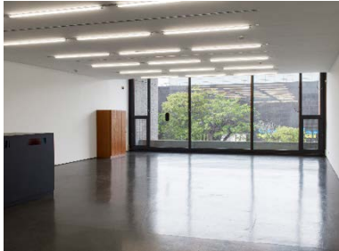
Yuki Kimura, Wardrobe Extensions Pause (2022), Installationsansicht COL SPORCAR SI TROVA , Kunstverein für die Rheinlande und Westfalen, Düsseldorf, 2022, Foto: Cedric Mussano