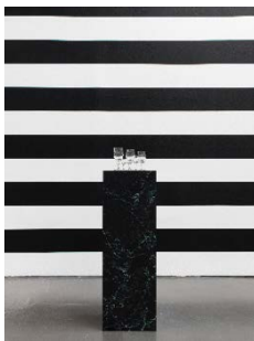
Yuki Kimura, Perfection (2022), Stripe (2022), Installationsansicht COL SPORCAR SI TROVA, Kunstverein für die Rheinlande und Westfalen, Düsseldorf, 2022