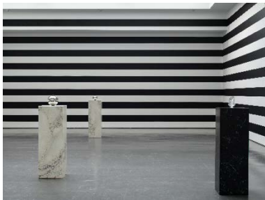
Yuki Kimura, COL SPORCAR SI TROVA , Installationsansicht Kunstverein für die Rheinlande und Westfalen, Düsseldorf, 2022, Foto: Cedric Mussano