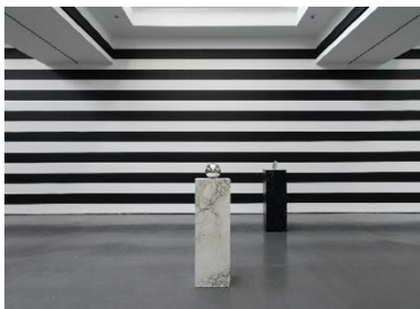
Yuki Kimura, COL SPORCAR SI TROVA , Installationsansicht Kunstverein für die Rheinlande und Westfalen, Düsseldorf, 2022