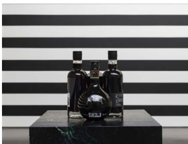
Yuki Kimura, Black Bottles I (2022, Detail), Stripe (2022), Installationsansicht COL SPORCAR SI TROVA, Kunstverein für die Rheinlande und Westfalen, Düsseldorf, 2022, Foto: Cedric Mussano