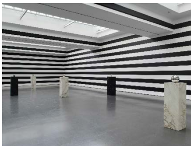
Yuki Kimura, COL SPORCAR SI TROVA , Installationsansicht Kunstverein für die Rheinlande und Westfalen, Düsseldorf, 2022, Foto: Cedric Mussano