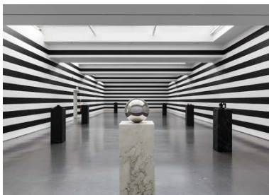
Yuki Kimura, COL SPORCAR SI TROVA , Installationsansicht Kunstverein für die Rheinlande und Westfalen, Düsseldorf, 2022, Foto: Cedric Mussano