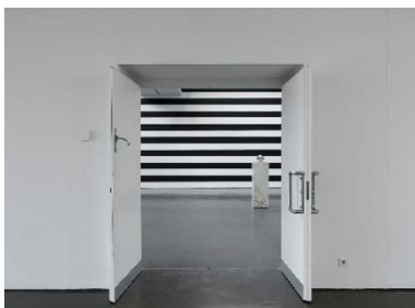
Yuki Kimura, Five Mirror Balls (2022, Detail), Stripe (2022), Installationsansicht COL SPORCAR SI TROVA, Kunstverein für die Rheinlande und Westfalen, Düsseldorf, 2022