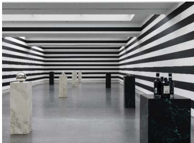
Yuki Kimura, COL SPORCAR SI TROVA , Installationsansicht Kunstverein für die Rheinlande und Westfalen, Düsseldorf, 2022