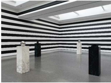
Yuki Kimura, COL SPORCAR SI TROVA , Installationsansicht Kunstverein für die Rheinlande und Westfalen, Düsseldorf, 2022