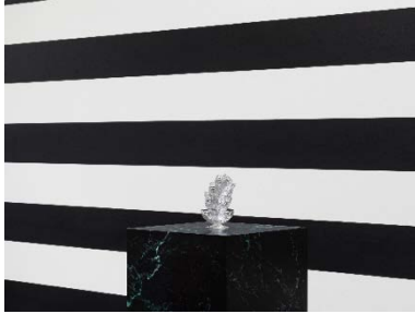
Yuki Kimura, Charms (2022, Detail), Stripe (2022) , Installationsansicht COL SPORCAR SI TROVA, Kunstverein für die Rheinlande und Westfalen, Düsseldorf, 2022