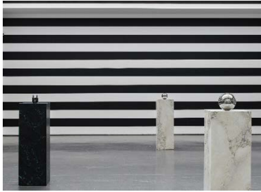
Yuki Kimura, COL SPORCAR SI TROVA , Installationsansicht Kunstverein für die Rheinlande und Westfalen, Düsseldorf, 2022, Foto: Cedric Mussano