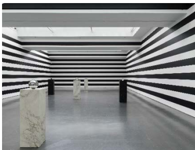
Yuki Kimura, COL SPORCAR SI TROVA , Installationsansicht Kunstverein für die Rheinlande und Westfalen, Düsseldorf, 2022, Foto: Cedric Mussano