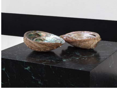
Yuki Kimura, Abalones (2022, Detail), Stripe (2022), Installationsansicht COL SPORCAR SI TROVA, Kunstverein für die Rheinlande und Westfalen, Düsseldorf, 2022, Foto: Cedric Mussano