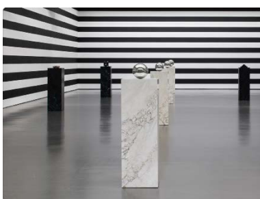
Yuki Kimura, COL SPORCAR SI TROVA , Installationsansicht Kunstverein für die Rheinlande und Westfalen, Düsseldorf, 2022, Foto: Cedric Mussano