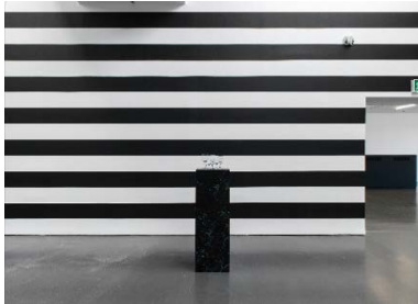
Yuki Kimura, Perfection (2022), Stripe (2022), Installationsansicht COL SPORCAR SI TROVA, Kunstverein für die Rheinlande und Westfalen, Düsseldorf, 2022