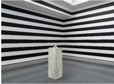
Yuki Kimura, Five Mirror Balls (2022, Detail), Stripe (2022), Installationsansicht COL SPORCAR SI TROVA, Kunstverein für die Rheinlande und Westfalen, Düsseldorf, 2022