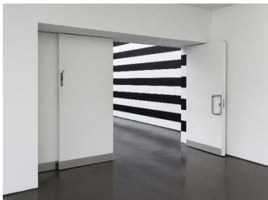
Yuki Kimura, Stripe (2022), Installationsansicht Kunstverein für die Rheinlande und Westfalen, Düsseldorf, 2022, Foto: Cedric Mussano