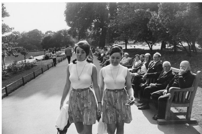
ゲイリー・ウィノグラッド