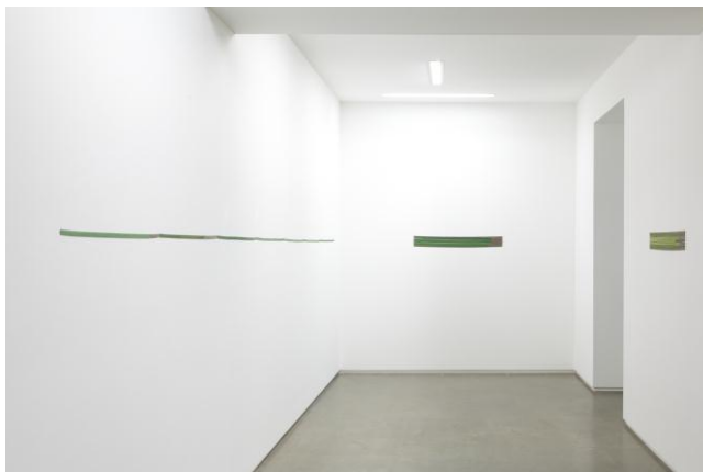
ヘレン・ミラ 「Hourly directional field notation, Bretagne」 展示 風景 タカ・イシイギャラリー東京 2012年11月10日 - 12月8日