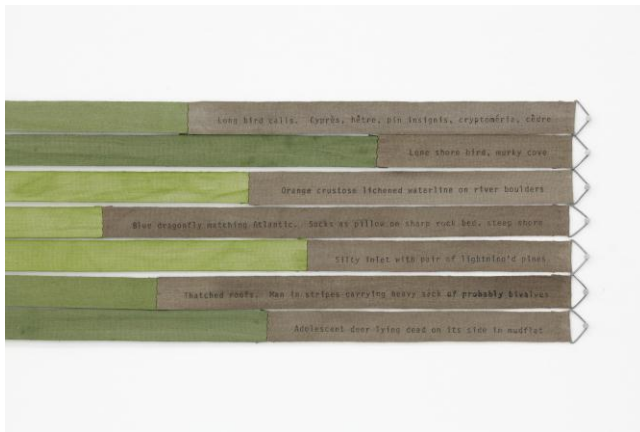
ヘレン・ミラ 「Hourly directional field notation, Bretagne」 展示 風景 タカ・イシイギャラリー東京 2012年11月10日 - 12月8日