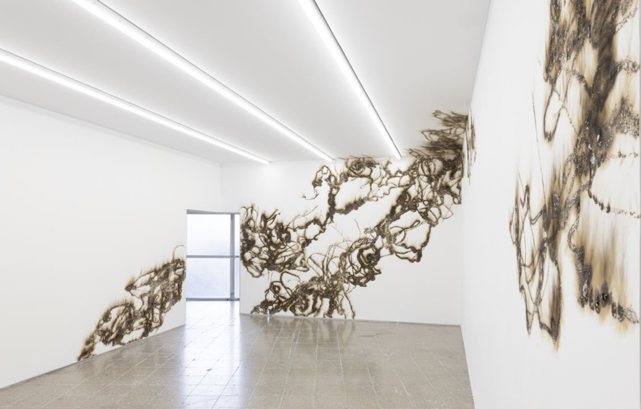
Cristina Spinelli, ~folus~ (2022) Fuego sobre pared Dimensiones variables