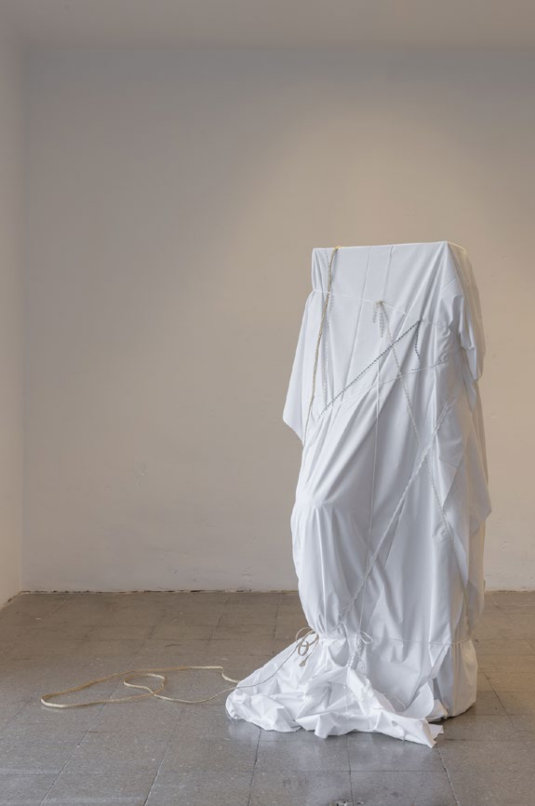
Cristina Spinelli , secreto azul (nosotras con tus geranios) (2022) Antigua escultura, material de embalaje, tela, pasamanería, cuerda de polipropileno, cinta de paja de maíz natural 196 × 110 × 90 cm