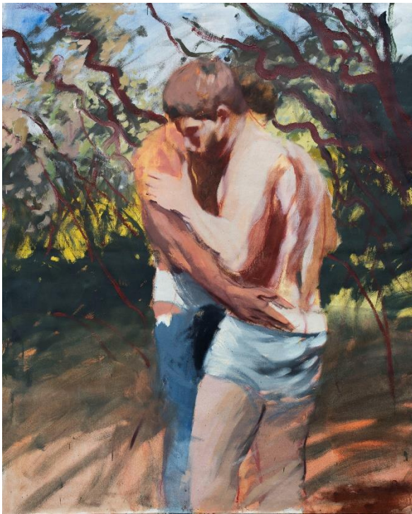
Untitled , 2022, Öl auf Leinwand, 200 x 160 cm

Mit Almost Blue präsentiert der Kunstverein Braunschweig, die erste institutionelle Einzelausstellung von João Gabriel (*1992 in Leiria, Portugal). In den neuen Werken setzt sich der Künstler mit queeren Begehren, Intimität, Cruising, mentalen und realen Landschaften auseinander. Malerisch verarbeitet er erlebte und ersehnte Eindrücke von portugiesischen Stränden, von seiner Umgebung auf dem portugiesischen Land sowie von Pornofilmen des „queer