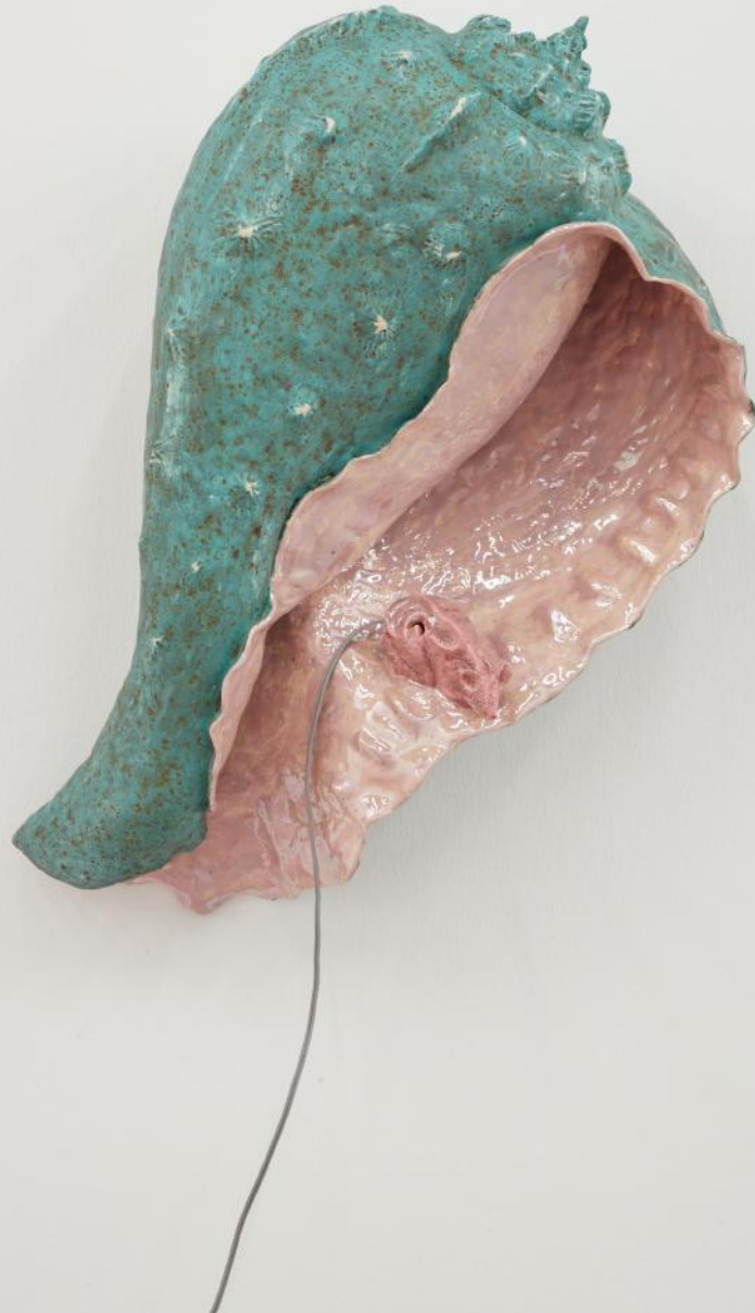
Gerrit Frohne-Brinkmann Earmouse (in seashell VI) , 2022 Glasierte Keramik, Kabel, Silikon, Lautsprecher, Verstärker, Sounddatei 62 × 47 × 23 cm