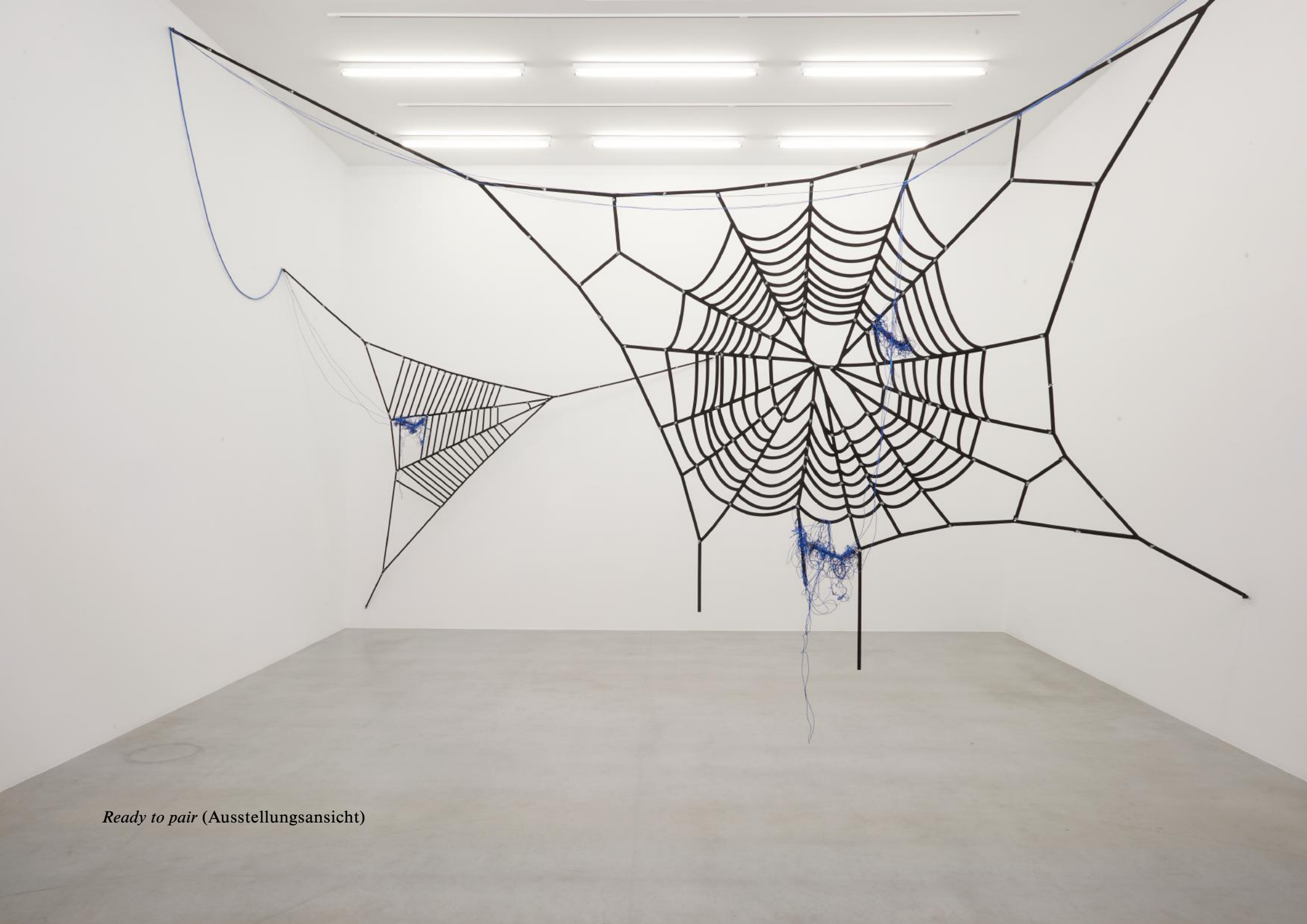
Ready to pair (Ausstellungsansicht)