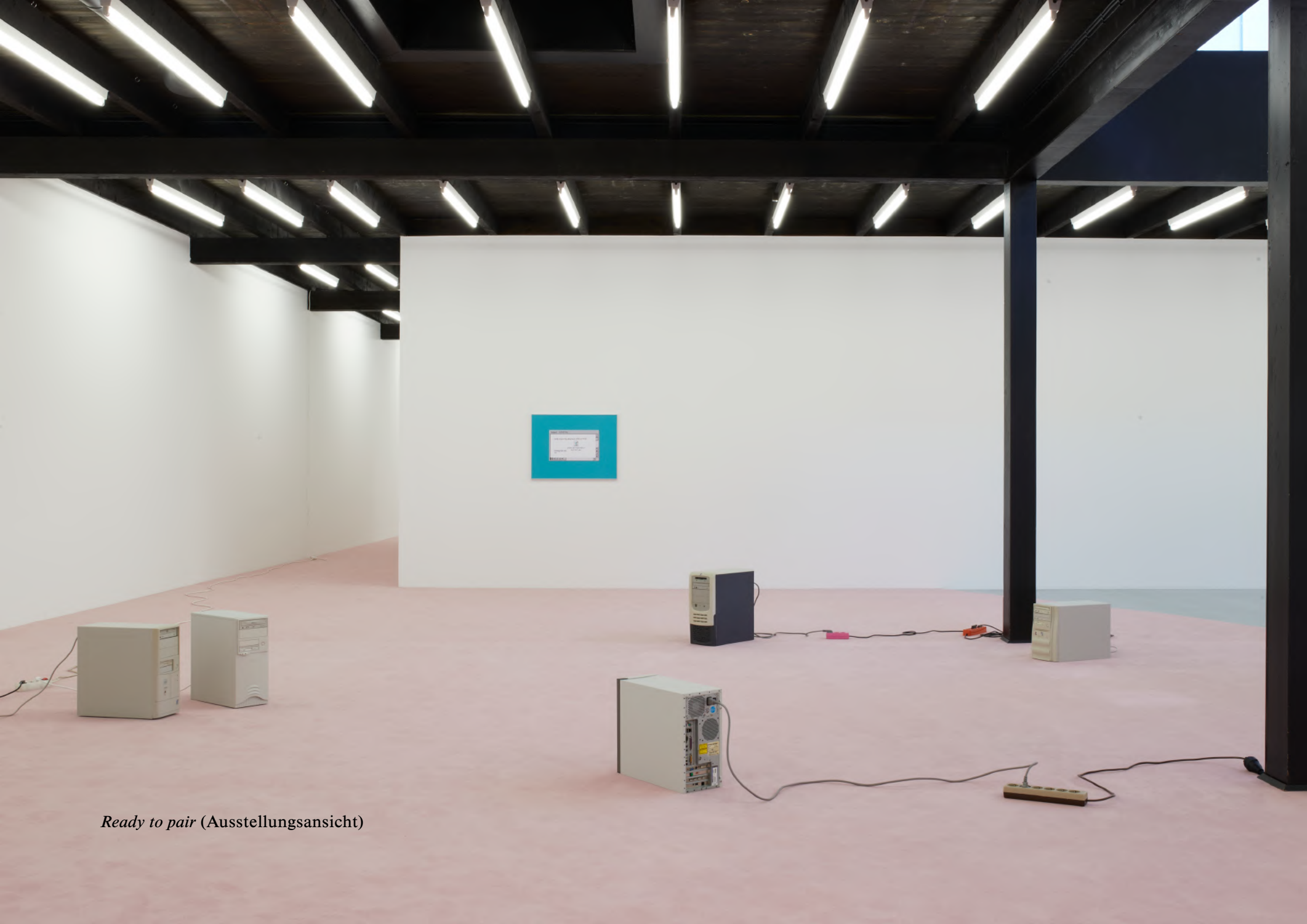
Ready to pair (Ausstellungsansicht)