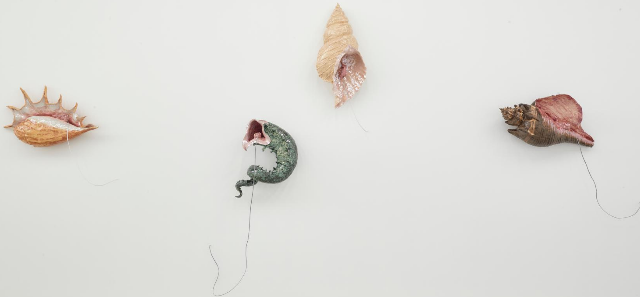
Ready to pair (Ausstellungsansicht)