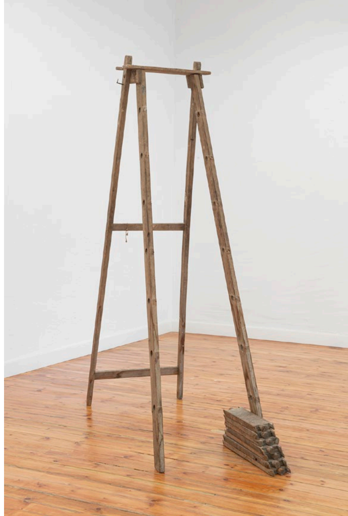
Joan Brossa' Feina de dissabte' (1986)

La selecció d'objectes que conformen aquesta presentació il·lustra aquest pensament revolucionari. Sense concessions ni missatges ocults, les peces es presenten en la seva diàfana plenitud, tal com van ser concebudes. Aquestes obres, presentades originalment a Alemanya, han romàs allí durant més de 30 anys, sent exposades puntualment en les grans retrospectives de Brossa. La pel·lícula de Pere Portabella No compteu amb els dits (1967), amb guió de Brossa, assumeix aquesta dualitat a través del llenguatge publicitari, com reflecteix la primera frase del film "derrotat..., però no vençut".