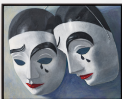
Oskar Schmidt Zwei Masken, 2022 Oil and egg tempera on wooden panel 40 × 50 cm

For further information please contact the gallery: info@tobiasnaehring.de or +49 (0) 177 227 63 57