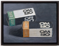
Oskar Schmidt Stilleben mit OR- WO-Schwarzweiß-Filmen (VEB Fotochemisches Kombinat Wolfen), 2022 Oil and egg tempera on wooden panel 15 × 20 cm