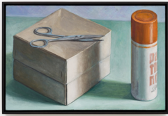
Oskar Schmidt Stilleben mit Karton, Schere und Panthenol-Spray (VEB Ankerwerk Rudolstadt), 2021/22 Oil and egg tempera on wooden panel 25,5 × 39 cm