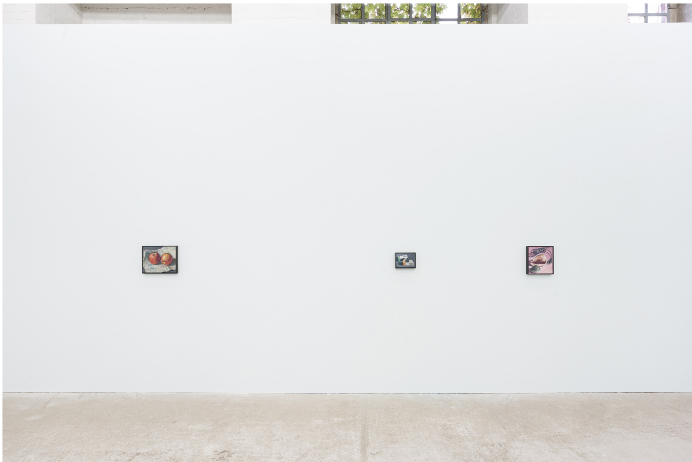
Installation view: Oskar Schmidt, Paintings from the Cold , September 17 – October 29, 2022 Galerie Tobias Naehring, Leipzig