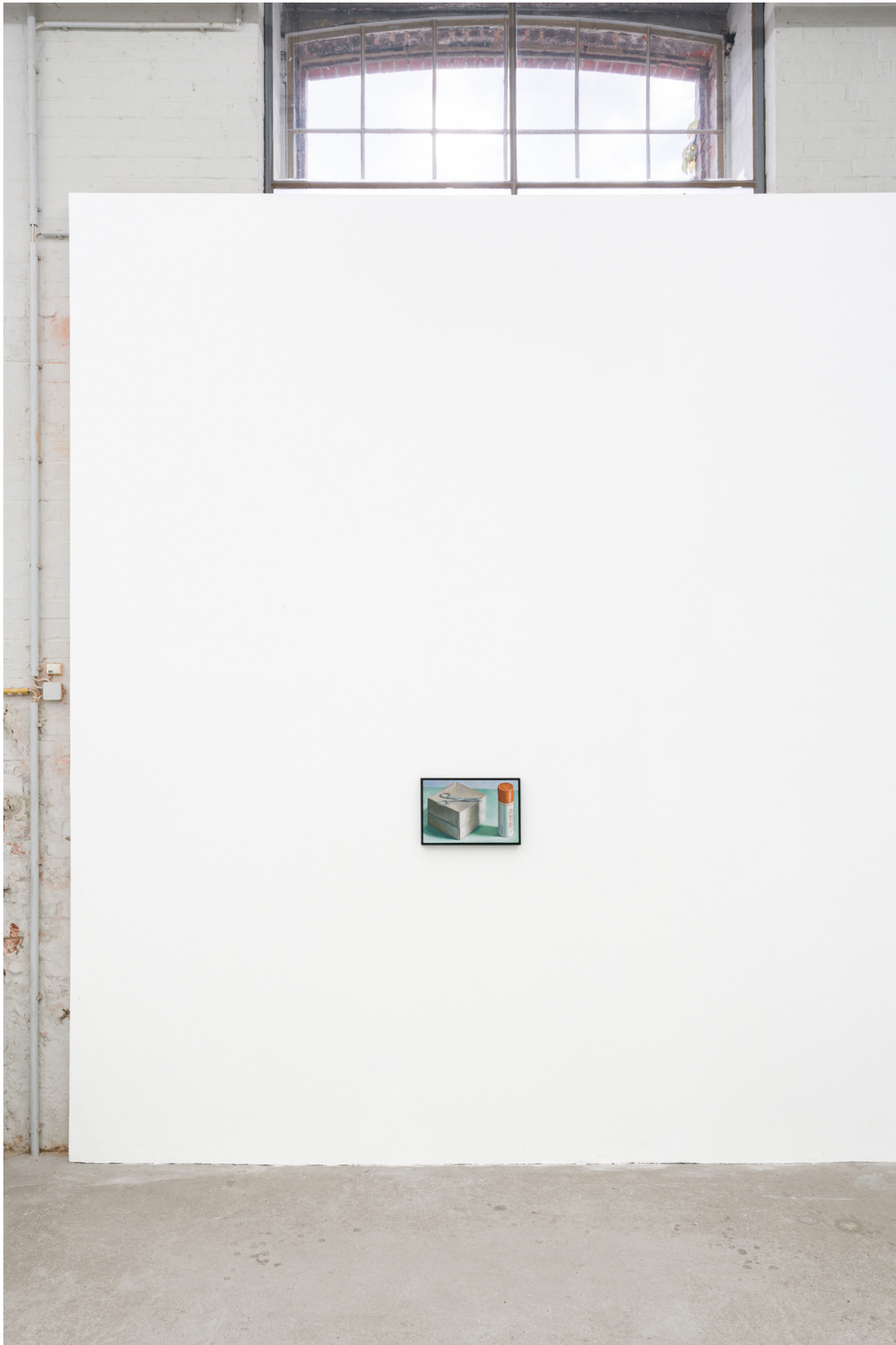
Installation view: Oskar Schmidt, Paintings from the Cold , September 17 – October 29, 2022 Galerie Tobias Naehring, Leipzig