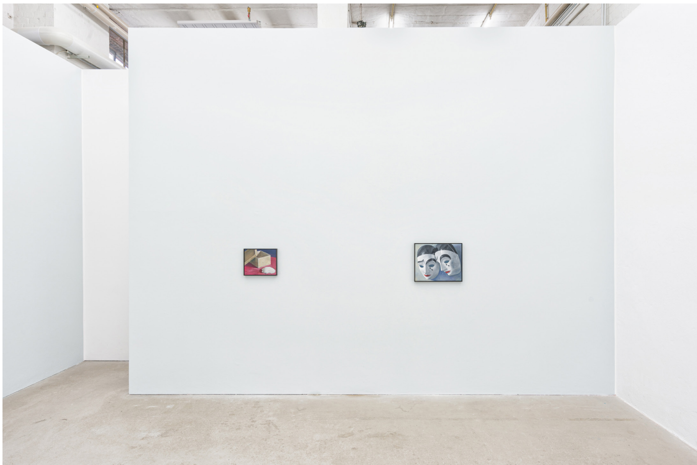
Installation view: Oskar Schmidt, Paintings from the Cold , September 17 – October 29, 2022 Galerie Tobias Naehring, Leipzig