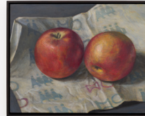
Oskar Schmidt Äpfel auf HO-Papier, 2022 Oil and egg tempera on wooden panel 28 × 35,5 cm