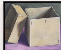
Oskar Schmidt Stilleben mit Karton, 2021/22 Oil and egg tempera on wooden panel 25 × 30 cm