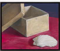
Oskar Schmidt Stilleben mit Karton und Muschel, 2022 Oil and egg tempera on wooden panel 27,5 × 34,5 cm