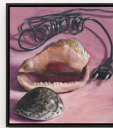
Oskar Schmidt Stilleben mit zwei Muscheln und Elektrokabel, 2022 Oil and egg tempera on wooden panel 25,5 × 28,5 cm