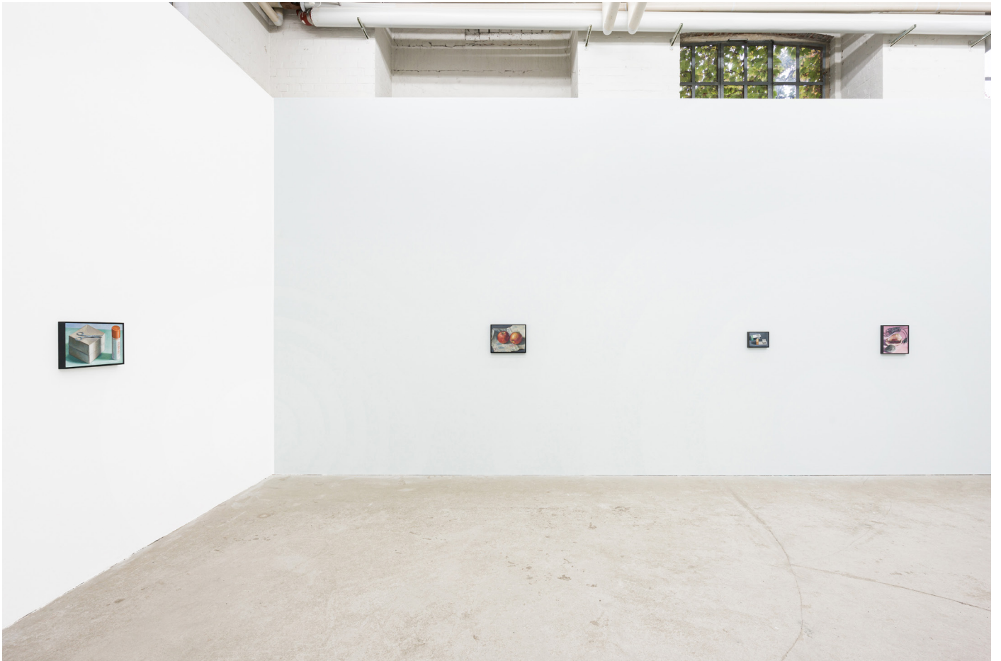
Installation view: Oskar Schmidt, Paintings from the Cold , September 17 – October 29, 2022 Galerie Tobias Naehring, Leipzig