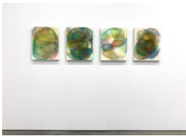
Luce Meunier Les cycles de l'eau (fusion) (groupe), 2021 Acrylique sur toile de coton Acrylic on cotton canvas 4 pièces / 4 pieces 51 x 41 cm (20 x 16") chacun/each