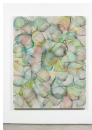
Luce Meunier Fonte no. 3, 2022 Acrylique sur toile de coton Acrylic on cotton canvas 178 x 142 cm. (70 x 56 in.)