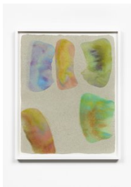
Luce Meunier Mousse no. 5, 2022 Mousse d'acrylique sur papier de toile de coton recyclée fait à la main / Acrylic paint foam on handmade recycled cotton canvas paper 56 x 46 cm. (22 x 18 in.)