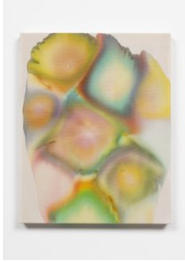
Luce Meunier Les cycles de l'eau (fusion) no. 4, 2021 Acrylique sur toile de coton Acrylic on cotton canvas 51 x 41 cm. (20 x 16 in.)