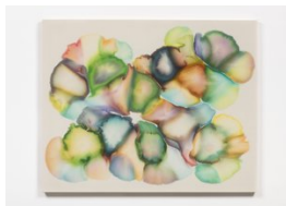
Luce Meunier Dégel no. 6, 2022 Acrylique sur toile de coton Acrylic on cotton canvas 114 x 142 cm. (45 x 56 in.)