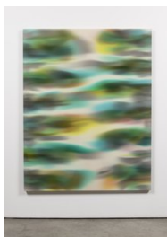
Luce Meunier Eau courante no. 9, 2022 Acrylique sur toile de coton Acrylic on cotton canvas 178 x 142 cm. (70 x 56 in.)