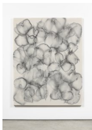
Luce Meunier Eau fossile no. 4, 2022 Acrylique sur toile de coton Acrylic on cotton canvas 178 x 142 cm. (70 x 56 in.)