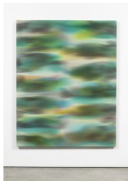
Luce Meunier Eau courante no. 8, 2022 Acrylique sur toile de coton Acrylic on cotton canvas 178 x 142 cm. (70 x 56 in.)