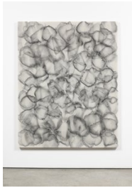
Luce Meunier Eau fossile no. 5, 2022 Acrylique sur toile de coton Acrylic on cotton canvas 178 x 142 cm. (70 x 56 in.)