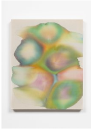
Luce Meunier Les cycles de l'eau (fusion) no. 5, 2021 Acrylique sur toile de coton Acrylic on cotton canvas 51 x 41 cm. (20 x 16 in.)