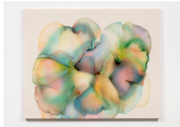
Luce Meunier Les cycles de l'eau (fusion) no. 2, 2021 Acrylique sur toile de coton Acrylic on cotton canvas 114 x 142 cm. (45 x 56 in.)