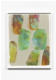
Luce Meunier Mousse no. 4, 2022 Mousse d'acrylique sur papier de toile de coton recyclée fait à la main / Acrylic paint foam on handmade recycled cotton canvas paper 56 x 46 cm. (22 x 18 in.)