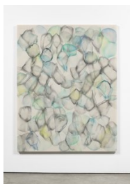
Luce Meunier Fonte no. 2, 2022 Acrylique sur toile de coton Acrylic on cotton canvas 178 x 142 cm. (70 x 56 in.)