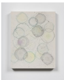
Luce Meunier Point de rosée 7, 2020 Acrylique sur toile de coton Acrylic on cotton canvas 46 x 36 cm (18 x 14 in.)