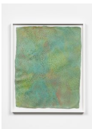
Luce Meunier Écume no. 2, 2022 Mousse d'acrylique sur papier de toile de coton recyclée fait à la main / Acrylic paint foam on handmade recycled cotton canvas paper 56 x 46 cm. (22 x 18 in.)