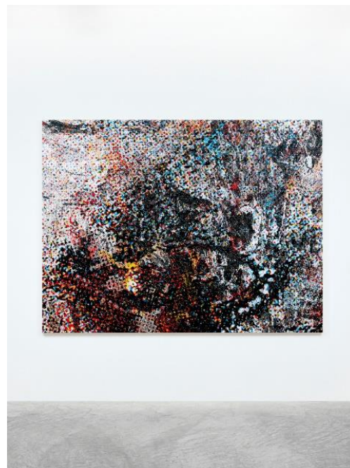
Makoto Saito 「Face Landscape 2021_02」 2020-21 Oil on canvas 163 x 215 cm © Makoto Saito