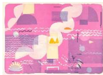
CHARLOTTE HERZIG _Love_ (miniature) , 2022 Lithografie, Stempel, Aquarell, 74 x 101,5 cm Produktion: Thomi Wolfensberger Zürich Auflage: 25 Preis: CHF 960.- Rahmen: CHF 680.-