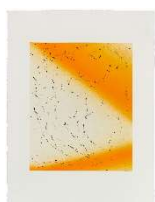
IZIDORA I LETHE SEVERAL/GLOW (x) (2022) Monotypie, Strichätzung, Kaltnadel, 76 x 56 cm Produktion: Arno Hassler, Moutier Auflage: 12 Preis: CHF 580.- Rahmen: CHF 410.-