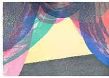
ULLA VON BRANDENBURG Scène , 2022 Lithografie, 70 x 100 cm Produktion: Thomi Wolfensberger Zürich Auflage: 25 Preis: CHF 960.- Rahmen: CHF 680.-