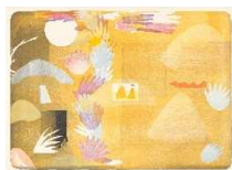
CHARLOTTE HERZIG Light Fast (miniature) , 2022 Lithografie, Stempel, Aquarell, 74 x 101,5 cm Produktion: Thomi Wolfensberger Zürich Auflage: 25 Preis: CHF 960.- Rahmen: CHF 680.-