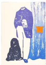
ULLA VON BRANDENBURG Magicien , 2022 Lithografie, 100 x 70 cm Produktion: Thomi Wolfensberger Zürich Auflage: 25 Preis: CHF 960.- Rahmen: CHF 680.-