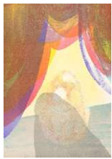
ULLA VON BRANDENBURG Scène avec ombre , 2022 Lithografie, 100 x 70 cm Produktion: Thomi Wolfensberger Zürich Auflage: 25 Preis: CHF 960.- Rahmen: CHF 680.-