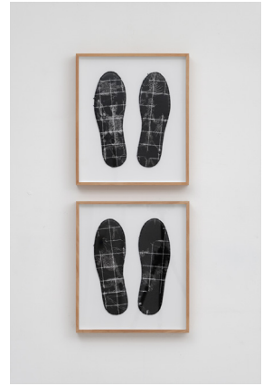
Pedro Valdez Cardoso, Promenade au désert , 2022 (détail)