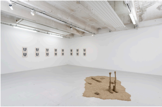
Pedro Valdez Cardoso, Debaixo da Areia , 2022 Plastique, tissu, bois et sable

mentions obligatoires : vue de l'exposition Chasseurs de Tempêtes , 2022 - Passerelle Centre d'art contemporain, Brest