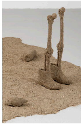
Pedro Valdez Cardoso, Debaixo da Areia , 2022