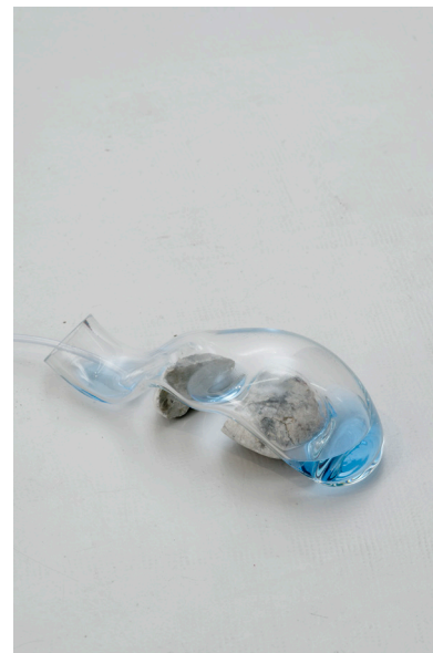
Paulo Arraiano, Coming From Water , 2019 (détail) Verre, corail, eau, pigment, tube de silicone