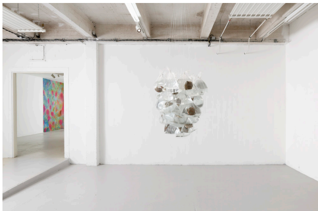
Rebecca Brueder, Briquomeres , 2020 Brique, mortier, sacs en plastique, eau, fil de nylon