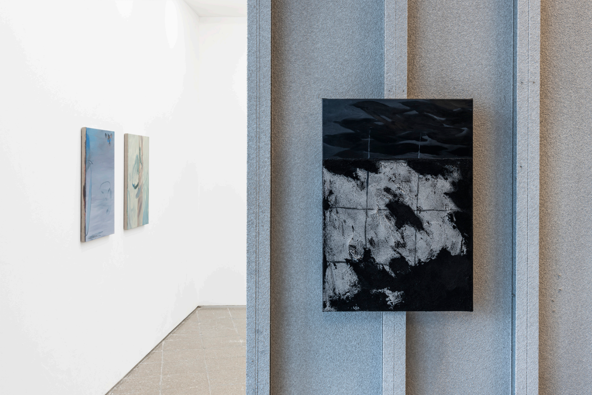
Avery Z. Nelson, Where are the birds (2022)