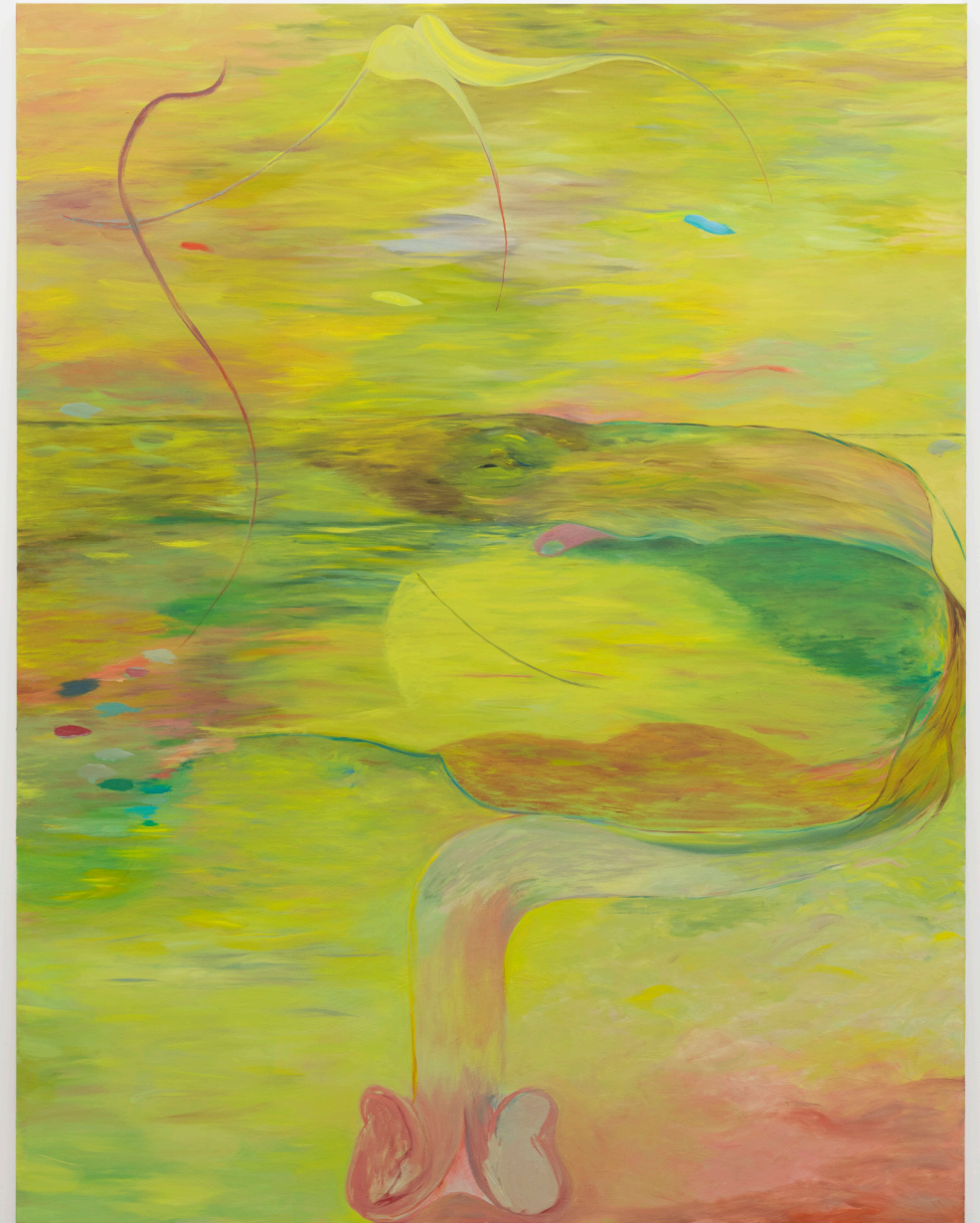
Avery Z. Nelson, Pitcher #1 (2022)

A més, hi ha 6 quadres més petits, cadascun dels quals ofereix un moment poètic de pausa: I Desire , Escape , Good Catch , Where are the birds , Flight , Cruising .