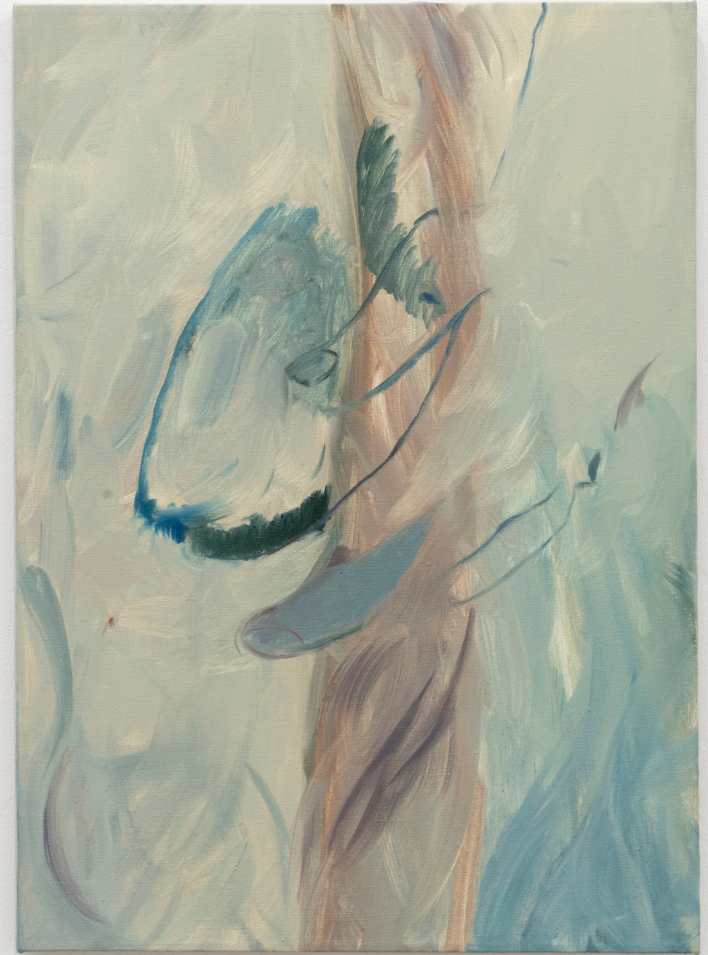
Avery Z. Nelson, I desire (2022)