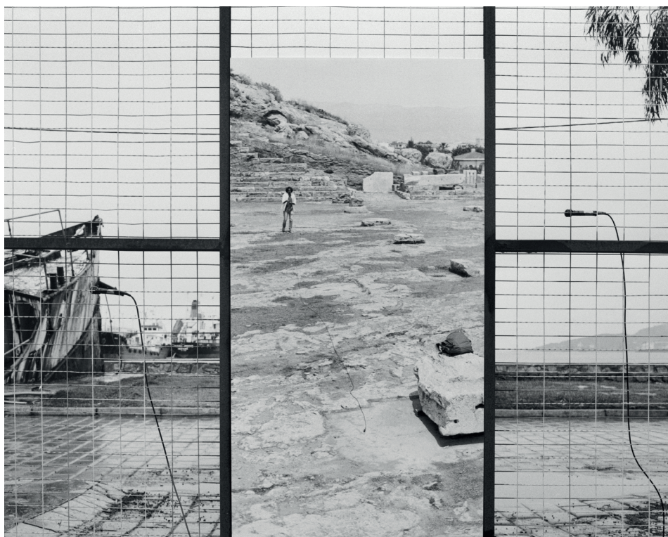
Alexandre Guiringer, Waters' Witness collage, 2022