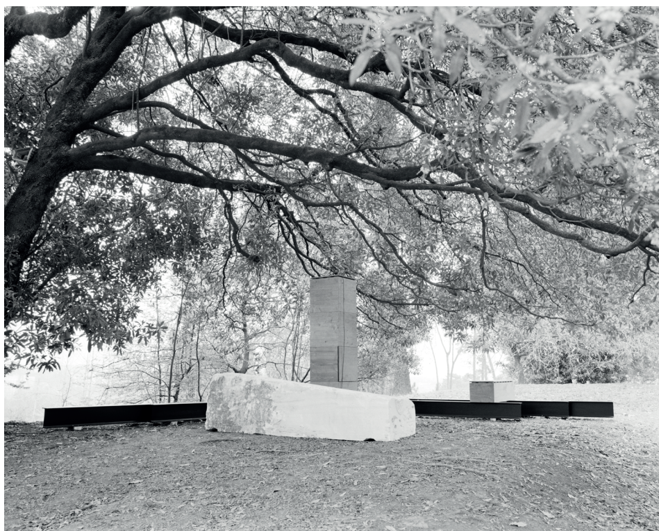
Tarek Atoui, Waters' Witness Installation view at the Serralves Museum of Contemporary Art, Porto, 2022