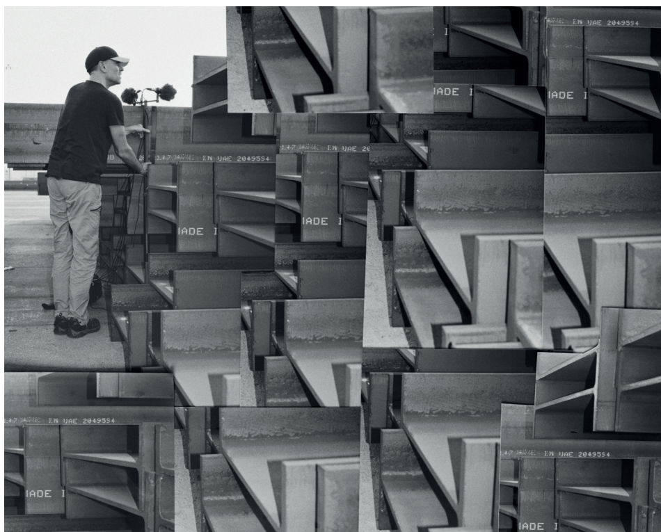
Alexandre Guiringer, Waters' Witness collage, 2022