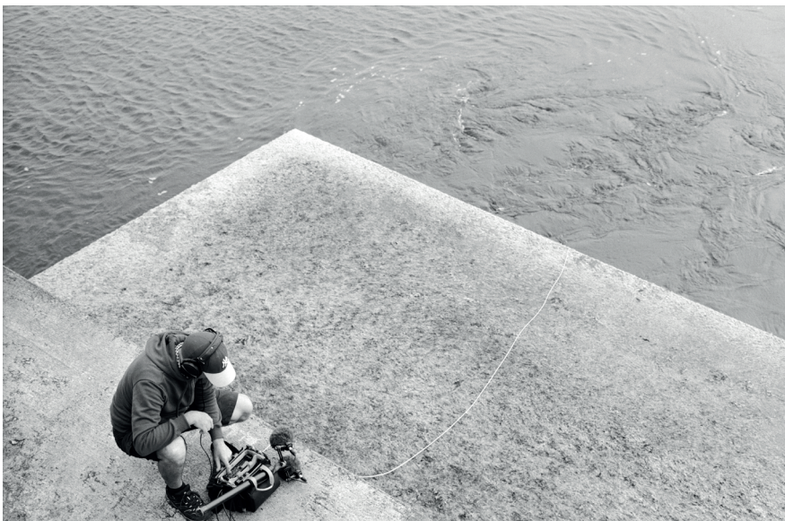
Waters' Witness recording session, 2018