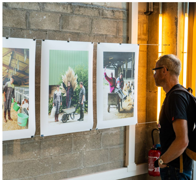
Vue de l'exposition de la première édition du Prix Utopi-e aux Magasins généraux, Pantin. Photo © Mathis Payet Descombes - © Les artistes & Utopi-e

Le Prix Utopi-e s'est enfin associé à Artagon afin de proposer une nouvelle opportunité pour les dix artistes avec la possibilité, pour celles et ceux qui le souhaitent, d'effectuer une résidence de deux semaines à la Maison Artagon dans le Loiret aux dates de leur choix, entre septembre 2022 et juillet 2023. Artagon a ainsi souhaité inverser la logique traditionnelle des prix artistiques, en donnant le choix aux artistes.