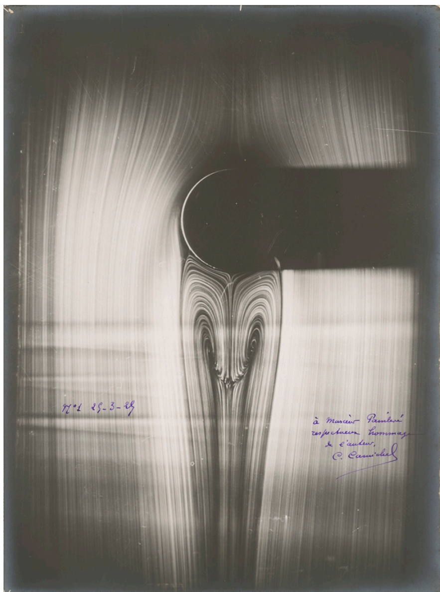
Charles Carmichel, Mécanique des fluides # 1, 1925

Ses recherches en mécanique des fluides furent initiées à Toulouse en 1920, se focalisant sur l'hydraulique fluviale. En 1925, il réalise une série d'étonnantes photographies argentiques prises au microscope, dont il offrira quelques tirages à Paul Painlevé, le père de Jean Painlevé.