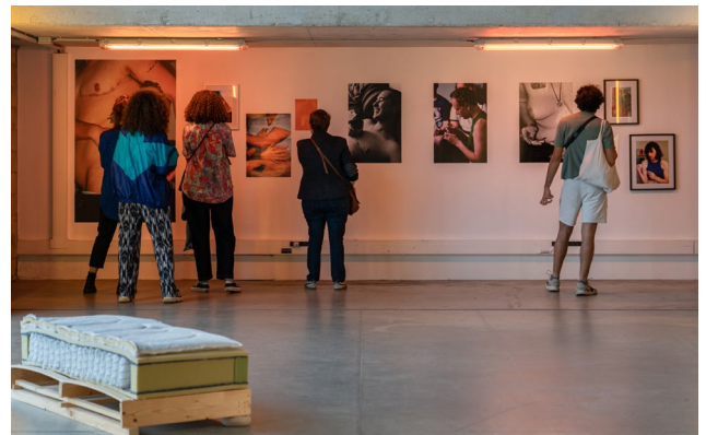
Vue de l'exposition de la première édition du Prix Utopi-e aux Magasins généraux, Pantin.

Les membres du jury tiennent à remercier les artistes du Prix Utopi-e pour l'engagement et la diversité de leurs propositions artistiques, et saluent leur décision : « nous sommes convaincu-es que leur choix de partager les dotations financières est le meilleur et leur apportons tout notre soutien. »