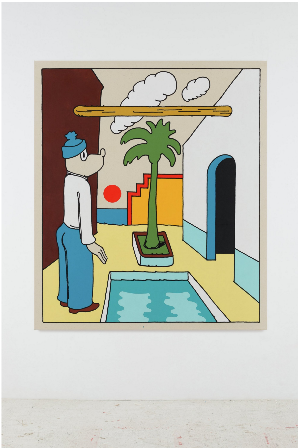
Bagno Paradiso, 2022

Acrylic on canvas. Acrílico sobre lienzo 150 x 130 cm FV.201