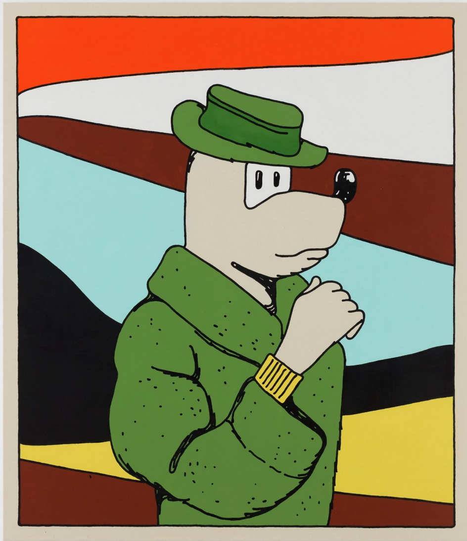
Rainbow Man, 2022

Acrylic on canvas. Acrílico sobre lienzo 150 x 130 cm FV.185